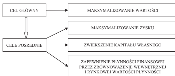
Rys. 1. Wiązka celów przedsiębiorstwa

Płynność odgrywa ważną rolę w każdym przedsiębiorstwie. W wiązce celów znalazła ona miejsce w celach pośrednich, determinujących osiągnięcie celu głównego – maksymalizowania wartości przedsiębiorstwa. Cele te przedstawiono na rys. 1.