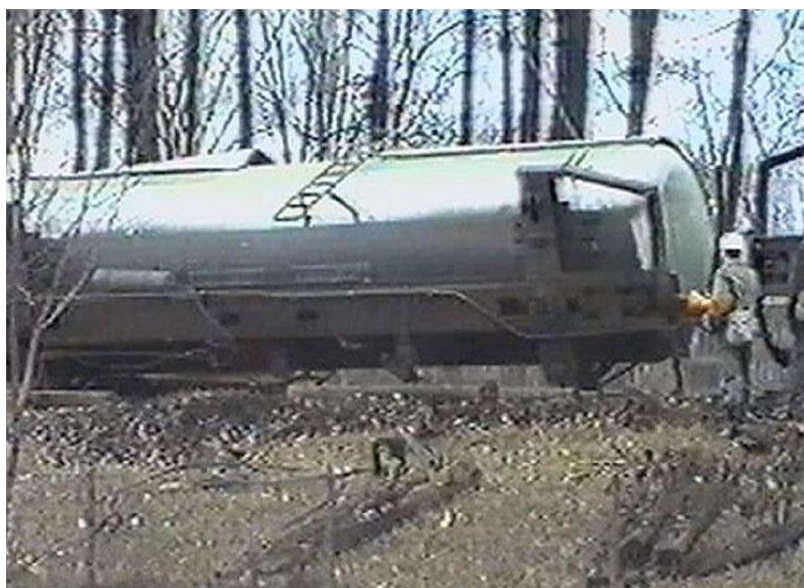
Rys. 2. Wstawianie radzieckich wagonów cystern na tory po wykolejeniu 9 marca 1989 r. w Białymstoku

ok. 120 metrów. Przyczyną zdarzenia okazała się pęknięta szyna. Wagony szczęśliwie wstawiono na tory. Gdyby doszło do rozszczelnienia przynajmniej jednej cysterne z chlorem, życie biologiczne w promieniu od kilku do kilkunastu kilometrów nie byłoby możliwe [15].