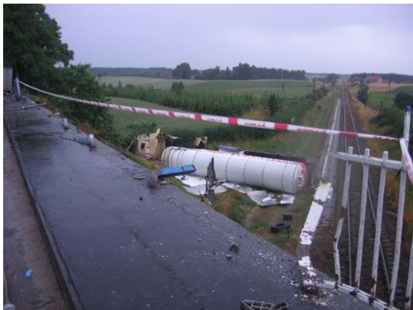
Rys. 1. Upadek cysterny z wiaduktu przebiegającego nad torami kolejowymi (linia nr 201) samochodu – cysterny z 20t gazu propan-butan wprost na peron przystanku Podleś w dniu 14.07.2008 r.

techniczne systemów (np. taboru lub infrastruktury). Trzecia grupa przyczyn to te niezależne od systemu kolejowego, ale wpływające na niezawodność funkcjonowania kolei lub mające miejsce na torach kolejowych (np. spadek cysterny z wiaduktu na teren kolejowy; rys. 1) [2].