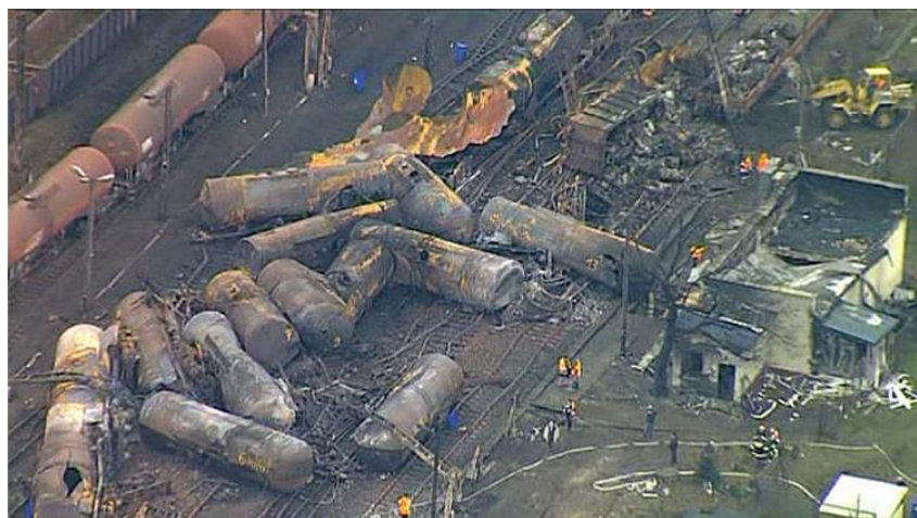
Rys. 3. Skutki katastrofy w Białymstoku z 8 listopada 2010 roku

Najbardziej niebezpieczne pozostają zdarzenia, gdy udział biorą pociągi z pasażerami. W środę 30 sierpnia 2017 r. wieczorem na stacji Smętowo doszło do nieuprawnionego wjazdu pociągu towarowego spółki STK na tor główny zasadniczy nr 2, po którym poruszał się pociąg pasażerski Intercity relacji Gdynia Główna (- Bielsko Biała) - Zakopane. Po gwałtownym hamowaniu i zderzeniu z pociągiem towarowym wykoł się pociąg pasażerski. Poszkodowanych zostało co najmniej 28 osób. Na szczęście dodatkowo nie doszło do poważnych w skutkach uszkodzeń składu towarowego.