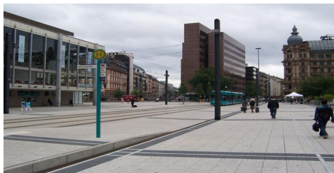
Rys. 7. Odcinek funkcjonujący jako „shared space” na Willy Brandt Platz we Frankfurcie nad Menem

Kolejnym sposobem lokalizacji torowiska w przestrzeni miejskiej jest tzw. „shared space” (rys. 7). Jest to poprowadzenie torowiska przez strefę ruchu pieszego. W przestrzeni przeznaczony zarówno dla pieszych jak i tramwajów brak jest sygnalizacji świetlnej, przejść dla pieszych i krawężników. Wszyscy uczestnicy ruchu są równouprawnieni. Motorniczy musi dostosować prędkość do panujących warunków ruchu. Rozwiązanie to wymusza na pieszych i motorniczych większą ostrożność i wbrew pozorom w miejscach, gdzie zastosowano taki system liczba wypadków z udziałem pieszych maleje [23]. Mimo wszystko, wymagana jest wysoka kultura komunikacyjna i szereg badań przed realizacją takiego systemu.