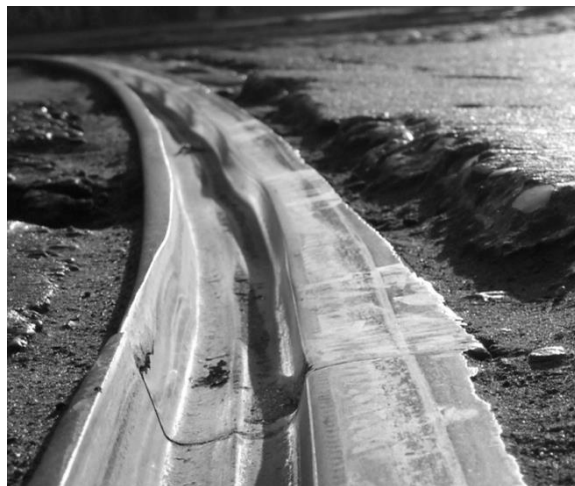
Rys. 1. Falowy charakter zużycia bocznego szyny w łuku poziomym