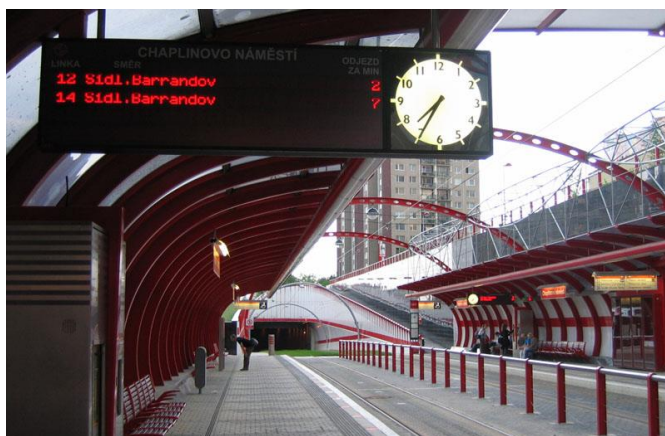
Rys. 4. Wyraźnie wydzielone strefy na przystanku przy linii tramwajowej na Barrandov w Pradze

Na bezpieczeństwo na wyspie przystankowej wpływa także odseparowanie użytkowników transportu zbiorowego od ruchu samochodowego przy pomocy barier, słupków oddzielających lub żywoplotów. Rozwiązanie takie powoduje, że pasażerowie mają wydzieloną strefę poruszania się, co wpływa na ich poczucie komfortu oraz podświadomie podnosi poziom ostrożności. Stanowi także utrudnienie w przechodzeniu przez jezdnię lub dobieganiu do przystanku w miejscu do tego niedozwolonym (rys. 4 i 5) [4].