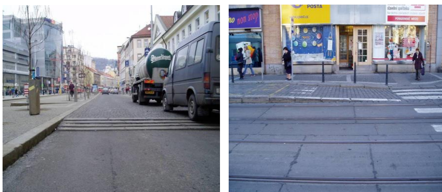
Rys. 2. Przystanki z wyniesionym pasem ruchu w Pradze (po lewej ul. Milady Horákové, po prawej ul. Anděl)

gdy tramwaj dopiero wjeżdża na wytyczone miejsce zatrzymania. Pasażerowie zaczynają wchodzić na jezdnię, gdy na przystanek wjedzie 70% długości tramwaju [5]. Co więcej, jako minus wskazuje się całkowite zrównanie powierzchni jezdni i chodnika. Tworzy to niewyraźny podział przestrzeni i może być kłopotliwe dla osób starszych, bądź niewidomych.