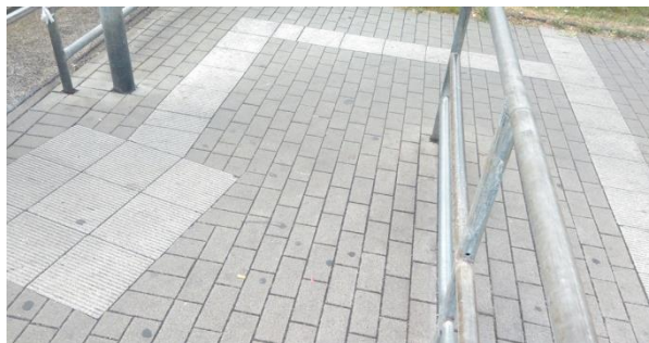
Rys. 13. Nawierzchnia ułatwiająca przechodzenie osobom niewidomym

ców bardzo długiej wyspy przystankowej i na łuku trasy tramwajowej, co jeszcze bardziej prowokuje pieszych do łamania przepisów i ogranicza widoczność.