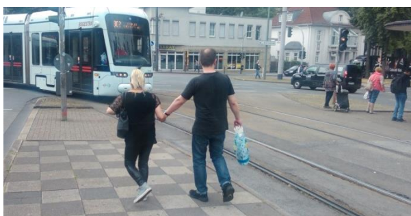
Rys. 12. Przejście dla pieszych w Gelsenkirchen

Na przejściach przez jezdnię dochodzi do największej liczby wypadków z udziałem pieszych, stąd koniecznością jest stosowanie dodatkowych środków ochronnych w celu zapewnienia pieszym użytkownikom ruchu bezpieczeństwa. Wyraźne wyodrębnienie i oznakowanie przejścia dla pieszych jest priorytetem w jego kształtowaniu.