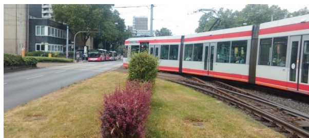
Rys. 5. Wyraźnie wydzielone strefy na przystanku przy linii tramwajowej na Barrandov w Pradze