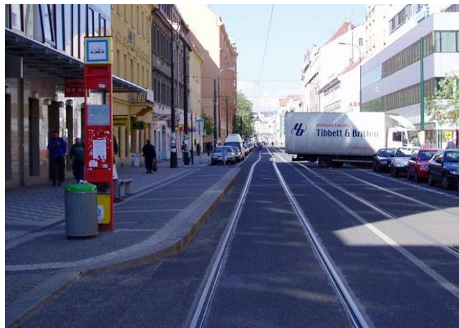
Rys. 3. Kontrzatoka na przystanku tramwajowym w Pradze, ul. Sokolovská

Pierwszorzędym kryterium warunkującym bezpieczeństwo wsiadania i wysiadania z tramwaju jest wysokość krawędzi peronu ponad główkę szyny oraz odległość od osi toru. Odstęp pomiędzy krawędziami powinien zapewniać wygodną wymianę pasażerów, być możliwie jak najmniejszy, jednak powinien uwzględniać pewną wartość ochronną, między innymi związaną z dokładnością wykonania krawędzi peronu, ułożeniem toru, czy też zużywaniem taboru lub deformacjami wynikającymi z eksploatacji. Jako właściwą wartość odstępu można przyjąć 5 cm [15]. Jednak ze względu na stosowanie drzwi odskokowo-przesuwnych starszej generacji w tramwajach niskopodłogowych, bądź przystanków zlokalizowanych w łuku lub drzwi znajdujących się na skosach pudeł wagonów w klasycznych tramwajach zaleca się stosować pochylnie tramwajowe. W rozwiązaniu tym zarówno w pionie jak i w poziomie występuje pewien odstęp pomiędzy krawędziami drzwi i przystanku. Jednak dostęp dla matek z wózkami bądź osób niepełnosprawnych jest możliwy do pokonania dzięki rozkładanej bądź wysuwanej pochylni lub obniżonych drzwiach taboru. Jeśli nie wszystkie drzwi są wyposażone w tego typu udogodnienia, na drzwiach powinna być umieszczona informacja w formie piktogramu.