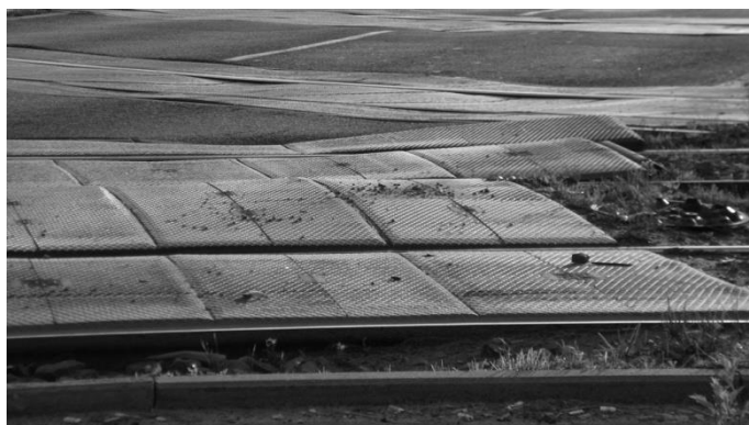
Rys. 10. Deformacja płyt na przejeździe tramwajowym

Innym aspektem jest zły stan nawierzchni na przejazdach tramwajowych. Do jego najczęstszych przyczyn można zaliczyć nieprawidłowo zaprojektowane lub wykonane odwodnienie przejazdu, nieregularne zagęszczenie podbudowy, brak reakcji na wymagające bezzwłocznej naprawy uszkodzenia elementów konstrukcyjnych przejazdu, niską jakość wykonania przejazdu ze względu na ograniczone środki finansowe [9].