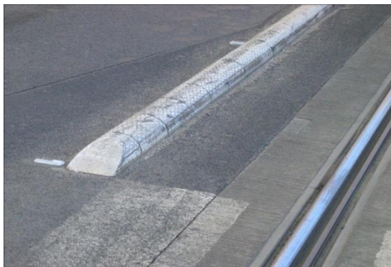
Rys. 6. Separatory drogowe w czeskiej Pradze

Pierwszym typem są niewydzielone torowiska wbudowane w jezdnię. W takim przypadku tramwaj uczestniczy w ruchu z innymi pojazdami. Zwiększa to prawdopodobieństwo kolizji, stanowi utrudnienie dla płynności ruchu zarówno tramwajów, jak i samochodów. Aby w pewien sposób oddzielić ruch tramwajowy od samochodowego wynosi się ponad powierzchnię jezdni separatory ruchu (rys. 6). Należą one do grupy urządzeń bezpieczeństwa ruchu drogowego, które poprawiają płynność jazdy, usprawniając tym samym ruch na drodze. Komplementarnie, aby spotęgować ich działanie mogą być stosowane znaki poziome, bądź słupki ostrzegawcze. Ponadto, aby zapewnić komfort wsiadania podróżnym na przystankach, konieczna jest specjalnie do tego dostosowana infrastruktura, zastosowanie przystanków wiedeńskich lub przyładkowych, co nie zawsze jest możliwe, w szczególności w centrach miast, gdzie zajętość terenu na to nie pozwala [11].