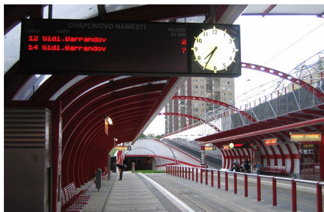
Rys. 4. Wyraźnie wydzielone strefy na przystanku przy linii tramwajowej na Barrandov w Pradze

Na bezpieczeństwo na wyspie przystankowej wpływa także odseparowanie użytkowników transportu zbiorowego od ruchu samochodowego przy pomocy barier, słupków oddzielających lub żywoplotów. Rozwiązanie takie powoduje, że pasażerowie mają wydzieloną strefę poruszania się, co wpływa na ich poczucie komfortu oraz podświadomie podnosi poziom ostrożności. Stanowi także utrudnienie w przechodzeniu przez jezdnię lub dobieganiu do przystanku w miejscu do tego niedozwolonym (rys. 4 i 5) [4].