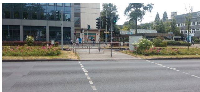
Rys. 14. Labirynt na przejściu dla pieszych w Gelsenkirchen

Kolejnym aspektem, wartym odnotowania jest oddzielenie ruchu pieszego od tramwajowego i wzmożenie ostrożności pieszych podczas dochodzenia do strefy ruchu tramwajów (rys. 13 i 14). Zupełne odseparowanie zapewniają kładki i tunele, jednak jednym z wymagań stawianym w planie zrównoważonego rozwoju jest ograniczanie liczby przejść po schodach i kładkach w infrastrukturze transportu publicznego.