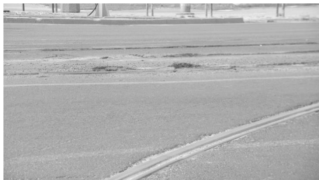
Rys. 11. Wypiętrzania nawierzchni z asfaltu lanego