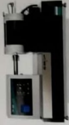
DIL 402 Expedis® Series Rozszerzalność ciepłota