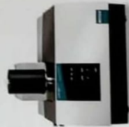
LFA 467 HT HyperFlash® Przewodność i dyfuzyjność ciepłota