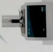
DSC 214 Polyma® Identyfikacja tworzyw sztucznych