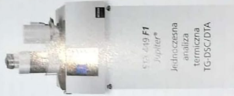
STA 449 F1 Jupiter® Jednoczesna analiza termiczna TG-DSC/DTA

Więcej informacji na https://www.netzsch-thermal-analysis.com/pl/