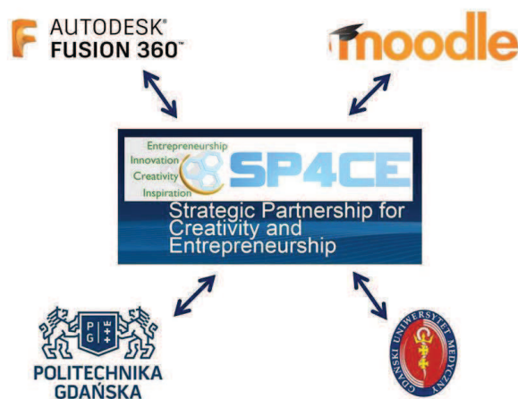
Ryc. 1. Schemat współpracy PG – GUMed – SP4CE

Za sprawą nawiązanego porozumienia powstały tzw. „pokoje nauki” (LR) (ang. Learning Room) na platformie Moodle dedykowanej do pracy nad poszczególnymi projektami grupowymi. Idea współpracy została przedstawiona na poniższym schemacie (ryc. 1).