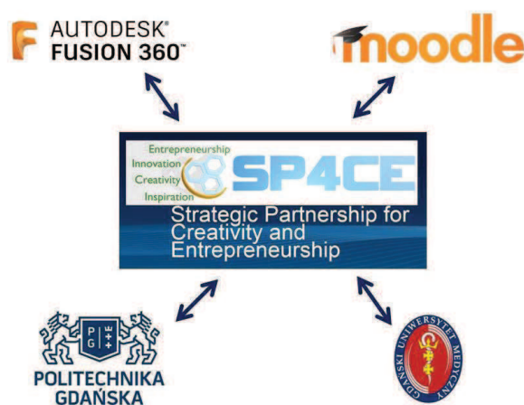
Ryc. 1. Schemat współpracy PG – GUMed – SP4CE

Za sprawą nawiązanego porozumienia powstały tzw. „pokoje nauki” (LR) (ang. Learning Room) na platformie Moodle dedykowanej do pracy nad poszczególnymi projektami grupowymi. Idea współpracy została przedstawiona na poniższym schemacie (ryc. 1).