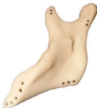
Ryc. 4. Prototyp implantu indywidualnego żuchwy po resekcji kości, [Halman, Etmańska 2017]

został stop tytanu Ti13Nb13Zr pokryty hydroksyapatytem. Modelu implantu wytworzony technologią druku 3D z zastosowaniem materiału ABS przedstawiony jest na ryc. 4.