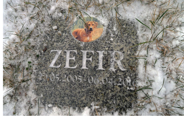
Il. 3. Gdańsk, grzebowisko Zawsze Razem – typowy nagrobek

Fig. 2. Pet cemetery Brzozowa Przystań in Mochle