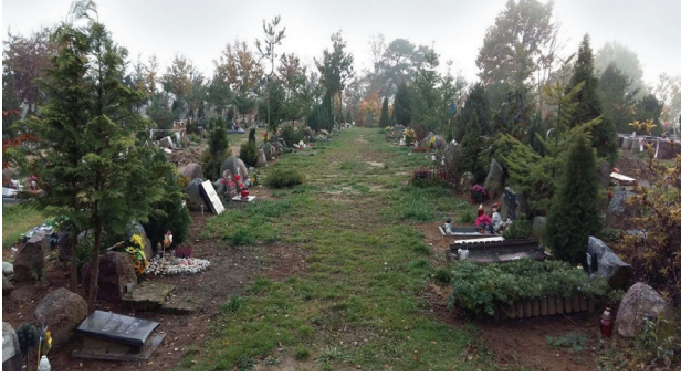
Il. 2. Grzebowisko Brzozowa Przystań, Mochle (źródło: http://brzozowaprzystan.pl/wp-content/uploads/2015/11/cmentarz_dla_zwierza_bydgoszcz-3.jpg [data dostępu: 7.08.2017])

Fig. 2. Pet cemetery Brzozowa Przystań in Mochle (source: http://brzozowaprzystan.pl/wp-content/uploads/2015/11/cmentarz_dla_zwierza_bydgoszcz-3.jpg [accessed: 7.08.2017])