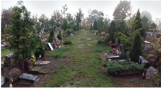
Il. 2. Grzebowisko Brzozowa Przystań, Mochle (źródło: http://brzozowaprzystan.pl/wp-content/uploads/2015/11/cmentarz_dla_zwierza_bydgoszcz-3.jpg [data dostępu: 7.08.2017])

Fig. 2. Pet cemetery Brzozowa Przystań in Mochle (source: http://brzozowaprzystan.pl/wp-content/uploads/2015/11/cmentarz_dla_zwierza_bydgoszcz-3.jpg [accessed: 7.08.2017])