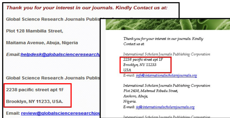
Ryc. 2. Adresy do kontaktu na stronie wydawnictw: Global Science Research Journals oraz International Scholars Journals Publishing Corporation

Większość wyżej wymienionych kryteriów spełnia np. wydawnictwo Global Science Research Journals (GSRJ), mające w ofercie prawie 100 tytułów czasopism z różnych dziedzin nauki, w tym ponad 20 medycznych. Amerykański adres ich siedziby wydaje się nieprawdziwy (z Google Maps wynika, że to mały dwupiętrowy budynek); dokładnie taki sam zapis (z nazwą ulicy pisaną małą literą) podaje inne drapieżne wydawnictwo - International Scholars Journals Publishing Corporation (Ryc. 2).