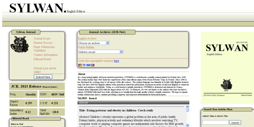
Ryc. 6. Witryna internetowa fałszywego czasopisma Sylwan. English Edition