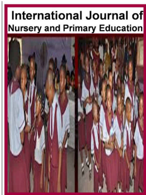
Ryc. 3. Okładka czasopisma International Journal of Nursery and Primary Education

Zamieszczone na stronie GSRJ okładki czasopism wyglądają nieprofesjonalnie, są złej jakości (np. International Journal of Nursery and Primary Education ), niekiedy z błędami (np. w tytule Global Journal of medical, Physical and Health Education „medical” pisane małą literą).