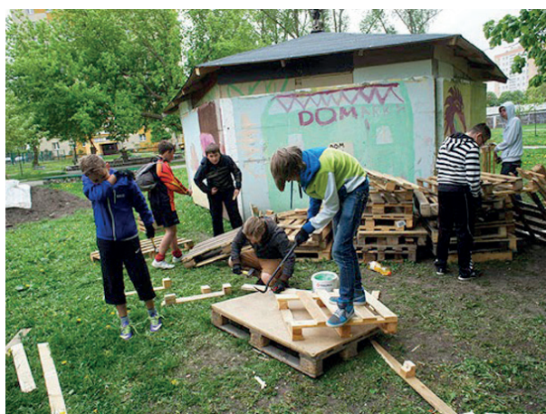
Rys. 7. Prace nad „Ogrodem Rzeźby Rolnej przy DOMu” w Elblągu

wychowaniem czy zapewnieniem możliwości pożytecznego i rozwijającego umiejętności spędzenia czasu wolnego. Podczas pracy w ogrodzie rzeźby rolnej dzieci i młodzież poznawały się nawzajem, tworzyły mikrospołeczność, uczyły się, że wspólna praca jest bardziej produktywna, ale i przyjemniejsza. Autor zachęcał uczestników do wykonywania czyn-