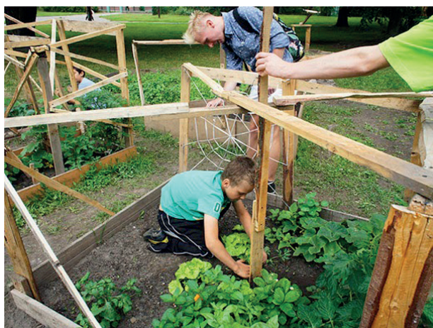
Rys. 8. Prace nad „Ogrodem Rzeźby Rolnej” przy DOMu w Elblągu

Fig. 8. Work on the ‘Agricultural Sculpture Garden’ at the Elbląg House