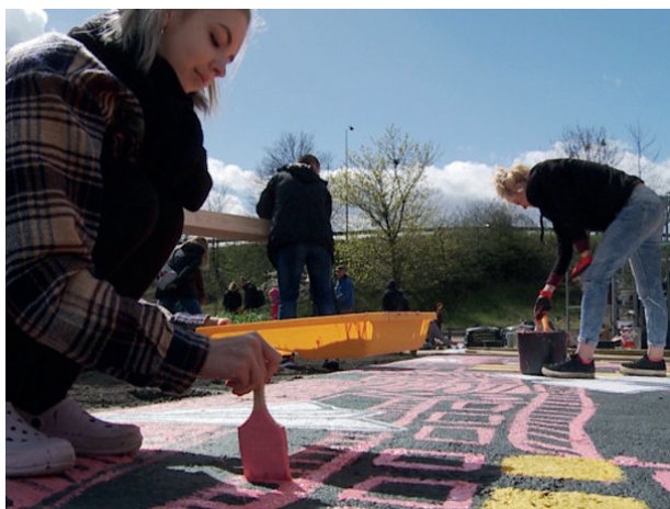
Rys. 9. Prace nad poziomym murem na Zaspie w Gdańsku Fig. 9. Work on a horizontal mural on Zaspia in Gdansk

W tym projekcie widać wyraźnie aspekt społeczny. Młodzi artyści i architekci razem pracowali z dziećmi i osobami dorosłymi na co dzień niezwiązanymi z działaniami przestrzennymi nad poprawą jakości przestrzeni miejskiej. Rezultatem ich działań była nie tylko poprawa odbioru tej przestrzeni, ale również zmiana zachowań i przyzwyczajeń mieszkańców.