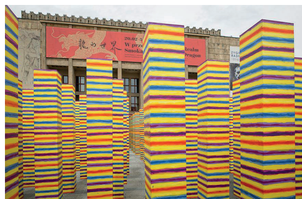
Rys. 6. Instalacja w Kielcach autorstwa Leona Tarasewicza

Source: photo by K. Pęczalski, Leon Tarasewicz, Instalacja... (2019)