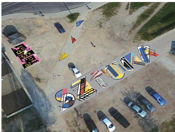
Rys. 10. Poziomy mural na Zaspie w Gdańsku Fig. 10. Horizontal murals on Zaspia in Gdansk Źródło: Gdańska Szkoła Muralu (2017)

Zyskali oni przyjazne miejsce do spędzenia czasu wolnego oraz pokazano im, jak ważna jest praca wspólna i jeden wyraźny cel, a także jak wiele może osiągnąć zgodna wspólnota. Dzięki temu przedsięwzięciu miejsce stało się chętniej odwiedzane i użytkowane nie tylko przez mieszkańców osiedla, ale również przez innych mieszkańców Trójmiasta.