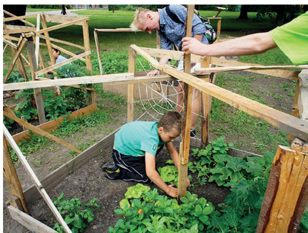
Rys. 8. Prace nad „Ogrodem Rzeźby Rolnej” przy DOMu w Elblągu

Fig. 8. Work on the ‘Agricultural Sculpture Garden’ at the Elbląg House