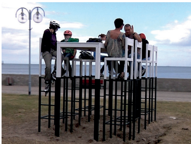
Rys. 1. „Gdynia Playground 2011”