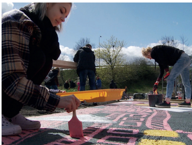
Rys. 9. Prace nad poziomym murem na Zaspie w Gdańsku Fig. 9. Work on a horizontal mural on Zaspia in Gdansk

W tym projekcie widać wyraźnie aspekt społeczny. Młodzi artyści i architekci razem pracowali z dziećmi i osobami dorosłymi na co dzień niezwiązanymi z działaniami przestrzennymi nad poprawą jakości przestrzeni miejskiej. Rezultatem ich działań była nie tylko poprawa odbioru tej przestrzeni, ale również zmiana zachowań i przyzwyczajeń mieszkańców.