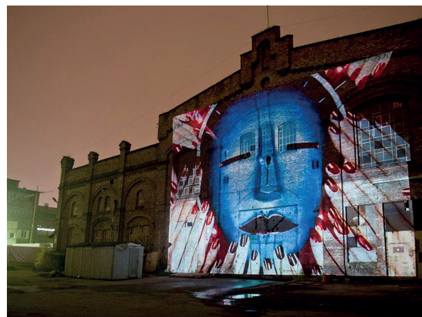
Rys. 4. „Narracje 2012”