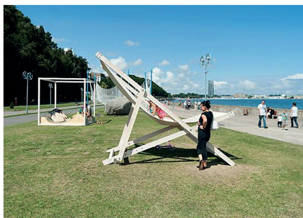
Rys. 2. „Gdynia Playground 2013”