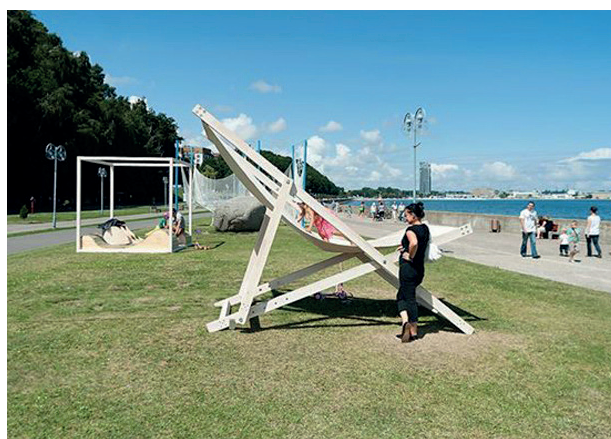
Rys. 2. „Gdynia Playground 2013”