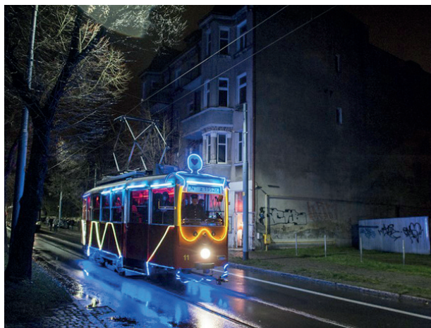
Rys. 3. „Narracje 2009”

Projekt ma na celu zachęcić mieszkańców miasta do odkrywania na nowo miejsc od dawna im znanych.