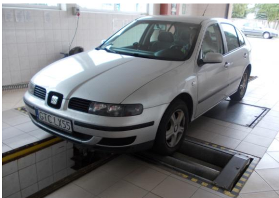
Rys. 1. Widok przodu i boku samochodu Seat Leon na stanowisku diagnostycznym

Widok załadowanego samochodu Seat Leon (5 litrowymi pojemnikami z płynem) w trakcie przeprowadzanych badań wpływu ciężaru pojazdu na wskaźnik skuteczności hamowania przedstawiają rys. 2 i rys. 3.