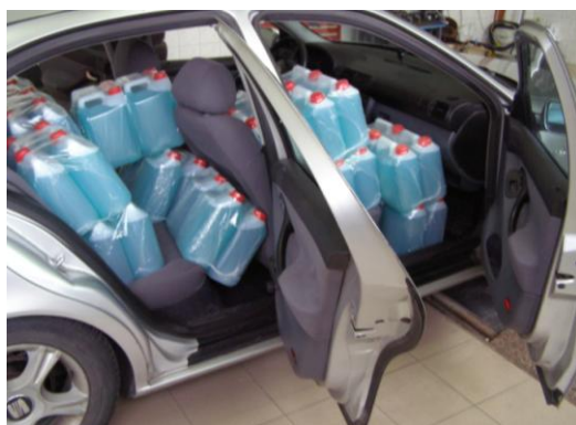
Rys. 3. Widok maksymalnie obciążonego samochodu Seat Leon