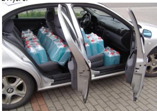
Rys. 2. Widok częściowego obciążonego samochodu Seat Leon

Widok załadowanego samochodu Seat Leon (5 litrowymi pojemnikami z płynem) w trakcie przeprowadzanych badań wpływu ciężaru pojazdu na wskaźnik skuteczności hamowania przedstawiają rys. 2 i rys. 3.