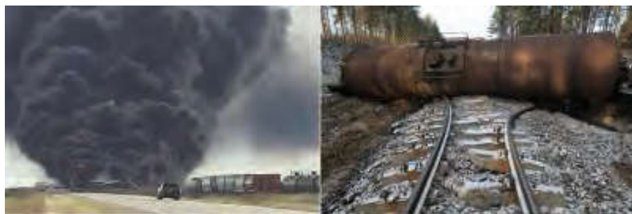
1. Katastrofy kolejowe: a) w kanadyjskiej prowincji Saskatchewan 7.10.2014; b) w Wydmینach 2.01.2016.

piecznych o właściwościach utleniających, palnych, toksycznych itp. do otoczenia (wyciek podczas zderzenia – kolizji, wykolejenia, rozszczelnienia się cysterny podczas transportu itp.) może wystąpić ryzyko katastrofy ekologicznej.