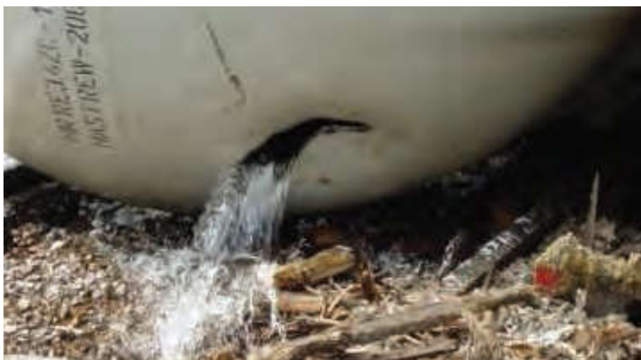
2. Negatywny wpływ katastrofy kolejowej na podtorze. Katastrofa w Szczygłowicach 23.05.2002 [10]

Wszystkie te materiały mają negatywny wpływ na podtorze i jego elementy, np. pod ich wpływem zmieniają się podstawowe właściwości geosyntetyków stosowanych w konstrukcjach podtorza (np. nasypy, wykopy) w zakresie ich przepuszczalności, wytrzymałości i odkształcenia. Powszechne wykorzystanie geosyntetyków do zbrojenia gruntu w podtorzu i związanych z nim konstrukcjach oporowych, czy wzmocnianie za pomocą geosyntetyków lokalnych kawern powoduje ich mobilizację na rozciąganie. W tych nowych warunkach zmienia się charakter współpracy grunt – geosyntetyk. Zmieniają się charakterystyki materiałowe wywołane wysokimi temperaturami i czynnikami chemicznymi, a dalej zmieniają się charakterystyki i parametry opisujące zachowanie się strefy kontaktowej. Są one inne niż przyjęte w projektowaniu lub badaniach teoretycznych zależności współpracy (grunt – geosyntetyk lub grunt – geosyntetyk – grunt itp.) i fakt ten należy uwzględnić przy remediacji [4].