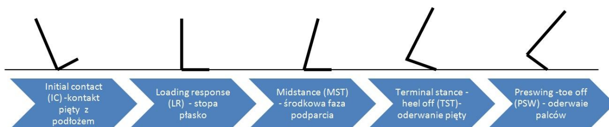
Rys. 2.1 Położenie stopy w fazie podporu [5].