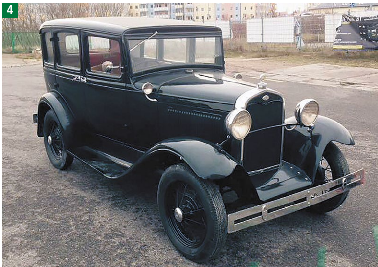
Nieprawidłowości wynikające z wyposażenia pojazdu Ford A z 1928 roku