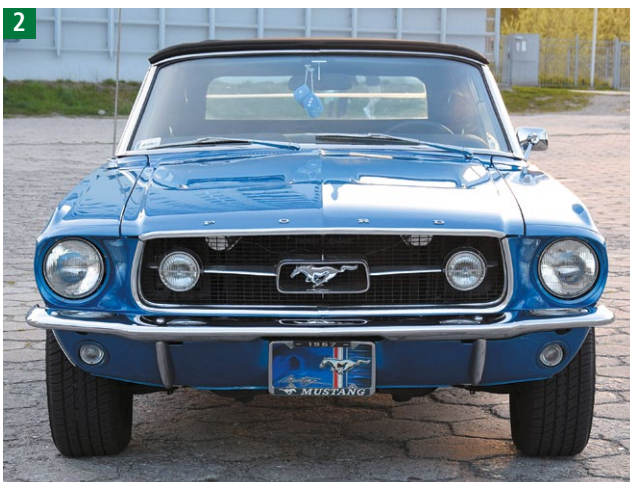
Niezgodne z wymaganiami przednie oświetlenie Forda Mustanga z 1967 r.