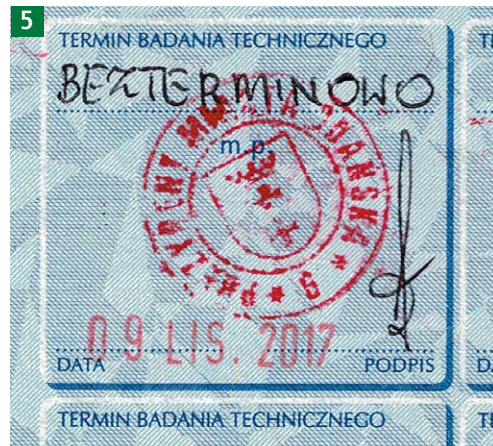
Dowód rejestracyjny z wpisem o bezterminowym badaniu technicznym

Zadaniem diagnosty jest podjęcie decyzji, które ograniczenia wprowadzi do ruchu drogowego dla danego pojazdu poprzez umieszczenie słowa TAK lub NIE przy danym ograniczeniu. Diagnosta ma również możliwość wprowadzenia przez siebie zaproponowanego dodatkowego rodzaju ograniczenia lub dodatkowych ograniczeń w pozycji INNE, które wcześniej w omawianym punkcie nie były wymienione.