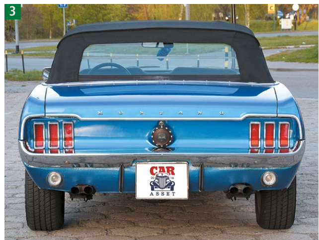
Niezgodne z wymaganiami tylne oświetlenie Forda Mustanga z 1967 r.