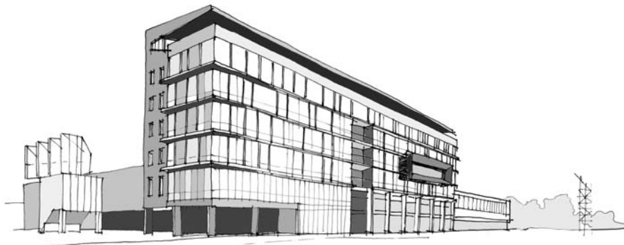
Ryc. 1. Budynek Międzynarodowych Targów Gdańskich

kiem wodnej rozrywki, multimedialne centrum nauki, centrum medyczne, lokale gastronomiczne i handlowe oraz czterogwiazdkowy hotel. Co ciekawe w obiekcie tym planowane jest stworzenie przestrzeni publicznej, z której będą mogli korzystać użytkownicy pobliskiego stadionu. Oprócz tego powstanie kilkaset, a docelowo nawet kilka tysięcy nowych mieszkań wybudowanych przez deweloperów. Dodatkowym elementem projektu rozwoju dzielnicy nazwanego Letnica 3.0, jest planowana budowa kompleksu sześciu boisk z naturalną i sztuczną nawierzchnią. Nowe inwestycje będą powstawały na zasadzie partnerstwa publiczno-prywatnego. Liczne przykłady dużych projektów rewitalizacyjnych prowadzonych w Europie, m.in. Docklands w Londynie, projekt Euralille w Lille, rewitalizacja portu w Genui czy przebudowa centrum północnego w Zurychu, pokazują, że jest to niezwykle słuszne podejście do tego typu inwestycji. Jak pisze Mironowicz: Wnioski, jakie sformułowano po analizie transformacji londyńskich Docklands należy chyba w części uznać za zasady, które dają szansę na powodzenie operacji przekształcenia dużych obszarów miejskich. Należy tu chyba wymienić w pierwszym rzędzie partnerstwo publiczno-prywatne. Owo partnerstwo może (...) przybierać różne formy, jednak zawsze musi uwzględniać potrzeby partnera prywatnego. Bez tego elementu nie zdoła się przyciągnąć inwestycji, w jakiegokolwiek formie by się one nie odbywały [Mironowicz 2009] (ryc. 2).