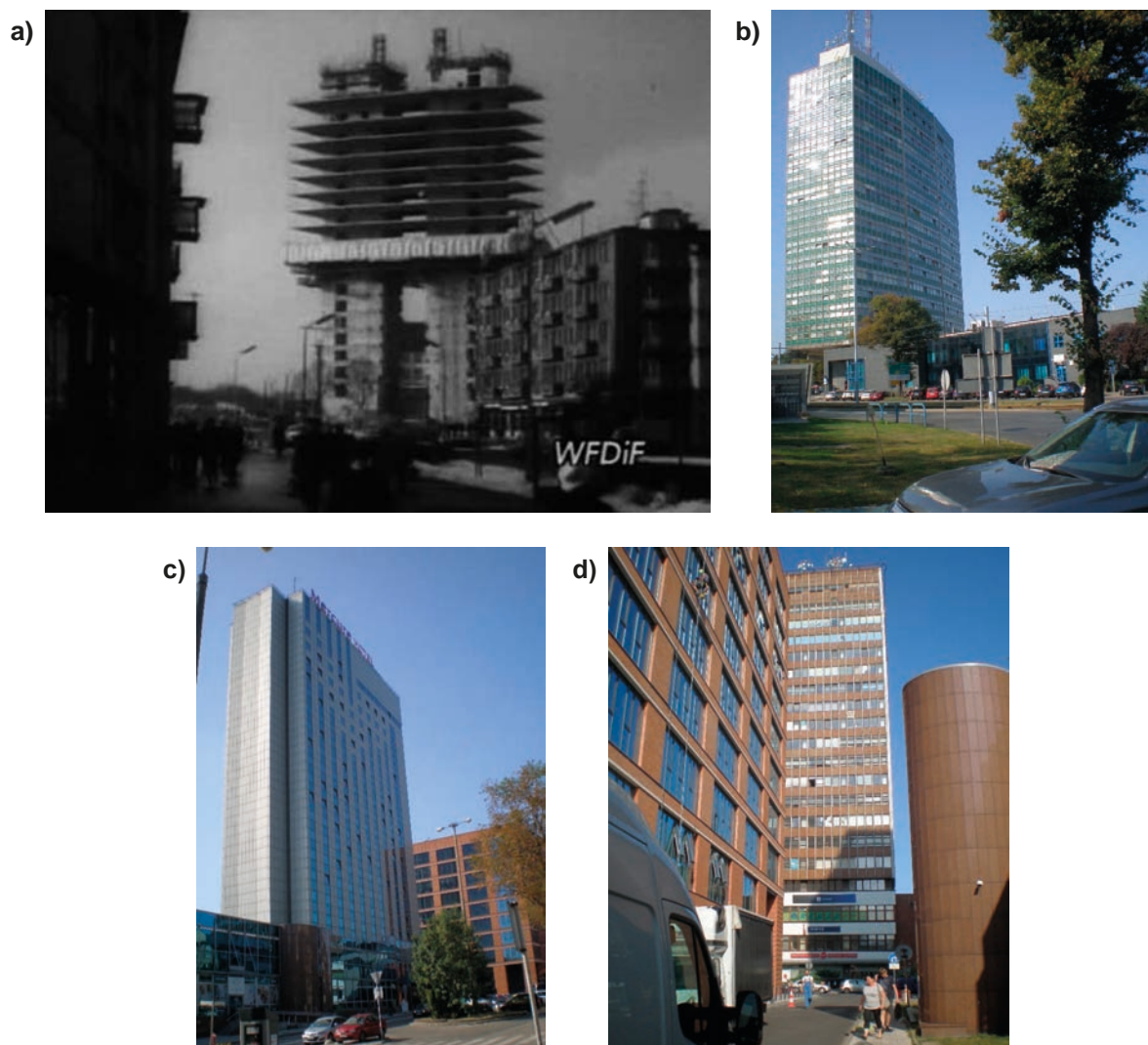
Rys. 2. Widok punktowców w Gdańsku

a) budynek Centrum Techniki Okrętowej „Zieleniak” (72,0 m) na etapie budowy w technologii „trzonolinowej”, 1971 rok, [25], b) elewacje „Zieleniaka” od strony południowo-wschodniej, c) Hotel Mercure „Hevelius” (70 m) i d) w głębi biurowiec „PROREM” (Organika) w Gdańsku przy ul. Rajskiej, (80 m), (fot. własne, wrzesień 2019 rok)