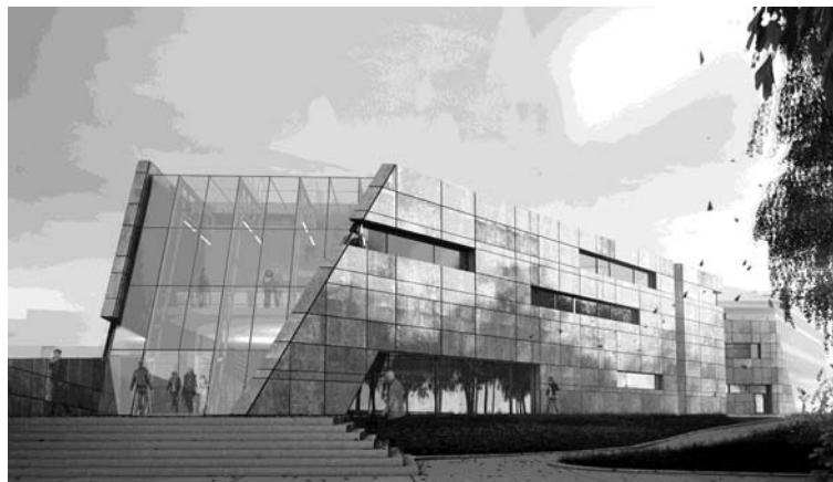
Ryc. 3. Centrum Dziedzictwa Historycznego Miasta Gdańska

Innym ważnym elementem w koncepcji CDHMG i starannie przemyślanym przez autorów projektu jest (zastosowana na fasadach, ale również i na dachu projektowanego budynku) zieleń spatynowanej miedzianej blachy. Ten szmaragdowy odcień zieleni wpisany jest immamentnie w koloryt „brązowo-ceglanego” (w swym ogólnym odbiorze) historycznego Gdańska, a występuje zawsze tam, gdzie architekt chciał podkreślić i wskazać wyjątkowy charakter, czasem niewielkiego skąd, ale niezwykle istotnego elementu. Zieleń ta pokrywa hełmy wszystkich gdańskich wież kościelnych i wież ratuszowych, zdobi kopułę Kaplicy Królewskiej i hełmy (bli-