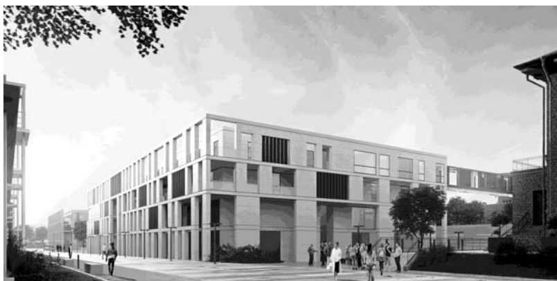
Ryc. 4. Centrum Ekoinnowacji Politechniki Gdańskiej

Budynek Centrum Ekoinnowacji Politechniki Gdańskiej jest twórczą kontynuacją przyjętych wcześniej rozwiązań, uwzględniającą w sposób możliwie najpełniejszy następujący w okresie dzielącym oba dzieła rozwój współczesnej myśli architektonicznej oraz rozwój techniczny i technologiczny, ze szczególnym uwzględnieniem rozwiązań proekologicznych i mających swe źródła w filozofii rozwoju zrównoważonego (ryc. 4). Intencją autora było również to, aby przez skalę budynku Centrum Ekoinnowacji oraz poprzez artykulację jego fasad stworzyć architektonicznie spójną i harmonijną kontynuację pierzei wschodniej ulicy Siedlickiej, zapoczątkowaną realizacją budynku Nanotechnologii „B”. Zachowanie ciągłości stylistycznej, porządkującej przestrzeń ulicy jest szczególnie ważne, zwłaszcza w kontekście bardzo niespójnej stylistycznie istniejącej architektury pierzei zachodniej.