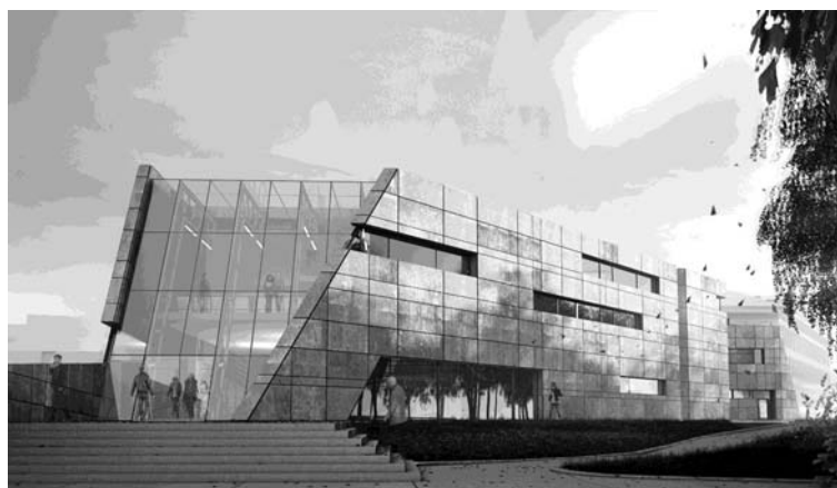
Ryc. 3. Centrum Dziedzictwa Historycznego Miasta Gdańska

Innym ważnym elementem w koncepcji CDHMG i starannie przemyślanym przez autorów projektu jest (zastosowana na fasadach, ale również i na dachu projektowanego budynku) zieleń spatynowanej miedzianej blachy. Ten szmaragdowy odcień zieleni wpisany jest immamentnie w koloryt „brązowo-ceglanego” (w swym ogólnym odbiorze) historycznego Gdańska, a występuje zawsze tam, gdzie architekt chciał podkreślić i wskazać wyjątkowy charakter, czasem niewielkiego skale, ale niezwykle istotnego elementu. Zieleń ta pokrywa hełmy wszystkich gdańskich wież kościelnych i wież ratuszowych, zdobi kopułę Kaplicy Królewskiej i hełmy (bli-