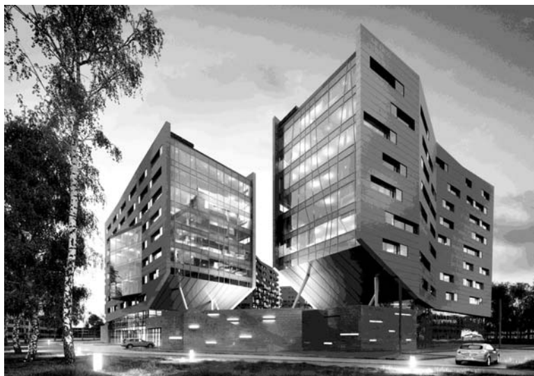
Ryc. 1. Budynki biurowe w osiedlu Gdańsk-Zaspa

Znacznie trudniejszą sytuacją jest działanie w kontekście silnie określonej, wartościowej zabudowy, jaką jest np. pochodząca z okresu międzywojennego architektura modernistyczna. Z takim przypadkiem mamy do czynienia w Gdyni, polskim mieście wzniesionym „na surowym korzeniu” w latach 20. i 30. XX w. Wszel-