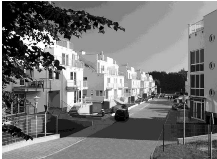
Fot. 2. Zespół zabudowy mieszkaniowej w Gdyni Orłowice

czas zachodzi możliwość realizacji zabudowy współczesnej. Stopień napięcia emocjonalnego związanego z projektowaniem i realizacją tego typu przedsięwzięcia sięga najwyższych poziomów twórczego zaangażowania. Architekt zmierzyć się tu musi nie tylko z niezwykle silnymi historycznymi i przestrzennymi uwarunkowaniami, skłaniającymi go do tworzenia kopii zabudowy historycznej, ale często również (głównie ze względu na wysokie oczekiwania społeczne wobec takiej architektury) z własnymi słabościami, przejawiającymi się najczęściej przemożną chęcią stworzenia czegoś naprawdę wyjątkowego, dorównującego, a najlepiej przewyższającego swą wartością istniejącą zabudowę historyczną. Kluczem do wyjścia z opresji nie jest naturalnie ani przesadne twórcze samoograniczenie i nadmierna skromność ani też ostentacyjny brak respektu dla zastanych wartości, ale ich dogłębne rozpoznanie i zrozumienie pozwalające na podjęcie prawidłowych decyzji projektowych. Nie powielanie, ale twórcze przetwarzanie wzorców i archetypów stanowić tu może pomost między historią a terażniejszością. Nie można robić użytku z pięknej architektury minionych epok, gdyż w nowych czasach, przy zmienionym sposobie życia, staje się ona nieprawdziwa i pretensjonalna [Rasmussen 2015: 13]. Najbardziej wartościowe dzieła powstają bowiem w wyniku stworzenia subtelnej równowagi – właściwej dla miejsca, czasu i zadania – pomiędzy tradycją miejscową a „importowanymi”, często-kroć nowymi ideami i technologiami 3 .