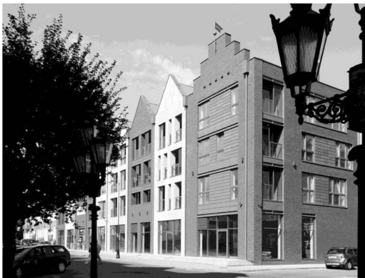
Fot. 3. Zespół zabudowy mieszkaniowo-usługowej w Gdańsku

Architektura kwartału, mimo że poprzez formę, skalę, proporcje oraz charakter bryły wyraźnie odnosi się do historycznej zabudowy Gdańska, to jednocześnie jest architekturą na wskroś współczesną, w której odniesienia historyczne w najmniejszym stopniu nie są ani bezpośrednimi przeniesieniami ani zapożyczeniami. O współczesnym wyrazie tej architektury decydują: charakterystyczny dla naszych czasów, czerpiący z dorobku stylu międzynarodowego sposób artykulacji fasad, „świeży” detal architektoniczny (np. minimalistyczne belki – nadproża wykonane z walcowanych ceowników) oraz zastosowane nowoczesne materiały i technologie budowlane np. blacha cynkowo-tytanowa wykorzystana, jako materiał elewacyjny. Poza ogólnym charakterem bryły kwartału, do elementów tworzących architekturę, która ma ambicję zyskania miana twórczości patrzącej w przyszłość, ale jednocześnie nie zapominającej o spuściźnie przeszłości, dołączyć należy jeszcze: usytuowaną na wewnętrznym dziedzińcu kwartału fontannę Neptuna (parafrazę słynnej gdańskiej fontanny stanowiącej symbol związków miasta z morzem), mur graniczny z płaskorzeźbą przedstawiającą uwspółcześnioną wersję historycznej panoramy miasta oraz wydobyte spod ziemi (w trakcie wykopalisk archeologicznych) i wyeksponowane w partech kamienic, gotyckie ściany ceglane.