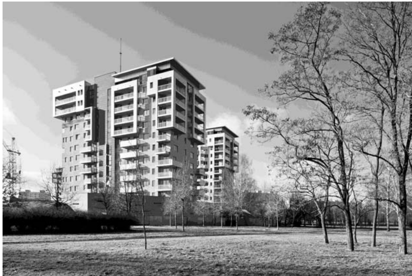
Fot. 1. Zespół mieszkaniowo-usługowy w osiedlu Gdańsk-Zaspa.

Autor: A. Taraszkiewicz z zespołem (fot. 1-4, ryc. 1-4)