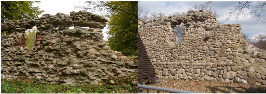
Ryc. 4 Fragment muru „Kujaw”: utrata „dramatyzmu” ceną za zachowanie zabytku... (2007, 2014)