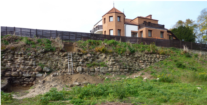
Ryc. 5 Mur skarpy przedzamcza zachodniego. Odkrywka archeologiczna po lewej stronie ukazuje głębokość posadowienia; widoczny budynek – prawdopodobna przyczyna zawalenia długiej partii muru (2017)