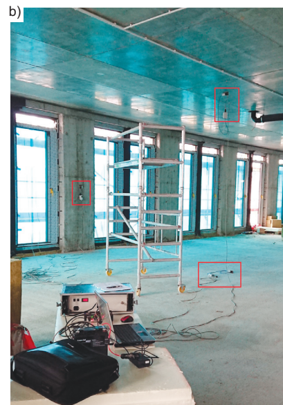
Widok na punkty (a) i stanowisko pomiarowe (b) View of points position (a) and measuring stand (b)

czynnik rozszerzenia k = 2 . W przypadku rozkładu normalnego jest to równoznaczne z poziomem ufności wynoszącym w przybliżeniu 95%.