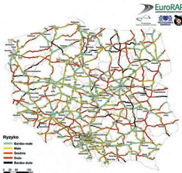
Rys. 4. Mapa ryzyka dla wypadnięć z jezdni

Z uwagi na to oraz na możliwości dostępne w dzisiejszych czasach coraz częściej tego typu testy przeprowadzane są w środowisku wirtualnym, np. w systemie LS-DYNA [15, 16]. Możliwe staje się to z powodu coraz szerszego dostępu do wysokowydajnych jednostek obliczeniowych, które są w stanie bardzo sprawnie rozwiązywać macierzowe układy równań algebraicznych występujące w Metodzie Elementów Skończonych (MES). Symulacje numeryczne z wykorzystaniem MES pozwalają na matematyczny opis zjawisk zachodzących w rzeczywistości. Po prawidłowym przygotowaniu i rozwiązaniu zadania możliwe jest na przykład dokładne przeanalizowanie mechaniki zderzenia, odczytanie sił interesujących z perspektywy projektowania i analizy działania systemu, a następnie przetestowanie opracowanego na tej podstawie prototypu. Badać można również istniejące już rozwiązania dla przypadków, które nie zostały wcześniej przewidziane bądź sprawdzone. Kolejnym atutem wykorzystywania metod numerycznych jest możliwość optymalizacji projektowanych konstrukcji, na przykład redukcja masy wykorzystanego materiału przy zachowaniu funkcjonalności systemu.