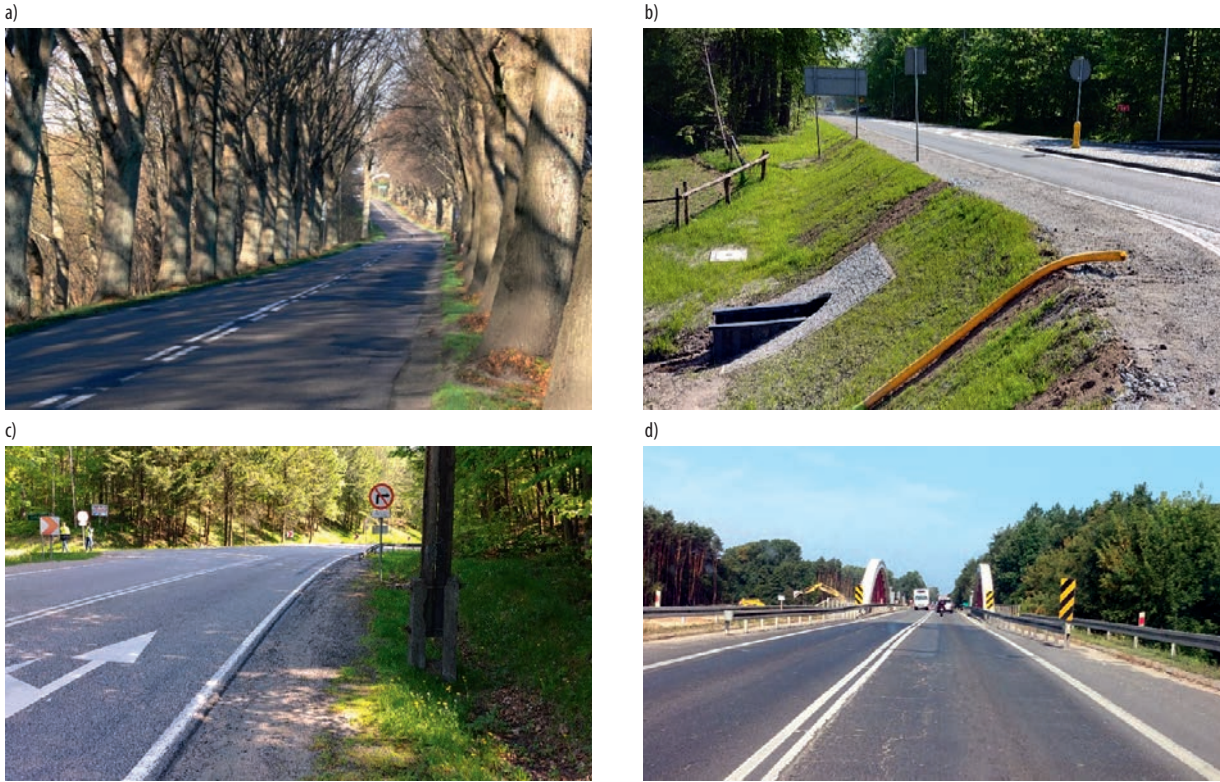
Rys. 3. Przykłady źródeł zagrożeń w otoczeniu drogi

W artykule zaprezentowana została tematyka systemów powstrzymujących pojazd przed wypadnięciem z drogi. Podczas codziennego użytkowania dróg występuje szereg zagrożeń, które wpływają na bezpieczeństwo. Badanie, identyfikacja i klasyfikacja zagrożeń stanowią istotny element utrzymania dróg. Artykuł stanowi drugą część podjętej problematyki. Pierwsza została opublikowana w magazynie Mosty nr 3-4/19 str. 66-68.