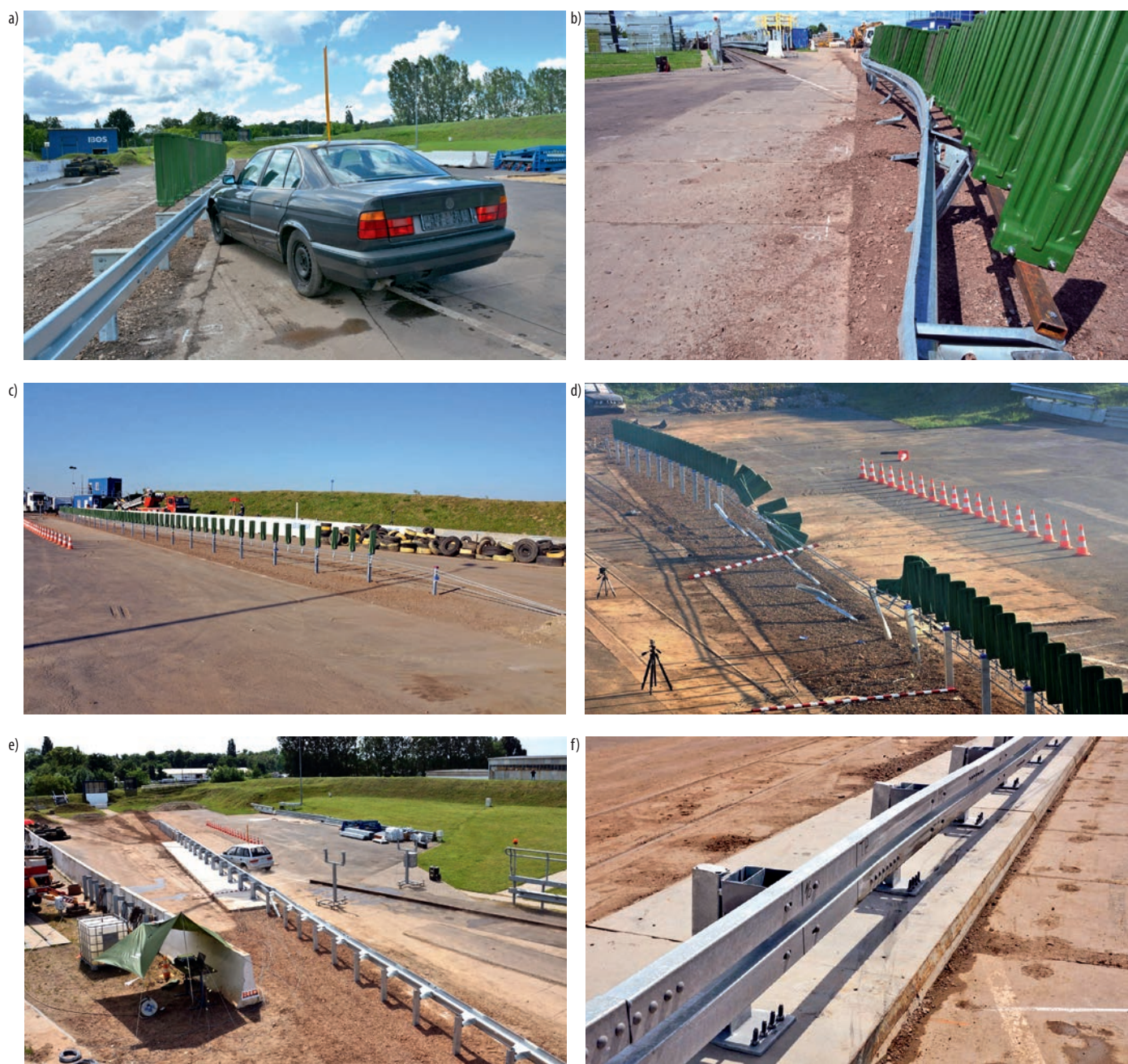
Rys. 5. Testy poligonowe w ramach projektu RID3A

Wszystko to przeprowadzane jest przy relatywnie niskich kosztach w porównaniu do pełnowymiarowych testów zderzeniowych. Przeprowadzając symulacje numeryczne w środowisku MES, należy jednak być świadomym ograniczeń i problemów związanych z tą metodą. Przede wszystkim podczas opracowywania rezultatów należy pamiętać o uproszczeniach, z którymi wiąże się modelowanie numeryczne. Nie można również traktować wyników analizy bezkrytycznie.