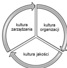
Rys. 1. Triada racjonalnego działania organizacji w kompleksowym zarządzaniu przez jakość [4]

Kultura jakości jest silnie związana z kulturą zarządzania i kulturą danej organizacji, razem tworząc triadę racjonalnego działania organizacji, co obrazuje rysunek 1 [4]. Jest jednym z kluczowych elementów w kompleksowym zarządzaniu przez jakość (ang. Total Quality Management , TQM).