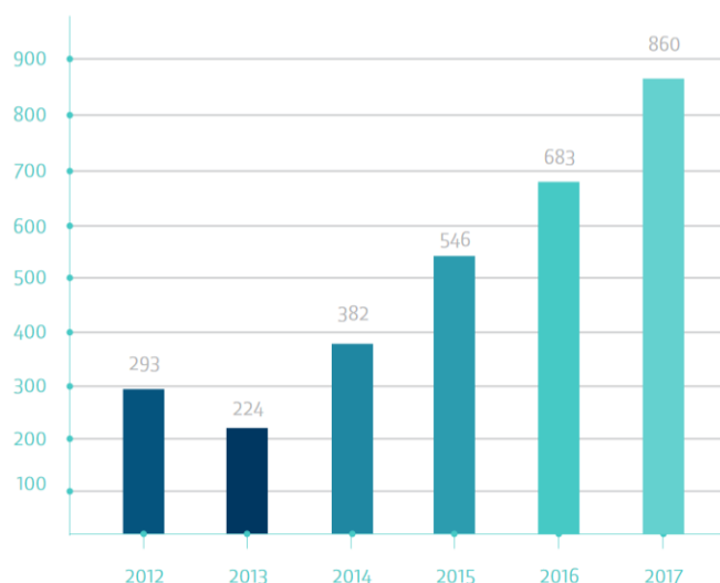
Rys. 2. Liczba studentów zagranicznych Politechniki Gdańskiej w latach 2012–2017 Źródło: Politechnika Gdańska [online]. [Dostęp 14.01.2019]. Dostępny w: https://pg.edu.pl/documents/10784/82904615/folder-PG-1904-2018.pdf .

Największą grupą wśród studentów zagranicznych na Politechnice Gdańskiej są Hiszpanie, którzy stanowią 17% ogółu studiujących osób pochodzących spoza Polski. Miejsce drugie pod względem liczebności zajmują Ukraińcy (14%), a kolejne dwa studenci z Indii (13%) i Białorusi (10%).