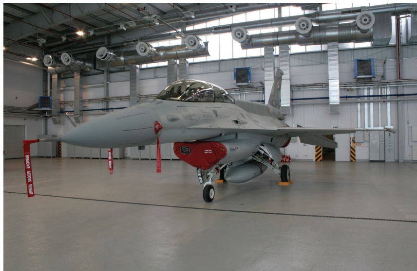
Fot. 1. Posadzka antyelektrostatyczna (na podstawie materiałów firmy Bautech)

Podstawowym kryterium klasyfikacji posadzek antyelektrostatycznych jest przewodność elektryczna. W europejskich i międzynarodowych dokumentach normatywnych przyjęto następującą klasyfikację posadzek (tab. 1): a) przewodzące, b) rozpra-