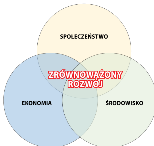
Rys. 2. Schemat idei zrównoważonego rozwoju; opracowanie własne na podstawie [23]

Budownictwo jako jeden z podstawowych działów gospodarki obejmuje wznoszenie, konserwację, remontowanie i rekonstrukcje obiektów budowlanych, zapewniając zaspokojenie potrzeb mieszkaniowych oraz społecznych. Natomiast pojęcie zrównoważonego budownictwa zostało wskazane przez Komisję Europejską w „Inicjatywie rynków pionierskich dla