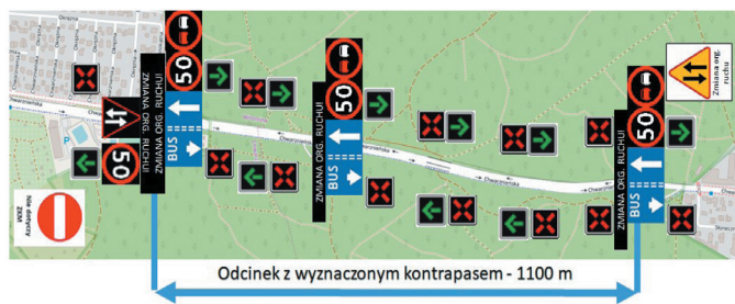
Rys. 4. Schemat scenariusza organizacji ruchu z uruchomionym kontrapasem autobusowym