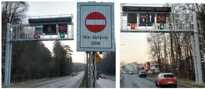
Rys. 5. Oznakowanie kontrapasa: a) przed wjazdem dla autobusów, b) dla ruchu ogólnego

na jego końcu, a trzeci na głównym skrzyżowaniu w centralnej części dzielnicy Witomino) są na bieżąco przesyłane do Centrum Zarządzania i Sterowania Ruchem w Gdyni. Trwają prace nad ustaleniem warunków brzegowych i wdrożeniem rozwiązania, które pozwoli na uruchamianie kontrapasa w sposób półautomatyczny, sugerując operatorowi jego włączenie, a w przypadku pozytywnych testów w sposób automatyczny. Planowane rozwiązanie pozwoli na optymalizację decyzji o włączeniu kontrapasa poprzez redukcję liczby przypadków, w których operator nie ma pewności czy uruchomienie przyczyni się do zmniejszenia strat czasu pojazdów transportu zbiorowego lub w porę nie zauważa konieczności podjęcia działań.