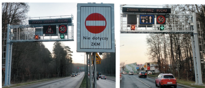
Rys. 5. Oznakowanie kontrapasów: a) przed wjazdem dla autobusów, b) dla ruchu ogólnego

na jego końcu, a trzeci na głównym skrzyżowaniu w centralnej części dzielnicy Witomino) są na bieżąco przesyłane do Centrum Zarządzania i Sterowania Ruchem w Gdyni. Trwają prace nad ustaleniem warunków brzegowych i wdrożeniem rozwiązania, które pozwoli na uruchamianie kontrapasa w sposób półautomatyczny, sugerując operatorowi jego włączenie, a w przypadku pozytywnych testów w sposób automatyczny. Planowane rozwiązanie pozwoli na optymalizację decyzji o włączeniu kontrapasa poprzez redukcję liczby przypadków, w których operator nie ma pewności czy uruchomienie przyczyni się do zmniejszenia strat czasu pojazdów transportu zbiorowego lub w porę nie zauważa konieczności podjęcia działań.