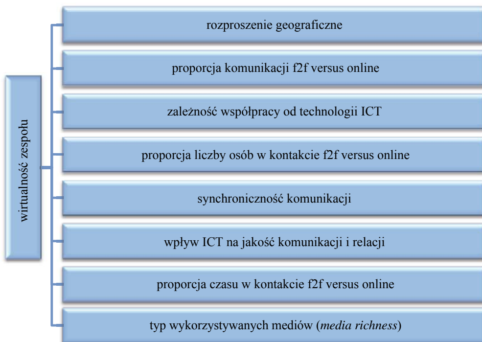
Rysunek 2. Wskaźniki wirtualności zespołu