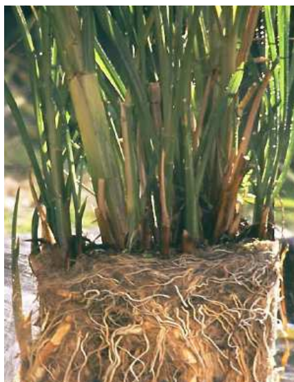
Rys. 3. Części nadziemne i podziemne trzcin popielitej (Blumberg-Engineers, 2018)

Na wymiarowanie obiektów hydrofitowych ma wpływ szereg czynników, m.in. (Nielsen 2017, Kołecka i Obarska-Pempkowiak, 2018): (i) warunki klimatyczne określonego regionu, (ii) ilość i rodzaj dostarczanych osadów, (iii) jakość osadów (określana zwykle na podstawie stężenia suchej masy) i czas ssania kapilarnego oraz zawartość tłuszczów. Ważne jest, aby przed projektowaniem znany był stopień stabilizacji osadów, zapotrzebowanie na tlen, zdolności flokulacyjne oraz charakterystyka odwadniania. Istotne jest, aby w okresie rozruchu (po obsadzeniu systemu trzciną) stosować niższe dawki osadów niż projektowane. Takie podejście umożliwi roślinom lepszy rozwój oraz ukorzenie się w podłożu. Okres rozruchu trwa średnio ok. 2 lata (Nielsen, 2003).