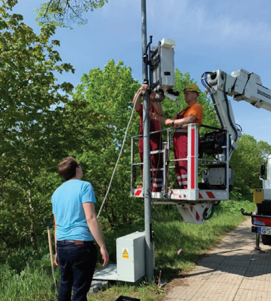
Fot. 2. Instalacja inteligentnego znaku drogowego opracowanego na Politechnice Gdańskiej w ramach projektu INZNAK. Inteligentny znak dokonuje wielosensorowego pomiaru ruchu drogowego i komunikuje się bezprzewodowo z innymi znakami tego typu w celu wyznaczenia zalecanej prędkości jazdy