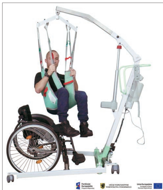
Fig. 2. LeviCare J160 mobile lift Rys. 2. Podnośnik jezdny LeviCare J160

Podnośnik jezdny (rys. 2) powstał dzięki finansowaniu ze środków Unii Europejskiej. Jak sama nazwa wskazuje, jest to podnośnik mobilny, dotychczas naj-