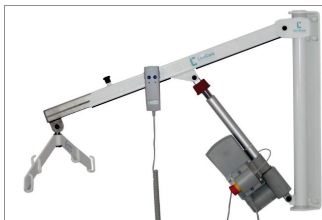
Fig. 4. LeviCare Q140 wall lift for the disabled Rys. 4. Podnośnik ścienny dla osób niepełnosprawnych LeviCare Q140

Choć podnośnik jest nazywany ściennym, nie jest to jedyny sposób jego montażu. W zależności od warunków architektonicznych mieszkania lub placówki dobierane są odpowiednie techniki montażowe, bez przeprowadzania modernizacji budowlanych. Niewątpliwą zaletą konstrukcji jest też wszechstronna możliwość regulacji podnośnika, dzięki czemu dopasowuje się go do potrzeb użytkowników, np. regulacja długości ramienia czy dobór wysokości podstaw mocujących. Podnośnik jest również wyposażony w systemy bezpieczeństwa, które stosuje się w sytuacjach mogących stwarzać zagrożenia dla osoby podnoszonej.