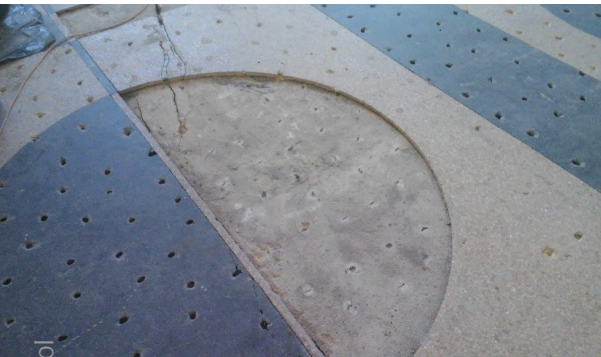
Fot. 3. Różnicowanie kolorystyczne oraz geometryczne naprawianej posadzki lastrico, widoczne fragmenty wymienianej i regenerowanej posadzki [M1]

strukcji. Rysy skurczowe ulegają znacznemu wypłyceciu w procesie szlifowania, a z uwagi na brak przesuwania krawędzi rys do ich wypełnienia stosuje się masy szpachlowe lub wyprawki na bazie kompozytów epoksydowo-kwarcowych z zastosowaniem żywic o zwiększonej lepkości w celu właściwej penetracji podłoża. Naprawa rys i spękań o charakterze konstrukcyjnym jest analogiczna jak przy naprawach zarysowanych płyt betonowych, z uwzględnieniem zasad wykonywania napraw strukturalnych w miejscach zarysowań wynikających z zapisów normy [N1–N4]. Istniejące pęknięcia należy poszerzyć mechanicznie oraz wykonać zgodnie z zasadami sztuki budowlanej nacięcia poprzeczne w celu uciążlenia poprzez kłamrowanie krawędzi rysy. Wszystkie bruzdy należy dokładnie odkurzyć, usuwając powstały pył zbie-