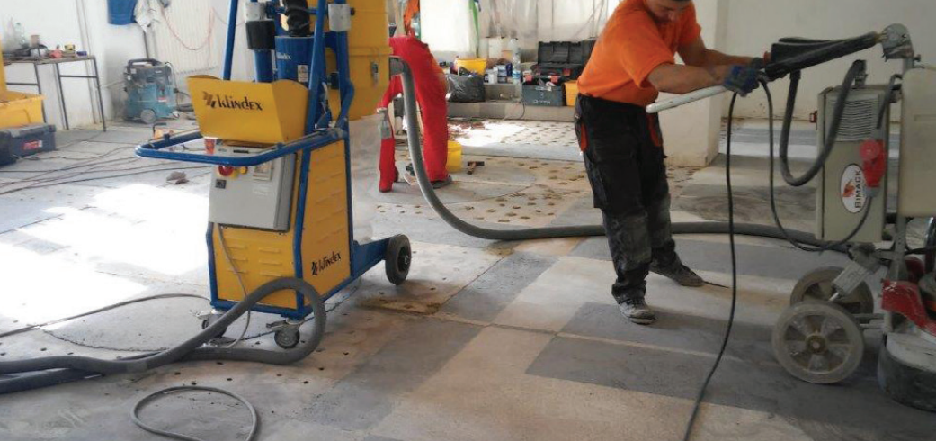
Fot. 3. Wstępne szlifowanie nawierzchni posadzki typu lastrico [M1]