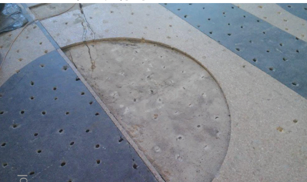
Fot. 3. Różnicowanie kolorystyczne oraz geometryczne naprawianej posadzki lastrico, widoczne fragmenty wymienianej i regenerowanej posadzki [M1]

strukcji. Rysy skurczowe ulegają znacznemu wypłyceciu w procesie szlifowania, a z uwagi na brak przesuwania krawędzi rys do ich wypełnienia stosuje się masy szpachlowe lub wyprawki na bazie kompozytów epoksydowo-kwarcowych z zastosowaniem żywic o zwiększonej lepkości w celu właściwej penetracji podłoża. Naprawa rys i spękań o charakterze konstrukcyjnym jest analogiczna jak przy naprawach zarysowanych płyt betonowych, z uwzględnieniem zasad wykonywania napraw strukturalnych w miejscach zarysowań wynikających z zapisów normy [N1–N4]. Istniejące pęknięcia należy poszerzyć mechanicznie oraz wykonać zgodnie z zasadami sztuki budowlanej nacięcia poprzeczne w celu uciążlenia poprzez kłamrowanie krawędzi rysy. Wszystkie bruzdy należy dokładnie odkurzyć, usuwając powstały pył zbie-