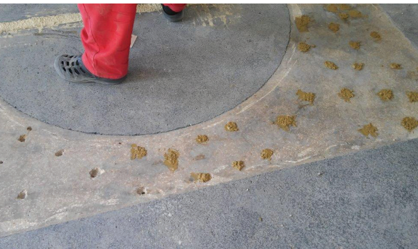
Fot. 4. Naprawa rys konstrukcyjnych i uzupełnienie ubytków po iniekcjach strukturalnych odtwarzających warstwę szczepną [M1]