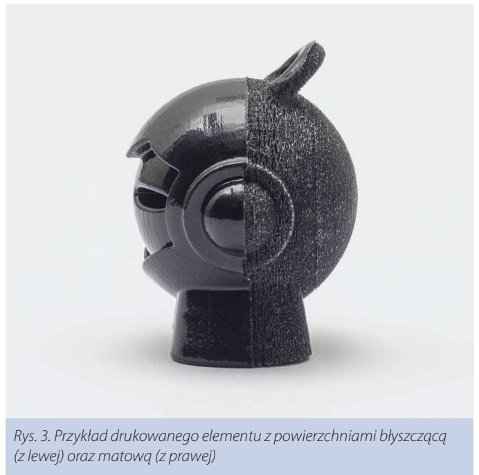
Rys. 3. Przykład drukowanego elementu z powierzchniami błyszczącą (z lewej) oraz matową (z prawej)

prezentowano na rysunku 3. W przypadku drukowania części o błyszczących powierzchniach materiał podporowy stosowany jest tylko wtedy, gdy jest to konieczne ze względów konstrukcyjnych, np. podczas drukowania elementów wystających i niemających bezpośredniego kontaktu z podłożem platformy roboczej. Podczas drukowania elementów o powierzchniach matowych, bez względu na ich orientację oraz wymagania konstrukcyjne, dodawana jest całościowo cienka warstwa materiału podporowego. Drukowanie modeli błyszczących pozwala na uzyskanie bardzo gładkiej powierzchni. Do podstawowych wad tego rozwiązania należą natomiast nierównomierne wykończenie wydrukowanych powierzchni oraz powstające lekkie zaokrąglenia w miejscach występowania ostrych krawędzi oraz narożników. Części o matowych powierzchniach powinny być wykonywane w przypadkach, gdy wymagana jest wysoka dokładność oraz jednolite wykończenie wydrukowanych powierzchni. Wymagany jest również dodatkowy czas przeznaczony na usunięcie materiału podporowego. Ponadto elementy o powierzchniach matowych, w porównaniu do