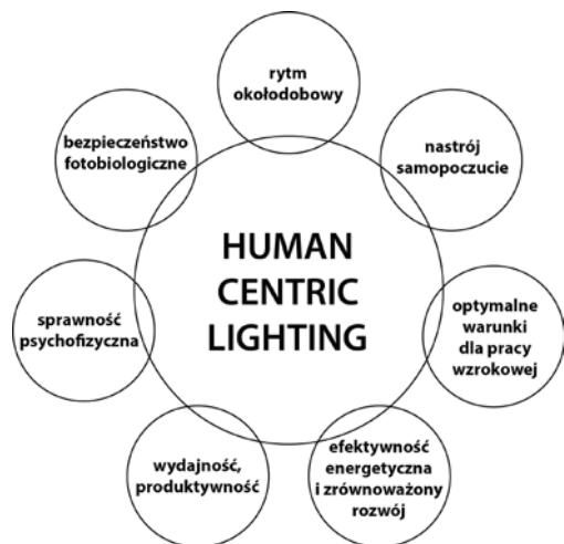
3 Wybrane aspekty koncepcji według Human Centric Lighting Society [14]

Niemniej jednak naukowcy badający procesy wpływu światła na organizm ludzki są ostrożniejsi. Wskazują, że za rozwojem nauk fotometrycznych, a zwłaszcza parametryzacji wpływu oświetlenia na funkcje wizualne człowieka, stały metody zorientowane na jego potrzeby (ang. human-centered ) [1]. Zaś biologiczne efekty ekspozycji na światło o danej charakterystyce zależą od wielu subiektywnych cech organizmu, takich jak historia ekspozycji świetlnej, płeć, wiek, przystosowanie wynikające z zamieszkania w danej strefie szerokości geograficznej, chronotyp, preferencje itp.