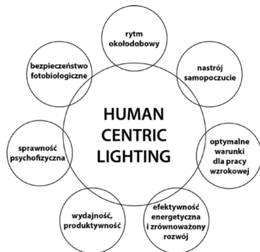
3 Wybrane aspekty koncepcji według Human Centric Lighting Society [14]

Niemniej jednak naukowcy badający procesy wpływu światła na organizm ludzki są ostrożniejsi. Wskazują, że za rozwojem nauk fotometrycznych, a zwłaszcza parametryzacji wpływu oświetlenia na funkcje wizualne człowieka, stały metody zorientowane na jego potrzeby (ang. human-centered ) [1]. Zaś biologiczne efekty ekspozycji na światło o danej charakterystyce zależą od wielu subiektywnych cech organizmu, takich jak historia ekspozycji świetlnej, płeć, wiek, przystosowanie wynikające z zamieszkania w danej strefie szerokości geograficznej, chronotyp, preferencje itp.