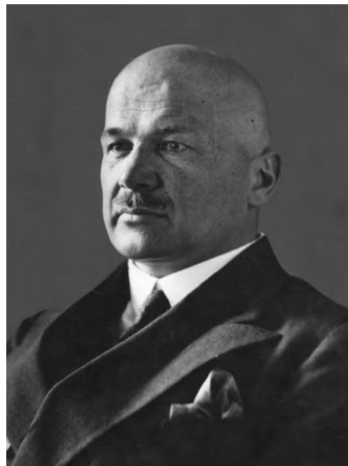
Rys. 1. Kazimierz Drewnowski