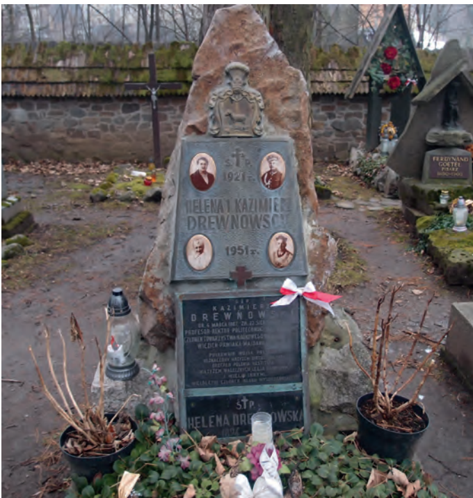
Rys. 5. Grób Kazimierza Drewnowskiego na Pęksowym Brzyzku

Zmarł nagle 22 sierpnia 1952 roku w Zakopanem. Został pochowany na Cmentarzu Zasłużonych na Pęksowym Brzyzku (rys. 5).