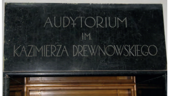
Rys. 6. Tablica przy wejściu do audytorium im. Kazimierza Drewnowskiego na I piętrze Gmachu Elektrotechniki Politechniki Warszawskiej [6]

Pamięć o prof. Kazimierzu Drewnowskim jest ciągle żywa wśród społeczności akademickiej Politechniki Warszawskiej. Jego postać przypomina m.in. tablica przy wejściu do audytorium na I piętrze Gmachu Elektrotechniki (rys. 6).