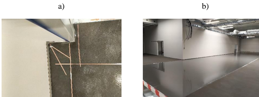
Rys. 2. System antyelektrostatyczny oparty na żywicy epoksydowej: a) instalacja uziemiająca w posadzce żywicznej b) widok wykonanej żywicznej posadzki antyelektrostatycznej

W razie konieczności można je łatwo zdemontować i przenieść w inne miejsce. Puzzle ESD najczęściej wykonywane są w formie zbliżonej do kwadratów wykonane są z dwuwarstwowego materiału przewodzącego objętościowo i posiadają pióra do łączenia z sąsiednimi elementami.