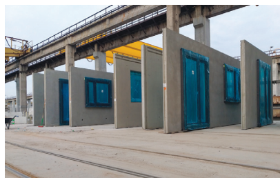
Fot. 2. Proces montażu stolarki okiennej w zakładach prefabrykacji

kaniowego i projektowania przestrzeni biurowej. Ze względu na zbyt wolne metody budowania in situ, firma GOLDBECK Comfort wprowadza coraz nowsze rozwiązania w produkcji prefabrykatów. Przykładem może być montaż stolarki okiennej (fotografia 2) oraz wbudowanie infrastruktury pod instalację elektryczną już na etapie produkcji elementów w zakładzie prefabrykacji, co znacznie skraca prace na budowie.