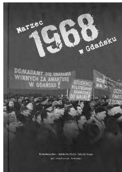
Rys. 3. Marzec 1968 w Gdańsku

Andrzejewskiego. Udziałowi studentów Politechniki Gdańskiej w strajkach poświęcone są dwie publikacje naukowe Instytutu Pamięci Narodowej pt. Marzec 1968 na Politechnice Gdańskiej oczami uczestników [11] i Marzec 1968 na Politechnice Gdańskiej w dokumentach [12]. Przedstawiono w nich przebieg protestów, sytuację na uczelni, zachowania i postawy kadry, a także represje studentów ze strony władz Politechniki Gdańskiej, wymiar sprawiedliwości i służby bezpieczeństwa. W książce Czas przelomu Solidarność 1980-1981 [13] w rozdziale Radiowe agencje Solidarności w Gdańsku Elżbieta Pietkiewicz przybliży rolę Studenckiej Agencji Radiowej (która jako pierwsza radiostacja już 15 sierpnia nadała informacje o strajku) w wspieraniu protestów. O strajkach w 1988 i zaangażowaniu studentów i pracowników Politechniki Gdańskiej można przeczytać we wspomnieniach uczestników tych wydarzeń pt. W przededniu wolnej Polski. Młodość pyta... o strajki 1988 roku [14].