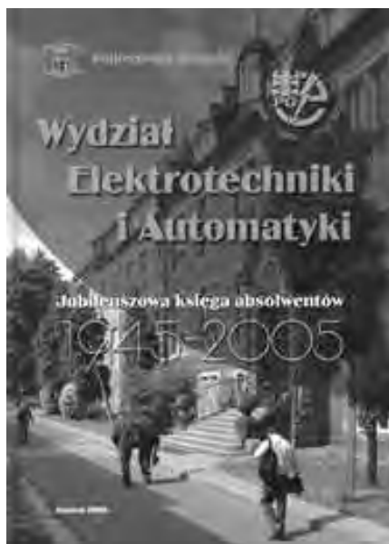
Rys. 4. Wydział Elektrotechniki i Automatyki. Jubileuszowa księga absolwentów 1945-2005

Wydział Elektryczny wydał trzy księgi jubileuszowe. Pierwsza, poświęcona jubileuszowi stulecia istnienia Wydział Elektrotechniki i Automatyki wczoraj i dziś. Księga jubileuszowa 1904-2004 [24] szczegółowo omawia historię Politechniki, a także Wydziału: od początków Instytutu Elektrotechnicznego, przez Konigliche Technische Hochschule Danzig, aż do początków polskiej Politechniki Gdańskiej. W kolejnych rozdziałach omówiono zabytkowy budynek Wydziału wraz z symboliką zdobień elewacji. Przedstawiono również obecną sytuację Wydziału – schemat organizacyjny, działalność naukowo-badawczą i dydaktyczną, kadre oraz sylwetki samodzielnych pracowników wydziału. Druga, Wydział Elektrotechniki i Automatyki. Jubileuszowa księga absolwentów 1945-2005 [25] (rys. 4) dotyczy jubileuszu 60-lecia Wydziału powojennej Politechniki Gdańskiej. Rys historyczny dotyczy przede wszystkim powojennej historii Wydziału. Przypomniani są wszyscy dziekani i prodziekani, a także obecne władze Wydziału. Przedstawiono wszystkie Katedry i inne jednostki. Dalsze rozdziały poświęcone są absolwentom oraz wspomnieniom pracowników i studentów. Trzecia, wydana z okazji jubileuszu 110 lat Politechniki Gdańskiej pt.: Wydział Elektrotechniki i Automatyki 2004-2013 [26], jest jednak książką o Wydziale, jego stanie obecnym. Przedstawione są katedry, osiągnięcia naukowe kadry i kronika zderzeń w latach 2004-2013, spis absolwentów z tego okresu.