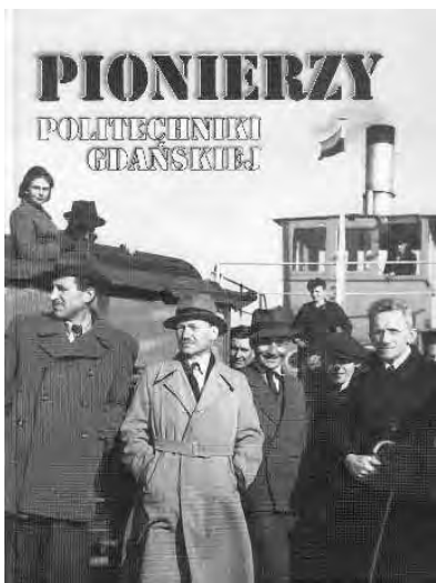
Rys. 2. Pionierzy Politechniki Gdańskiej