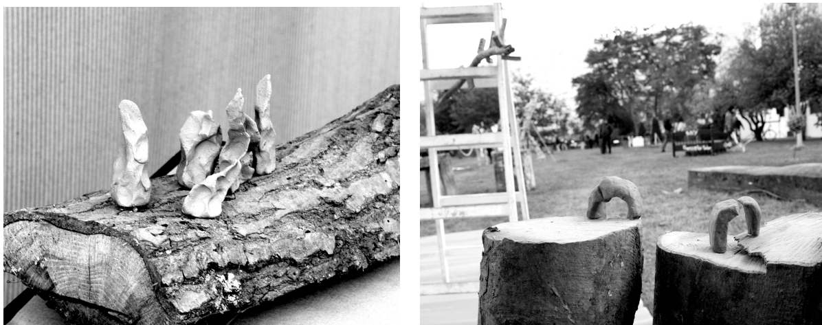
Ilustracja 5. Obiekty z cyklu pt. „Schronienie”

Pozostałe obiekty z cyklu „Schronienie” wskazują na piękno i harmonię środowiska naturalnego poprzez podjętą próbę wpisania elementów kulturowych w kontekst przyrodniczy, z myślą o którym zostały stworzone.