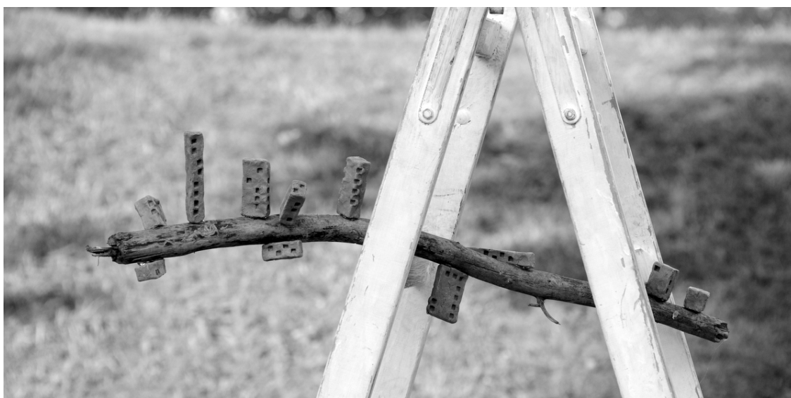
Ilustracja 4. Obiekt pt. „Wmieszkiwanie blokowiska”

efekt poszukiwania trasy i formy przebiegu poszukiwanego porozumienia) zarazem wpisuje się i wspiera na towarzyszących naturalnych elementach przyrodniczych, zaznaczając jednak formalnie swoją autonomiczną tożsamość. Wplata się i wpasowuje jednocześnie unikając scalenia. Jednak formy tych pojedynczych elementów są w większości przypadków równocześnie wzorowane na elementach przyrodniczych, wobec których zostały następnie usytuowane jako prowokacyjna konfrontacja, sprawdzająca możliwość pojęcia dialogu w zarysowujących się relacjach. Zaczerpnięcie wzoru i siły, ukazuje gradację wartości, potrzebę doświadczenia zależności, bliskości ze środowiskiem naturalnym, bycie częścią naturalnie ukształtowanej przestrzeni, której doświadczenia potrzebujemy dla utrwalenia poczucia współistnienia.