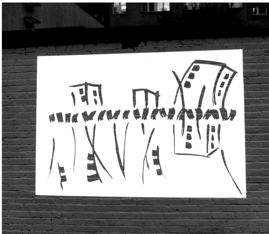
Ilustracja 3. Szkice ukazujące ideę działania pokazane w prezentacji multimedialnej

obszary porozumienia. Sugerują nieoczywiste a jednak zachodzące, uwidocznione i doświadczane relacje.