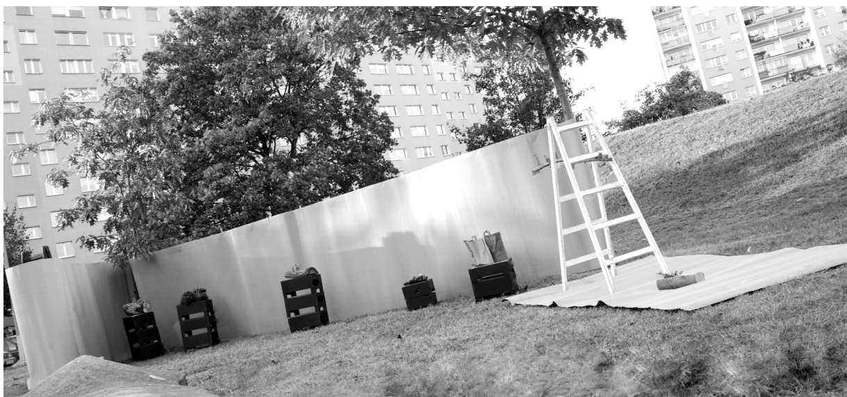
Ilustracja 2. Intencjonalny projekt pt. „Schronienie”, Gdańsk-Zaspa 2016

Założeniem wyjściowym tego działania jest osobista wypowiedź twórcza stanowiąca autorską interwencję w zastaną sytuację. Jej celem było poszerzenia przestrzeni w warstwie rozumienia procesu zamieszkiwania o osobistą wypowiedź, która ma w zamyśle zarysować możliwy kierunek myślenia o sensie i istocie schronienia w jego aspekcie psychologicznym i kulturowym. Potencjalnym efektem miało być dowartościowanie przestrzeni, wzmocnienie, dosycenie, rozwarstwienie i w nim uzupełnienie. W efekcie docelowym możliwe i pożądane (choć będące karkołomnym wyzwaniem) byłoby przełożenie ideowych działań na rzeczywiste formy architektoniczne.