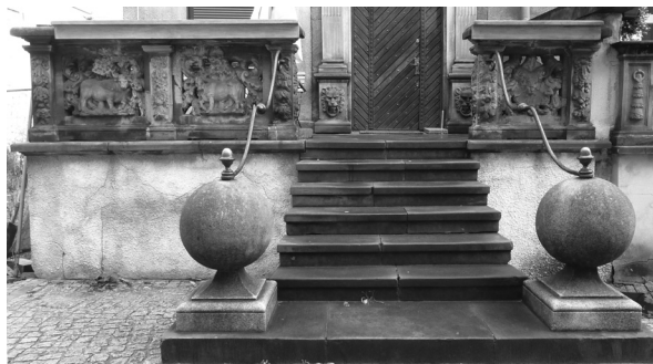
Ryc. 1. Przedproże kamienicy przy ul. Mariackiej 52, stan obecny.

Z Akt Policji Budowlanej wynika, że 23 lutego 1870 roku właściciel kamienicy G.A. Schramm wystąpił o wydanie pozwolenia na rozbiórkę frontowej przybudówki i przedproża [APG, 15/3171, w: Maciakowska 2004: 20]. Późniejszy brak przedproża po-