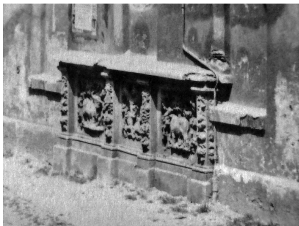
Ryc. 7. Detal dekoracji rzeźbiarskiej fasady budynku jatek mięsnych na podstawie zdjęcia ze zbiorów P. Popińskiego (ryc. 6)

Fasada budynku ław mięsnych widoczna jest także na fotografii z widokiem en face , opublikowa-