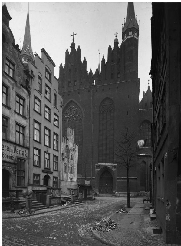
Ryc. 5. Widok ul. Mariackiej w kierunku kościoła Mariackiego przed 1945 r. Ze zb. Instytutu Herdera w Marburgu, Bildarchiv, nr inw. 204260