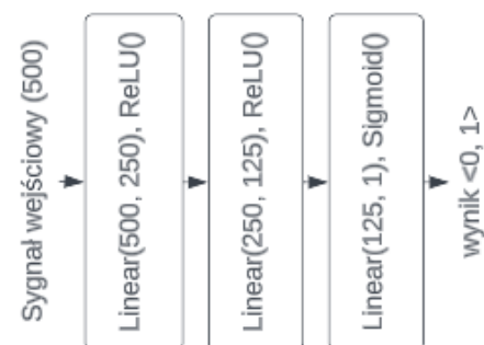
Rys. 1. Architektura sieci klasyfikującej sygnały

Do detekcji impulsów w obecności szumu i trendu opracowano sieć, której strukturę przedstawia rys. 1. Złożona jest ona z 3 warstw typu Linear. Dla pierwszych z nich zastosowano funkcje aktywacji ReLU, a dla ostatniej Sigmoid.