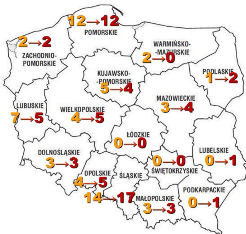
Ryc. 1 Porównanie liczby porozumień w Polsce w 2011 i 2021 r., oprac. autor

i 2021 roku, autorzy przedstawili informacje o liczbie zawartych porozumień w całej Polsce 4 . Na podstawie obu artykułów opracowana została schematyczna mapa Polski, ukazująca liczbę porozumień w poszczególnych województwach w 2011 oraz 2021 r. (Ryc. 1). Z porównania tych liczb wynika, że zmiany liczbowe w tym okresie są niewielkie. W sześciu województwach liczba zawartych porozumień nie zmieniła się, a w pozostałych zmiany nie były większe niż 3. Łączna liczba porozumień wzrosła z 60 do 64. Oznacza to, że na przestrzeni 10 lat utrzymywała się pewna stabilność liczbowa, ale liczba ta jest niestety niewielka i nie widać wyraźnej tendencji rosnącej. Przyczyny tego, że gminy i powiaty nie zawierają porozumień są natury finansowej, organizacyjnej i merytorycznej. Więcej informacji o tym podano w Raporcie GUS z 2015 r 5 .