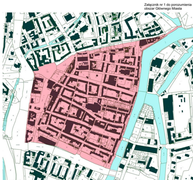
Ryc. 2 Mapa przedstawiająca Główne Miasto z Porozumienia o przekazaniu kompetencji w Gdańsku

Drugim przykładem, przy którym warto posłużyć się ilustracją z porozumienia, jest Gdańsk. Porozumienie to wprawdzie obecnie już nie obowiązuje, ale przez wiele lat było podstawą do wydawania decyzji przez MKZ w Gdańsku. Granica podziału kompetencji pomiędzy WKZ i MKZ wg porozumienia i załącznika graficznego przebiegała m.in. ulicą Podwale Staromiejskie (Ryc. 2), co w praktyce oznacza, że uzgodnienia dotyczące terenu po jednej stronie ulicy, w tym pierzei dokonuje WKZ, a MKZ terenu po drugiej stronie ulicy w tym przeciwległej pierzei. W przypadku dość powszechnego braku współpracy i nieco odmiennych kryteriów oceny, efektem może być brak spójności uzgodnień konserwatorskich po obu stronach ulicy.