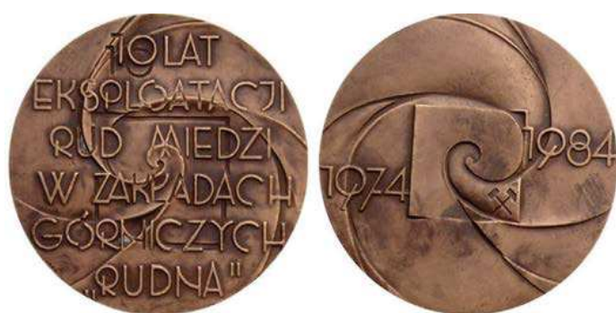
Rys. 33. Medal 10-lecia eksploatacji rud miedzi w Zakładach Górniczych Rudna

W 1984 r. w Mennicy Państwowej wybito medal, który upamiętnia 10 lat eksploatacji rud miedzi w zakładach Górniczych Rudna (rys. 33). Na awersie na tle znaku firmowego umieszczono napis: 10 LAT / EKSPLOATACJI / RUD MIEDZI / W ZAKŁADACH / GÓRNICZYCH / "RUDNA", na rewersie na tle znaku ZG Rudna widnieją daty: 1974 / 1984. Medal zaprojektowała i wykonała Hanna Jelonek. Średnica wynosi 70 mm. Medal wykonany jest z tombaku patynowanego (2100 sztuk) i miedzi (20 sztuk).