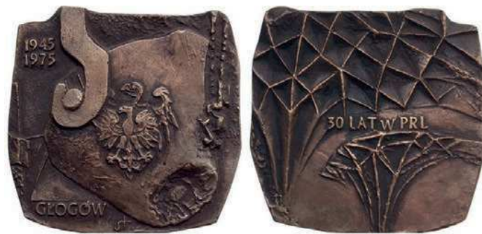
Rys. 45. Medal 30-lecia Głogowa

W 1975 r. został wykonany medal Głogowa (rys. 45). Na awersie występuje fragment kadzi hutniczej, na niej orzeł ze współczesnego godła Polski na tle orła z godła historycznego. Z lewej strony widać u dołu napis: GŁOGÓW, u góry daty: 1945 / 1975, na rewersie na tle sklepienia sieciowego napis: 30 LAT W PRL. Autorem medalu jest Józef Stasiński. Medal ma kształt nieregularny o wymiarach zewnętrznych 105×105 mm.