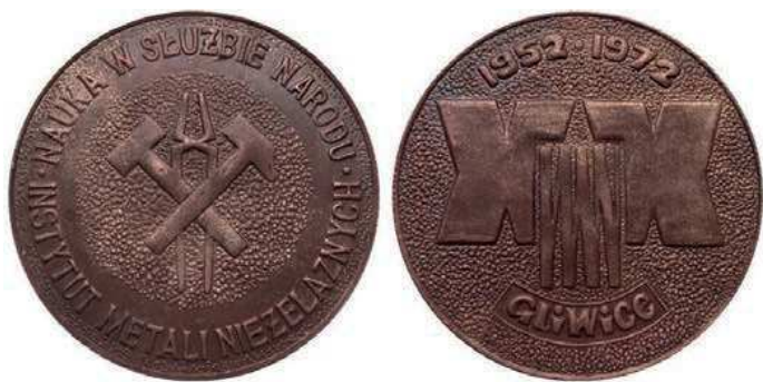
Rys. 64. Medal 20-lecia Instytutu Metali Nieżelaznych