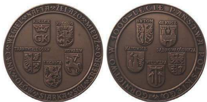
Rys. 4. Medal Górnictwo w 1000-lecie państwa polskiego

W 1000-LECIE PAŃSTWA POLSKIEGO. Medal zaprojektował i wykonał Wojciech Kubiczek. W tombaku w nakładzie 600 sztuk wybiła go Mennica Państwowa (średnica 70 mm).