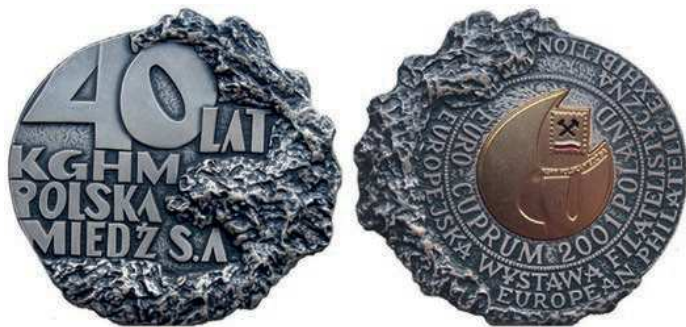
Rys. 16. Medal 40-lecia KGHM Polska Miedź S.A.

POLAND / EUROPEJSKA WYSTAWA FILATELISTYCZNA / EUROPEAN PHILATELIC EXHIBITION. Medal zaprojektowała i wykonała Bożenna El-Sayed, a wybiła Mennica Państwowa. Medal wybity w tombaku srebrzonym i oksydowanym z wkładką na rewersie w trzech wersjach: złocona (nakład 100 sztuk), srebrzona (200 sztuk) i patynowana (700 sztuk). Kształt medalu zaprojektowano jako nieregularny, wymiary zewnętrzne to 70×67 mm.