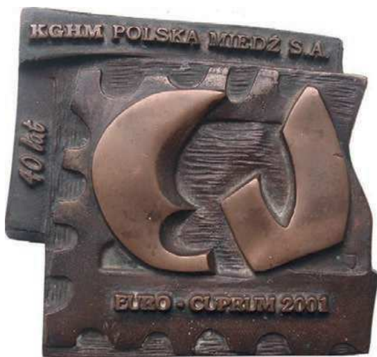
Rys. 17. Plakietka 40-lecia KGHM Polska Miedź S.A.

Z okazji tego samego wydarzenia pochodzi pamiątkowa plakietka (rys. 17). Na ząbkowanym polu symbolizującym znaczek pocztowy umieszczono stylizowane litery Cu. Poniżej jest napis: EURO – CUPRUM 2001. Przy górnej krawędzi KGHM POLSKA MIEDŹ S.A. Z lewej strony: 40 lat. Wymiary plakietki to 115×108 mm.