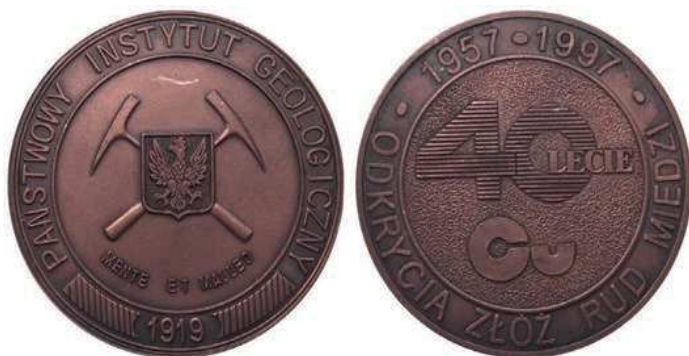
Rys. 63. Medal Państwowego Instytutu Geologicznego z okazji 40-lecia odkrycia złóż rud miedzi z 1997 r.

Z 1977 r. pochodzi medal 25-lecia Instytutu Metali Nieżelaznych (rys. 65). Na awersie na fakturowanej powierzchni umieszczono ówczesne logo Instytutu, w otoku napis: INSTYTUT METALI NIEŻELAZNYCH. Na rewersie znajduje się godło hutnicze w postaci skrzyżowanych narzędzi w kole zębatym. Przy krawędzi w górnej części: XXV – LAT, w dolnej: 1952–1977 (średnica to 74 mm).