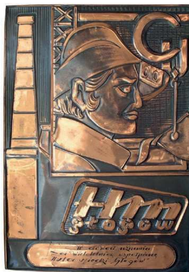
Rys. 52. Plaketka z podziękowaniem za pracę w Hucie Miedzi Głogów

Z podziękowaniem za pracę w Hucie Miedzi Głogów została wykonana plakieta z blachy miedzianej (rys. 52). Na plakiecie przedstawiono hutnika z profilem, u góry litery Cu, poniżej: HM Głogów. U dołu napis: W dowód uznania za wieloletnią współpracę Huta Miedzi „Głogów”. Wymiary plakiety to: 40x28,5 cm.