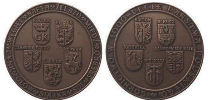
Rys. 4. Medal Górnictwo w 1000-lecie państwa polskiego

W 1000-LECIE PAŃSTWA POLSKIEGO. Medal zaprojektował i wykonał Wojciech Kubiczek. W tombaku w nakładzie 600 sztuk wybiła go Mennica Państwowa (średnica 70 mm).