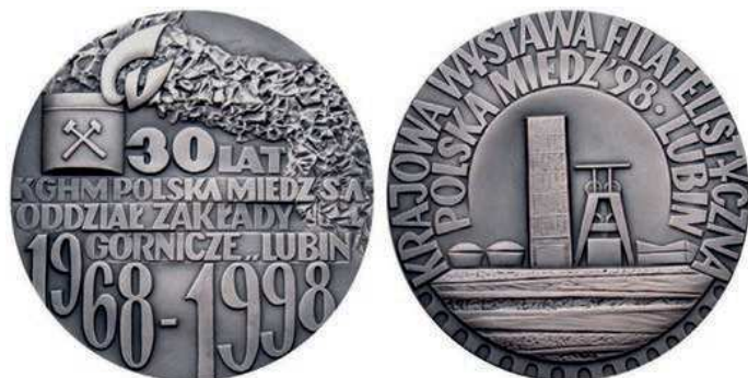
Rys. 29. Medal 30-lecia Oddziału Zakładów Górniczych Lubin

W 1998 r. Mennica Państwowa wybiła medal z okazji 30-lecia Oddziału Zakładów Górniczych Lubin (rys. 29). Na awersie napis: 30 LAT / KGHM POLSKA MIEDŹ S.A. / ODDZIAŁ ZAKŁADY / GÓRNICZE "LUBIN" / 1968–1998. U góry czapka górnicza z pióropuszem w kształcie liter Cu, obok nieregularny kształt jak ruda miedzi, na rewersie rysunek biurowca i wieży szybu kopalni, w górnej części dookoła w dwóch wierszach napis: KRAJOWA WYSTAWA FILATELISTYCZNA / POLSKA MIEDŹ'98. LUBIN (Wystawa Filatelistyczna towarzyszyła obchodom jubileuszu Zakładów Górniczych Lubin). W dolnej części przy krawędzi występuje ząbkowanie jak na znaczku pocztowym. Medal zaprojektowała Bożenna El-Sayed, wykonał Robert Kotowicz. Średnica 70 mm, wybit w tombaku srebrzonym i oksydowanym w nakładzie 755 sztuk.