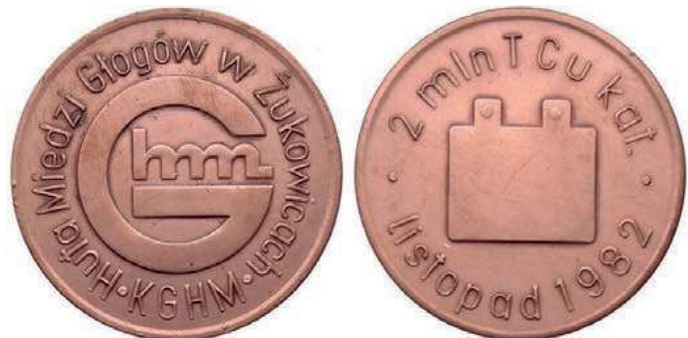
Rys. 46. Medal upamiętniający dwumilionową tonę miedzi z Huty Miedzi Głogów

Kolejny medal upamiętnia wyprodukowanie 16 listopada 1982 r. w Hucie Miedzi Głogów dwumilionowej tony miedzi (rys. 46). Na awersie znajduje się litera G, w niej wpisane litery hm. W otoku jest napis: Huta Miedzi Głogów w Żukowicach / KGHM. Na rewersie przedstawiono katodę miedzianą, w otoku znajdują się napisy: 2 mln T Cu kat. / listopad 1982. Średnica medalu wynosi 48 mm.