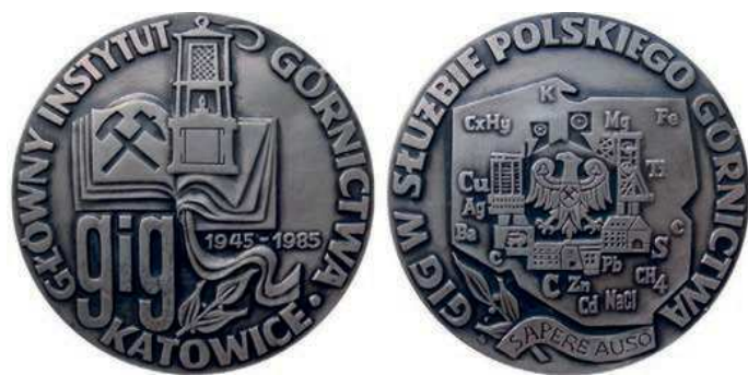
Rys. 60. Medal 40-lecia Głównego Instytutu Górnictwa

Z 1977 r. pochodzi medal 15-lecia Zakładów Badawczych i Projektowych Miedzi Cuprum (rys. 57). Na awersie znajduje się logo zakładów z wrocławską Iglicą w Parku Szczytnickim i napisem CUPRUM / WROCLAW, na rewersie herb Wrocławia z lat 1948–1990. Po bokach daty 1962 1977, przy krawędzi u góry: XV LAT, u dołu natomiast: NOWEJ MIEDZI. Autorem projektu jest Eugeniusz Zygałto, średnica 62 mm.