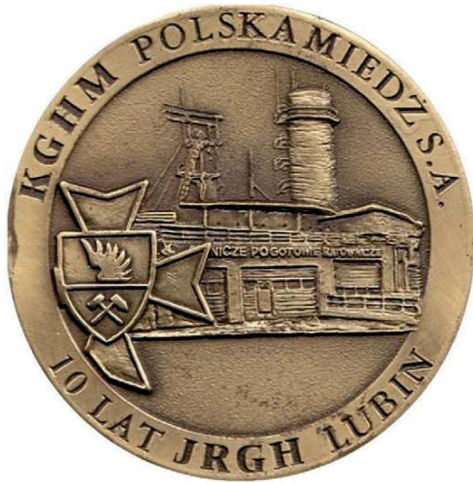
Rys. 32. Medal 10-lecia Jednostki Ratownictwa Górniczo-Hutniczego

W nakładzie 100 sztuk w tombaku srebrzonym i oksydowanym oraz 200 sztuk tombaku oksydowanym wybiła Mennica Państwowa (średnica 70 mm).