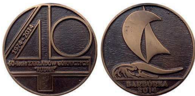
Rys. 38. Medal 40-lecia Zakładów Górniczych Rudna

Czterdziestolecie Zakładów Górniczych Rudna zostało upamiętnione medalem w 2014 r. (rys. 38). Na awersie znajduje się liczba 40 z umieszczonymi na cyfrze 4 napisami: 1974–2014 / 40-lecie ZAKŁADÓW GÓRNICZYCH / „RUDNA”. Na rewersie pokazano stylizowaną zagłówkę na fali, u dołu napis: BARBÓRKA / 2014 (średnica 70 mm).