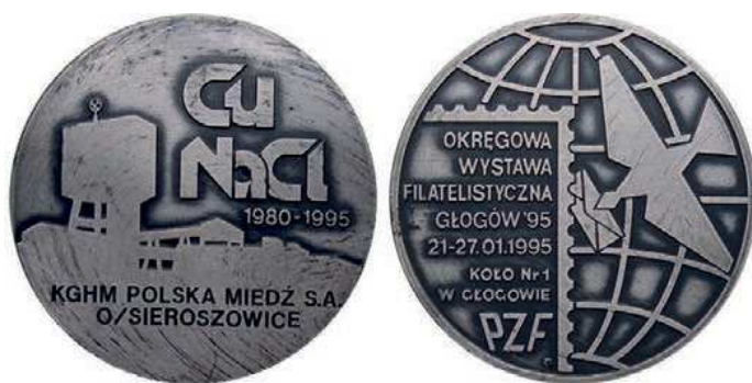
Rys. 43. Medal 15-lecia KGHM Polska Miedź Oddział Sieroszowice

1 stycznia 1996 r. w wyniku połączenia działających wcześniej kopalni Polkowice oraz Sieroszowice [2]. W 1995 r. został wydany medal z okazji 15-lecia KGHM Polska Miedź Oddział Sieroszowice i Wystawy Filatelistycznej Głogów'95 (rys. 43). Na awersie przedstawiono kontur zabudowy kopalni, z prawej strony stylizowane napisy: Cu / NaCl, pod nimi daty: 1980–1995, w dolnej części widnieje napis: KGHM POLSKA MIEDŹ S.A. / O/ SIEROSZOWICE. Z prawej strony rewersu na tle siatki geograficznej gołąb z dziobem. W lewej dolnej części w fragmencie znaczka pocztowego napis: OKRĘGOWA / WYSTAWA / FILATELISTYCZNA / GŁOGÓW '95 / 21.27.01.1995 / KOŁO Nr 1 / W GŁOGOWIE / PZF. Medal wykonał Robert Kotowicz. Średnica wynosi 55 mm. W nakładzie 200 sztuk w tombaku srebrzonym i oksydowanym wybiła go Mennica Państwowa.