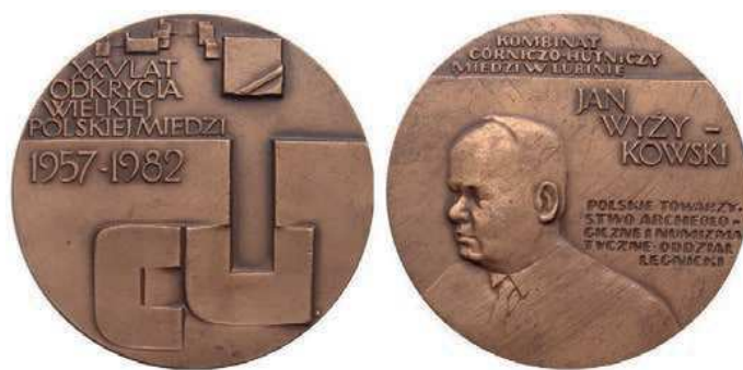
Rys. 7. Medal 25-lecia odkrycia złóż polskiej miedzi

Odkrycie przez Jana Wyżykowskiego i jego zespół pokładów miedzi zostało upamiętnione medalem w 1982 r. (rys. 7). Na awersie przedstawiono duże litery Cu, powyżej napis: XXV LAT / ODKRYCIA / WIELKIEJ / POLSKIEJ MIEDZI / 1957–1982. Na rewersie popiersie Jana Wyżykowskiego trzy czwarte w lewo. Powyżej napis: KOMBINAT / GÓRNICZO-HUTNICZY / MIEDZI W LUBINIE.