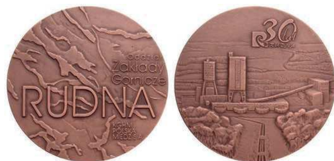
Rys. 37. Medal 30-lecia Zakładów Górniczych Rudna

W 2004 r. został wyemitowany medal z okazji 30-lecia Zakładów Górniczych Rudna (rys. 37). Na awersie na fakturowanej powierzchni znajdują się napisy: Oddział / Zakłady Górnicze / RUDNA / KGHM / POLSKA / MIEDŹ S.A. Na rewersie pokazano widok na kopalnię, powyżej logo kopalni i napis: 30 lat / RUDNA. Medal zaprojektował i wykonał Artur Bochniak, średnica to 70 mm. Został wybity w Mennicy Polskiej w nakładzie 1000 sztuk w miedzi patynowanej.