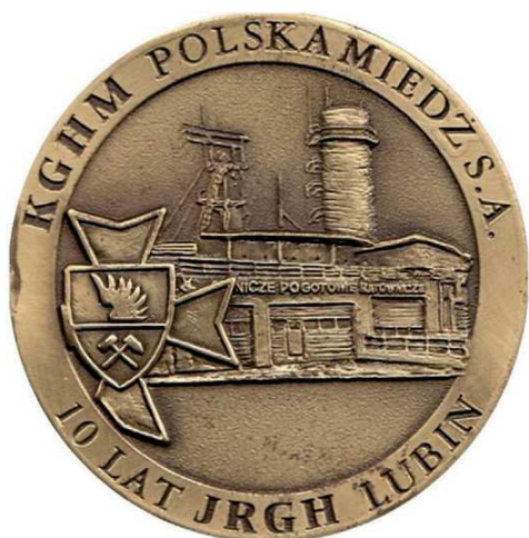
Rys. 32. Medal 10-lecia Jednostki Ratownictwa Górniczo-Hutniczego

Zakłady Górnicze Rudna. Budowę kopalni Rudna, największej w KGHM, rozpoczęto w 1969 r. Początkowo zakładano wydajność 7,5 mln Mg rudy rocznie. W lipcu 1974 r. Zakłady Górnicze Rudna osiągnęły 25% planowanych zdolności i zostały przekształcone w jednostkę wydobywczą. W tym samym roku opracowano założenia rozbudowy do wydobycia 12 mln Mg rudy rocznie [2].