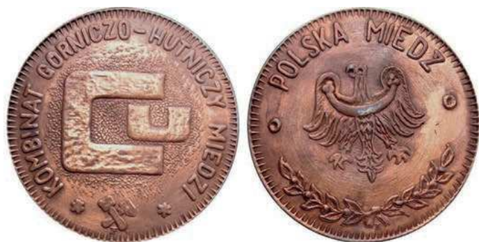
Rys. 12. Medal Polska Miedź z 1977 r.

Z 1977 r. pochodzi medal KGHM w Lubinie (rys. 12). Na awersie znajdują się stylizowane litery Cu, w otoku napis: KOMBINAT GÓRNICZO-HUTNICZY MIEDZI, u dołu są skrzyżowane młotki górnicze, tzw. kupła: pyrlik i żelazko, stanowiące symbol górnictwa. Na rewersie widnieje orzeł śląski, u góry przy krawędzi napis: POLSKA MIEDŹ. U dołu dwie splecione gałązki. Medal zaprojektował Eugeniusz Zygadło, wykonał Kazimierz Choroszy. Medal wykonano w miedzi (80 sztuk) i w srebrze (średnica 70 mm).