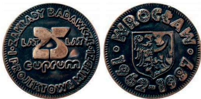
Rys. 58. Medal 25-lecia Zakładów Badawczych i Projektowych Miedzi Cuprum

Z 1977 r. pochodzi medal 15-lecia Zakładów Badawczych i Projektowych Miedzi Cuprum (rys. 57). Na awersie znajduje się logo zakładów z wrocławską Iglicą w Parku Szczytnickim i napisem CUPRUM / WROCŁAW, na rewersie herb Wrocławia z lat 1948–1990. Po bokach daty 1962 1977, przy krawędzi u góry: XV LAT, u dołu natomiast: NOWEJ MIEDZI. Autorem projektu jest Eugeniusz Zygadło, średnica 62 mm.