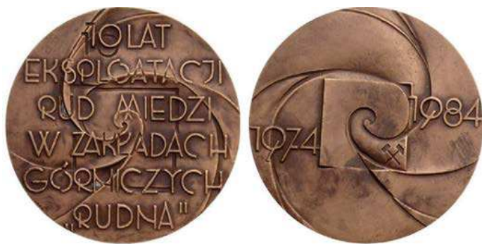
Rys. 33. Medal 10-lecia eksploatacji rud miedzi w Zakładach Górniczych Rudna

Ciekawy medal z przywieszką wyemitował KGHM Polska Miedź. Zakład Górniczy Rudna w 1997 r. (rys. 35). W górnej i dolnej części awersu znajduje się fakturowana powierzchnia jak ruda miedzi, ozdobiona fantazyjnym ornamentem. W środkowej części na gładkiej powierzchni zamieszczono napis: KGHM POLSKA MIEDŹ S.A. / Oddział Zakłady Górnicze RUDNA. Na rewersie w środku jest poziomy pas fakturowany jak ruda miedzi, powyżej i poniżej na gładkiej powierzchni napisy: MIEDŹ / copper / Kupfer / Cu / RAME / CUIVRE / Cuprum / miedź / cobre. Na awersie przywieszki znalazł się kwadrat ze stylizowanym logo ZG Rudna. Na rewersie na tle pasa fakturowanego jak ruda miedzi alchemiczny znak miedzi. Medal zaprojektowała i wykonała Hanna Jelonek. Medal wybito z tombaku srebrzonego i oksydowanego w kształcie kwadratu o boku 65 mm, okrągłą przywieszkę o średnicy 30 mm wykonano z miedzi. W nakładzie 200 sztuk wybiła go Mennica Państwowa (tombak patynowany).