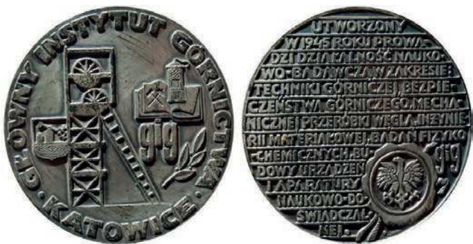
Rys. 59. Medal Głównego Instytutu Górnictwa z 1978 r.

Jeszcze dłuższą historię ma Państwowy Instytut Geologiczny. Został uroczystie otwarty 9 maja 1919 r., będąc jednym z najstarszych polskich instytutów naukowych o zasięgu