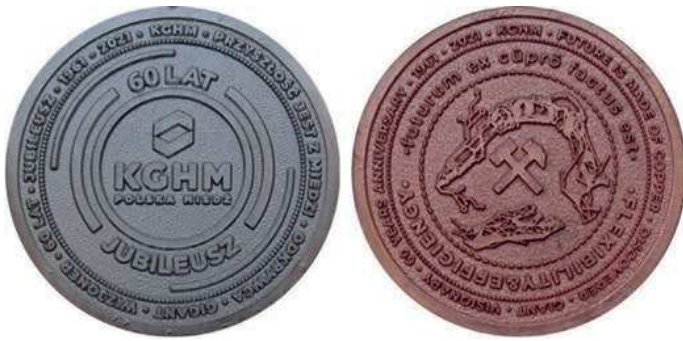
Rys. 20. Medal 60-lecia KGHM Polska Miedź S.A. (awers i rewers medali z różnych wersji kolorystycznych)

* DISCOVERER * GIANT * VISIONARY * 60 YEARS ANNIVERSARY * 1961–2001. Średnica medalu to 40 mm. Medale zostały wykonane w zakładzie Odlewnictwo Eksport-Import w Kłobucku. łączny nakład to 1170 sztuk.