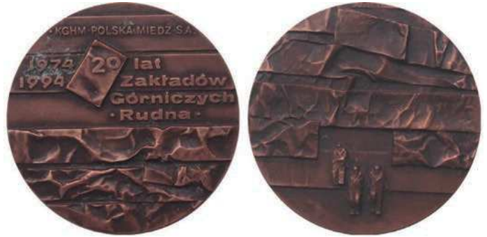
Rys. 34. Medal 20-lecia Zakładów Górniczych Rudna

W nakładzie 100 sztuk w tombaku srebrzonym i oksydowanym oraz 200 sztuk tombaku oksydowanym wybiła Mennica Państwowa (średnica 70 mm).