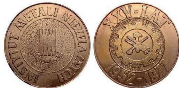
Rys. 65. Medal 25-lecia Instytutu Metali Nieżelaznych