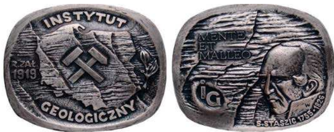
Rys. 62. Medal Instytutu Geologicznego z 1987 r.

ogólnokrajowym. Medal z okazji jubileuszu 50-lecia Instytutu Geologicznego został wydany w 1970 r. (rys. 61). Na awersie przedstawiono gmach Instytutu w Warszawie, poniżej napis: INSTYTUT GEOLOGICZNY / 1919–1969, w górnej części tarcza z godłem Polski, w dolnej skrzyżowane młotki otoczone wieńcem laurowym, w kwadracie otoku napis: 50 LAT W SŁUŻBIE NAUKI I GOSPODARKI NARODOWEJ, przy krawędzi nazwiska czterech polskich zasłużonych geologów: K. BOHDANOWICZ, J. CZARNOCKI, J. SAMSONOWICZ, J. MOROZEWICZ, na rewersie został wgłębiony zarys granic Polski, na nim rysunki wież wiertniczych i maszyn górniczych oraz symbole pierwiastków (w tym Cu). U dołu napis: MENTE / ET MALLES (motto geologów, z łaciny: myślą i młotem). Autorem projektu jest Waclaw Kowalik. Medal