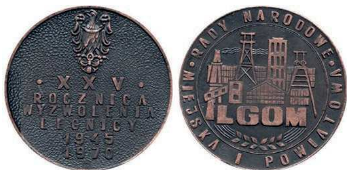
Rys. 55. Medal 25-lecia wyzwolenia Legnicy

na rewersie zabudowania miejskie i przemysłowe, poniżej napis: LGOM (Legnicko-Głogowski Okręg Miedziowy), w otoku: RADY NARODOWE / MIEJSKA I POWIATOWA.