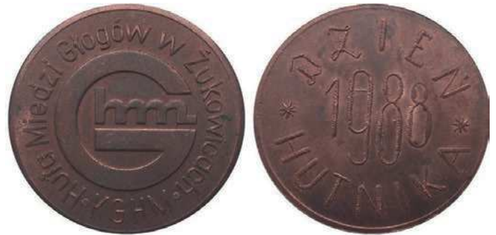
Rys. 47. Medal Huty Miedzi Głogów z okazji Dnia Hutnika 1988

W latach 1988 i 1990 zostały wydane medale z identycznym awersem i napisem DZIEŃ HUTNIKA 1988 (1990) na rewersie (rys. 47, 48).