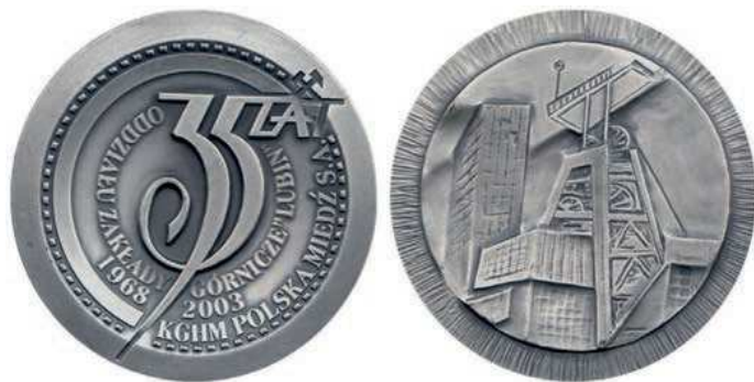
Rys. 30. Medal 35-lecia Oddziału Zakładów Górniczych Lubin

Również kolejny jubileusz w 2003 r. uczczono medalem (rys. 30). Na awersie napis 35 LAT, nad nim skrzyżowane młotki górnicze. Wokół napisy: ODDZIAŁU ZAKŁADY GÓRNICZE „LUBIN” /