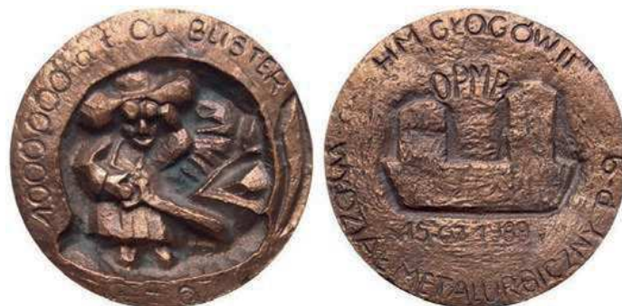
Rys. 49. Medal upamiętniający 1 mln ton miedzi z Huty Miedzi Głogów II

Z 1989 r. pochodzi medal odlewany, upamiętniający 1 mln ton miedzi z Huty Miedzi Głogów II (rys. 49). Na awersie postać hutnika przy pracy, u góry przy krawędzi napisano: 1000000 a t Cu BLISTER. Na rewersie widnieje napis: OPMB / 15.07.1989, przy krawędzi: HM "GŁOGÓW II" / WYDZIAŁ METALURGICZNY P-9. Średnica medalu wynosi 97 mm, grubość ok. 15 mm.