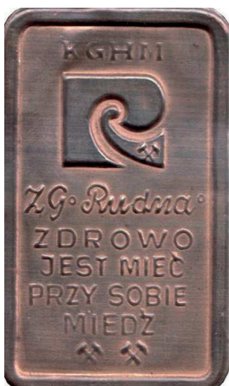
Rys.42. Plakietka Zakładów Górniczych Rudna

Kolejną pamiątką z Zakładów Górniczych Rudna jest niewielka plakietka wytłoczona z miedzianej blachy (rys. 42). Od góry widnieje napis KGHM, logo kopalni oraz napisy: ZG Rudna / ZDROWO / JEST MIEĆ / PRZY SOBIE / MIEDŹ. U dołu dwie pary skrzyżowanych młotków górniczych.