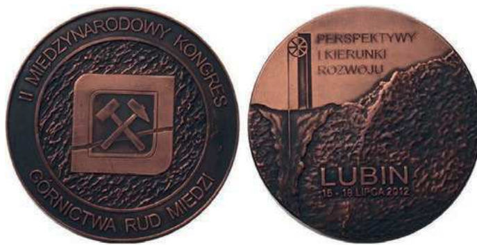
Rys. 22. Medal II Międzynarodowego Kongresu Górnictwa Rud Miedzi

W dniach 16–18 lipca 2012 r. pod hasłem „Perspektywy i kierunki rozwoju” w Lubinie odbył się II Międzynarodowy Kongres Górnictwa Rud Miedzi. Organizatorem kongresu byli: KGHM Polska Miedź, Stowarzyszenie Inżynierów i Techników Górnictwa Oddział Lubin oraz Związek Pracodawców Polska Miedź. Brało w nim udział ok. 400 osób z 15 krajów. Z okazji kongresu został wydany pamiątkowy medal (rys. 22). Na awersie na fakturowanej powierzchni znajduje się logo kongresu ze skrzyżowanymi młotkami górniczymi, w otoku napis: II MIĘDZYNARODOWY KONGRES / GÓRNICTWA RUD MIEDZI. Na rewersie przekrój ziemi z symbolicznym szybem górniczym. U dołu napis: LUBIN / 16–18 LIPCA 2012. U góry jest hasło kongresu: PERSPEKTYWY / I KIERUNKI / ROZWOJU. Średnica medalu to 68 mm.