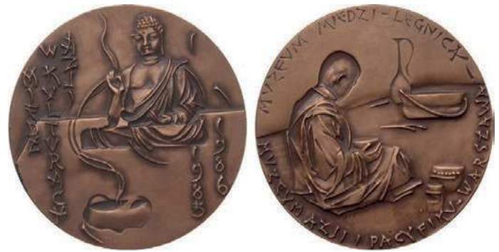
Rys. 3. Medal wystawy „Miedź w kulturach Azji”

W celu udokumentowania informacji o miedzi i jej wykorzystaniu przez człowieka w 1962 r. utworzono Muzeum Miedzi w Legnicy. Jego siedzibą został, wybudowany w latach 1726–1728, pałac opatów cysterskich – z pięknym wejściem głównym z portalem i umieszczonym nad nim balkonem z figurami św. Jana Chrzyciela i św. Jadwigi. Muzeum ma eksponaty związane z historią Legnicy oraz zbiór minerałów miedzi z całego świata, zabytki związane z górnictwem i hutnictwem miedzi, kolekcje przedmiotów użytkowych i artystycznych z miedzi i jej stopów [1]. W 1972 r. został wydany medal z okazji 10-lecia Muzeum Miedzi w Legnicy (rys. 2). Na awersie przedstawiono fasadę budynku Muzeum, w otoku napis: X-LECIE MUZEUM MIEDZI W LEGNICY 1962–1972. Na rewersie napis: ARCHEOLOGIA / SZTUKA / GÓRNICTWO / i HUTNICTWO / MIEDZI. Autorem medalu jest Józef Stasiński (średnica to 70 mm).