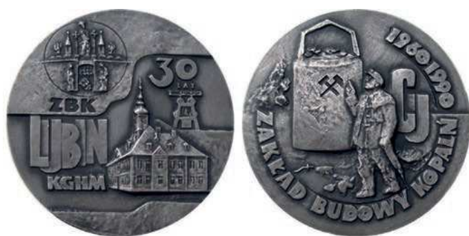
Rys. 25. Medal 30-lecia Zakładu Budowy Kopalń

30-lecie Zakładu Budowy Kopalń zostało upamiętnione medalem w 1990 r. (rys. 25). Na awersie przedstawiono ratusz w Lubinie, za nim wieżę szybu kopalni, powyżej napis: 30 / LAT. Z lewej strony: ZBK / LUBIN / KGHM, u góry pieczęć herbowa Lubina. Na rewersie widnieje sylwetka górnika, za nim kubeł wydobywczy z godłem górniczym w postaci skrzyżowanych młotków, po prawej stronie litery CU. W otoku napis: ZAKŁAD BUDOWY KOPALŃ / 1960 1990. Autorem projektu jest Józef Stasiński. Medal wybito w Mennicy Państwowej w nakładzie: 155 sztuk tombak srebrzony i oksydowany, 155 sztuk tombak patynowany, 60 sztuk srebro (średnica 70 mm).