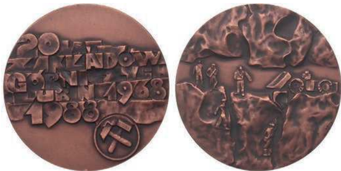
Rys. 28. Medal 20-lecia Zakładów Górniczych Lubin

Jubileusz 20-lecia Zakładów Górniczych Lubin upamiętnia medal z 1988 r. (rys. 28). Na awersie znajduje się stylizowany napis: 20 LAT / ZAKŁADÓW / GÓRNICZYCH / LUBIN 1968 / 1988. Poniżej po prawej stronie dwa skrzyżowane młotki górnicze w kółku. Na rewersie postacie górników w kopalni, z prawej strony ładowarka. Autorem projektu jest Hanna Jelonek. W nakładzie 1550 sztuk medal wybiła Mennica Państwowa (średnica 60 mm).