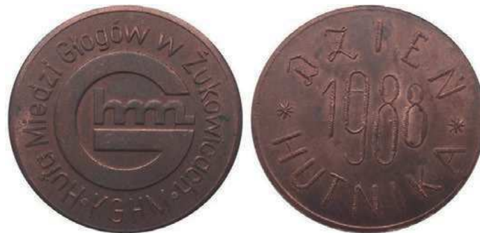
Rys. 47. Medal Huty Miedzi Głogów z okazji Dnia Hutnika 1988

W latach 1988 i 1990 zostały wydane medale z identycznym awersem i napisem DZIEŃ HUTNIKA 1988 (1990) na rewersie (rys. 47, 48).