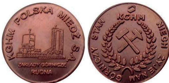
Rys. 40. Żeton Zakładów Górniczych Rudna

Również kolejne dwa żetony zostały wyemitowane przez Zakłady Górnicze Rudna. Na awersie pierwszego z nich (rys. 40) przedstawiono rysunek zabudowań kopalni, poniżej napis: ZAKŁADY GÓRNICZE / RUDNA, przy krawędzi: KGHM POLSKA MIEDŹ S.A., na rewersie skrzyżowane młotki górnicze otoczone splecionymi gałązkami, nad nimi logo i nazwę KGHM, w otoku: NIECH ŻYJE NAM GÓRNICZY STAN (średnica 28 mm).