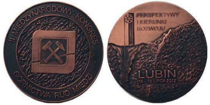
Rys. 22. Medal II Międzynarodowego Kongresu Górnictwa Rud Miedzi

W dniach 16–18 lipca 2012 r. pod hasłem „Perspektywy i kierunki rozwoju” w Lubinie odbył się II Międzynarodowy Kongres Górnictwa Rud Miedzi. Organizatorem kongresu byli: KGHM Polska Miedź, Stowarzyszenie Inżynierów i Techników Górnictwa Oddział Lubin oraz Związek Pracodawców Polska Miedź. Brało w nim udział ok. 400 osób z 15 krajów. Z okazji kongresu został wydany pamiątkowy medal (rys. 22). Na awersie na fakturowanej powierzchni znajduje się logo kongresu ze skrzyżowanymi młotkami górniczymi, w otoku napis: II MIĘDZYNARODOWY KONGRES / GÓRNICTWA RUD MIEDZI. Na rewersie przekrój ziemi z symbolicznym szybem górniczym. U dołu napis: LUBIN / 16–18 LIPCA 2012. U góry jest hasło kongresu: PERSPEKTYWY / I KIERUNKI / ROZWOJU. Średnica medalu to 68 mm.