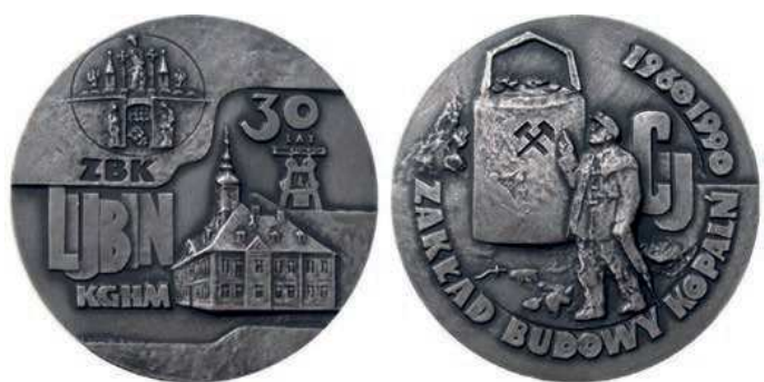
Rys. 25. Medal 30-lecia Zakładu Budowy Kopalń

30-lecie Zakładu Budowy Kopalń zostało upamiętnione medalem w 1990 r. (rys. 25). Na awersie przedstawiono ratusz w Lubinie, za nim wieżę szybu kopalni, powyżej napis: 30 / LAT. Z lewej strony: ZBK / LUBIN / KGHM, u góry pieczęć herbowa Lubina. Na rewersie widnieje sylwetka górnika, za nim kubeł wydobywczy z godłem górniczym w postaci skrzyżowanych młotków, po prawej stronie litery CU. W otoku napis: ZAKŁAD BUDOWY KOPALŃ / 1960 1990. Autorem projektu jest Józef Stasiński. Medal wybito w Mennicy Państwowej w nakładzie: 155 sztuk tombak srebrzony i oksydowany, 155 sztuk tombak patynowany, 60 sztuk srebro (średnica 70 mm).