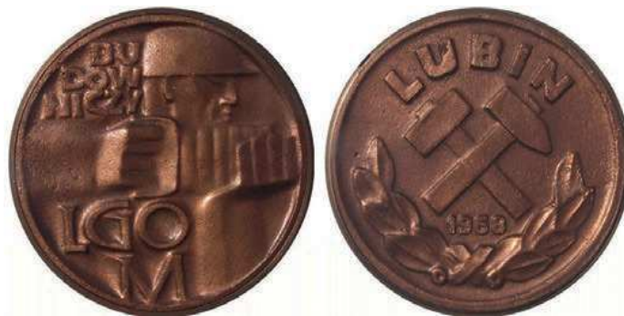
Rys. 23. Medal Budowniczy LGOM

Z okazji rozpoczęcia działania kopalni Rudna w 1968 r. został wydany medal dla budowniczych LGOM (Legnicko-Głogowski Okręg Miedziowy) – rys. 23. Na awersie przedstawiono postać górnika w profilu, trzymającego młot udarowy. U góry z lewej strony napis: BU / DOW / NICZY, u dołu: LGO / M. Na rewersie są dwa skrzyżowane młotki górnicze, pod nimi data: 1968, u góry półkolem: LUBIN, u dołu związane gałązki laurowe. Medal odlany w miedzi, nakład 300 sztuk, średnica 69 mm. Medal wręczano 22 lipca 1968 r. w trakcie uroczystości oddania do użytku Zakładów Górniczych Lubin i Polkowice [3].