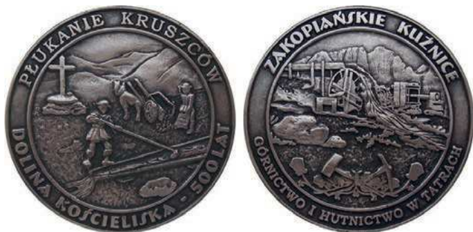
Rys. 6. Medal Górnictwo i hutnictwo w Tatrach

Informacja o odkryciu złóż srebra i miedzi w Tatrach dotarła do Krakowa w 1502 r. Zainteresowany odkryciem był ówczesny król Polski Aleksander Jagiellończyk. Jednak uruchomiona kopalnia, ze względu na niewielką wydajność, nie działała długo. Wydarzenia te przypominają kolejny medal (rys. 6). Na awersie przedstawiono górników wyłukujących urobek, w tle krzyż i góry. W otoku napis: PŁUKANIE KRUSZCÓW / DOLINA KOŚCIELISKA – 500 LAT. Na rewersie zabytkowe instalacje do wyłukiwania kruszców, u dołu ornament roślinny z młotkiem i kilofem. W otoku napis: ZAKOPIAŃSKIE KUŹNICE / GÓRNICCTWO I HUTNICCTWO W TATRACH. Medal ma kształt dysku o średnicy 72 mm.