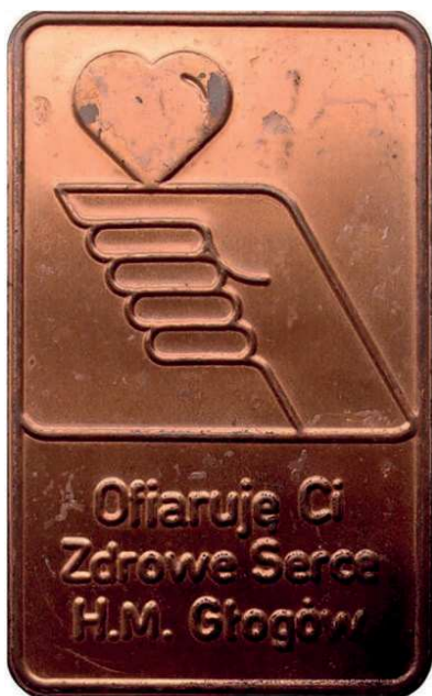
Rys. 51. Plaketka Huty Miedzi Głogów

Huta Miedzi Głogów wyemitowała też prostokątną plaketkę wytłoczoną z miedzianej blachy (rys. 51). Przedstawiono na niej serce na ręce, u dołu napis: Ofiaruję Ci / Zdrowe Serce / H.M. Głogów, wymiary to 50x79 mm.