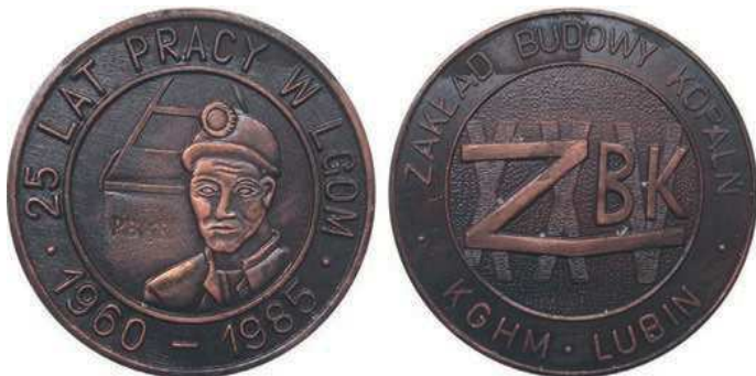
Rys. 24. Medal 25 lat pracy w LGOM

z napisem PBKRM (Przedsiębiorstwo Budowy Kopalń Rud Miedzi), w otoku napis: 25 LAT PRACY W LGOM / 1960–1985, na rewersie litery ZBK na tle liczby XXV, w otoku napis: ZAKŁAD BUDOWY KOPALŃ / KGHM LUBIN. Medal został wybity w miedzi w nakładzie 2000 sztuk, średnica 45 mm.