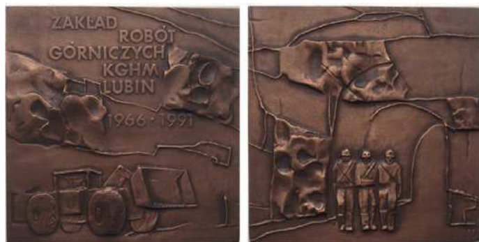
Rys. 26. Medal 25-lecia Zakładu Robót Górniczych

W 1991 r. Zakład Robót Górniczych obchodził jubileusz 25-lecia. Z tej okazji wydano pamiątkowy medal (rys. 26). U dołu awersu przedstawiono ładowarkę, powyżej napis: ZAKŁAD / ROBÓT / GÓRNICZYCH / KGHM / LUBIN / 1966–1991. Na rewersie na tle przekroju szybu kopalnianego sylwetki trzech górników. Medal zaprojektowała Hanna Jelonek. W nakładzie 300 sztuk w miedzi, 300 sztuk tombak srebrzony i oksydowany, 300 sztuk tombak patynowany wybiła Mennica Państwowa. Medal w kształcie kwadratu ma wymiary 65×65 mm.