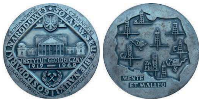
Rys. 61. Medal 50-lecia Państwowego Instytutu Geologicznego

Jeszcze dłuższą historię ma Państwowy Instytut Geologiczny. Został uroczystie otwarty 9 maja 1919 r., będąc jednym z najstarszych polskich instytutów naukowych o zasięgu