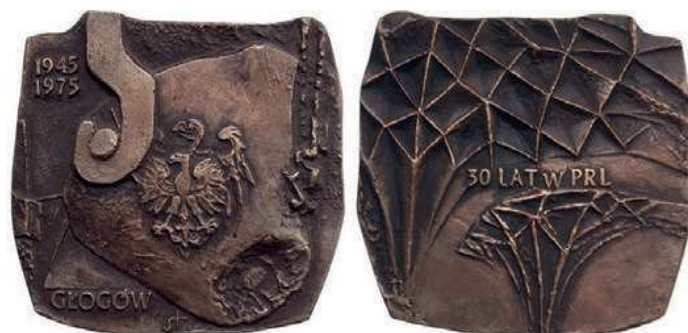
Rys. 45. Medal 30-lecia Głogowa

W 1975 r. został wykonany medal Głogowa (rys. 45). Na awersie występuje fragment kadzi hutniczej, na niej orzeł ze współczesnego godła Polski na tle orła z godła historycznego. Z lewej strony widać u dołu napis: GŁOGÓW, u góry daty: 1945 / 1975, na rewersie na tle sklepienia sieciowego napis: 30 LAT W PRL. Autorem medalu jest Józef Stasiński. Medal ma kształt nieregularny o wymiarach zewnętrznych 105×105 mm.