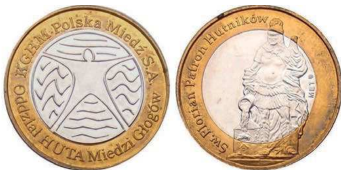
Rys. 50. Bimetalowy żeton Huty Miedzi Głogów z 2013 r.

Z 2013 r. pochodzi wyemitowany przez Hutę Miedzi Głogów żeton (rys. 50). Na awersie znajduje się okolicznościowe logo, w otoku napis: KGHM Polska Miedź S.A. / Oddział HUTA Miedzi Głogów. Na rewersie pokazano postać św. Floriana. Z lewej strony w półotoku: Św. Florian Patron Hutników, żeton bimetalowy o średnicy 27 mm: otok z mosiądzu, rdzeń z miedzioniklu. W nakładzie 5000 sztuk wybiła Mennica Polska.