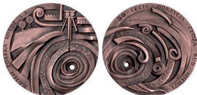
Rys. 10. Medal 50-lecia odkrycia złóż miedzi