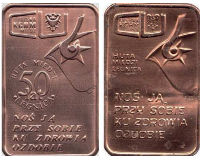
Rys. 54. Plakietki Huty Miedzi Legnica