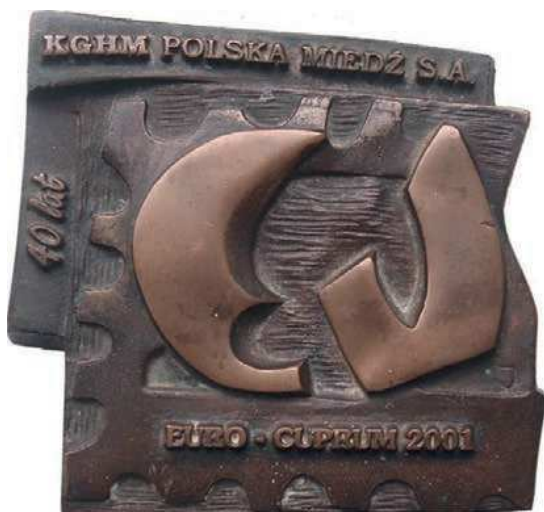
Rys. 17. Plakietka 40-lecia KGHM Polska Miedź S.A.

Z okazji tego samego wydarzenia pochodzi pamiątkowa plakietka (rys. 17). Na ząbkowanym polu symbolizującym znaczek pocztowy umieszczono stylizowane litery Cu. Poniżej jest napis: EURO – CUPRUM 2001. Przy górnej krawędzi KGHM POLSKA MIEDŹ S.A. Z lewej strony: 40 lat. Wymiary plakietki to 115×108 mm.