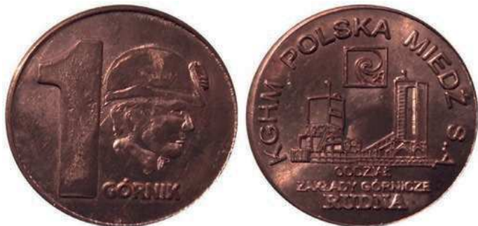
Rys. 41. Żeton 1 Górnika z Zakładów Górniczych Rudna

Na awersie kolejnego żetonu (rys. 41) umieszczono głowę górnika w kasku w profilu w prawo, z lewej strony cyfrę 1, poniżej napis GÓRNIK. Na rewersie zabudowania kopalni, powyżej znak firmowy ZG Rudna. U dołu napis: ODDZIAŁ / ZAKŁADY GÓRNICZE / RUDNA. Przy krawędzi: KGHM POLSKA MIEDŹ S.A. Średnica 28 mm.