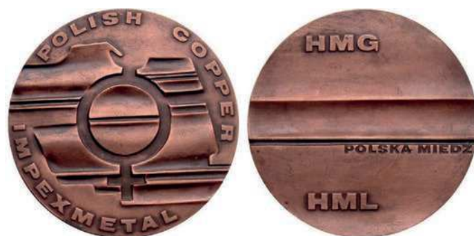
Rys. 11. Medal IMPEXMETAL – Polska Miedź

KGHM POLSKA MIEDŹ. W 1960 r. zostało powołane w Lubinie państwowe przedsiębiorstwo Zakłady Górnicze Lubin w budowie. Zakłady te 1 maja 1961 r. zostały przekształcone w Kombinat Górniczo-Hutniczy Miedzi w Lubinie, co dało początek znanemu do dzisiaj skróтови KGHM. Zadaniem Kombinatów była budowa kopalń, zakładów wzbogacania rudy, hut miedzi, budowa zakładów pomocniczych oraz zaplecza socjalnego. Po przemianach politycznych rozpoczętych w Polsce w 1989 r., podjęto działania restrukturyzacji Kombinat Górniczo-Hutniczego Miedzi. Z dniem 12 września 1991 r. w jego miejsce została powołana jednoosobowa Spółka Skarbu Państwa – KGHM Polska Miedź S.A. W czerwcu 1997 r. przeprowadzono ofertę publiczną akcji KGHM Polska Miedź S.A., w wyniku której Skarb Państwa zbył 32,8% akcji. Prywatyzację i wejście na giełdy papierów wartościowych w Warszawie i Londynie przeprowadzono 10 lipca 1997 r. [2]. W 1977 r. Mennica Państwowa wybiła medal IMPEXMETAL – Polska Miedź (rys. 11). Na awersie przedstawiono międzynarodowy symbol miedzi na tle stylizowanej mapy Polski z poziomymi pasami. Przy krawędzi napisy: POLISH COPPER (Polska Miedź) i IMPEXMETAL (specjalizujące się w handlu metalami nieżelaznymi przedsiębiorstwo handlu zagranicznego). Na rewersie poziomy pas, pod nim napis: POLSKA MIEDŹ. U góry i u dołu