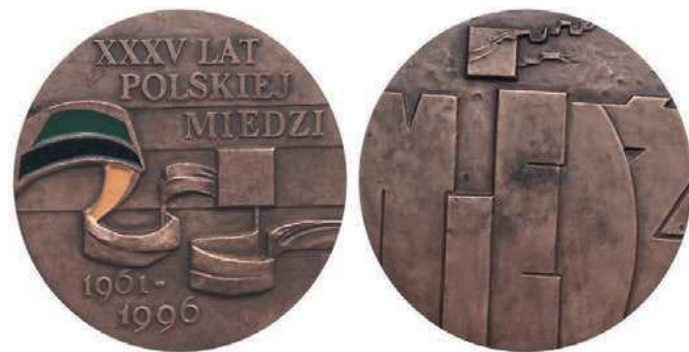
Rys. 15. Medal 35-lecia Polskiej Miedzi

Z 1996 r. pochodzi medal upamiętniający 35-lecie utworzenia Kombinatu Górniczo-Hutniczego Miedzi (rys. 15). Na awersie po obu stronach kwadratu jest falująca wstążka. Fragment został pokryty: zieloną, czarną i żółtą emalią. Zieleń i czerń symbolizują górnictwo, pomarańcz (na medalu błędnie kolor żółty) hutnictwo. W górnej części awersu napis: XXXV LAT / POLSKIEJ / MIEDZI. U dołu daty: 1961–1996. Na rewersie dużymi literami napis: MIEDŹ. U góry kostka z powiewającą wstęgą. Medal zaprojektowała i wykonała Hanna Jelonek (średnica 70 mm). W nakładzie 2000 sztuk wybiła go Mennica Państwowa.