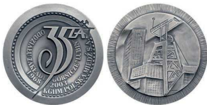
Rys. 30. Medal 35-lecia Oddziału Zakładów Górniczych Lubin

Również kolejny jubileusz w 2003 r. uczczono medalem (rys. 30). Na awersie napis 35 LAT, nad nim skrzyżowane młotki górnicze. Wokół napisy: ODDZIAŁU ZAKŁADY GÓRNICZE „LUBIN” /