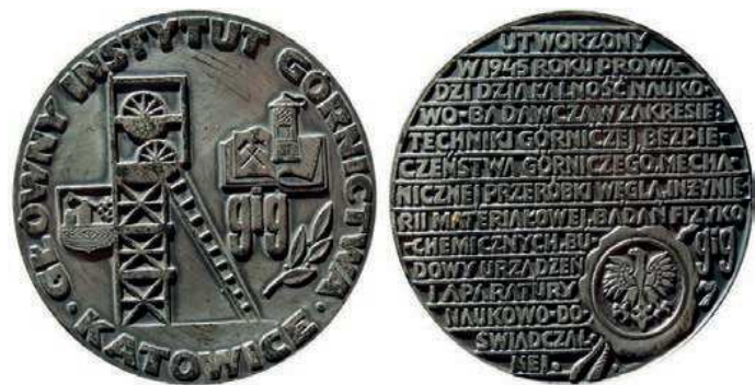
Rys. 59. Medal Głównego Instytutu Górnictwa z 1978 r.

Cuprum to nie jedyna jednostka naukowo-badawczo-rozwojowa zajmująca się górnictwem miedzi. Dnia 16 kwietnia 1945 r. w Katowicach powołano Instytut Naukowo-Badawczy Przemysłu Węglowego. W latach 1948–1950 działał jako Instytut Węglowy w ramach Głównego Instytutu Paliw Naturalnych, a od 1950 r. jako Główny Instytut Górnictwa. Medal Głównego Instytutu Górnictwa został wyemitowany w 1978 r. (rys. 59). Na awersie przedstawiono wieżę szybu górniczego, natomiast z lewej strony herb Katowic, z prawej lampę górniczą na tle otwartej książki, na karcie skrzyżowane młotki górnicze. Poniżej książki widnieją litery: gig oraz gałązka laurowa, w otoku napis: GŁÓWNY INSTYTUT GÓRNICHTWA / KATOWICE, na rewersie napis: UTWORZONY / W 1945 ROKU PROWA – / DZI DZIAŁALNOŚĆ