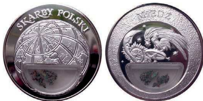
Rys. 1. Medal Miedź z serii Skarby Polski

W naturze czysta miedź jako miedź rodzima jest minerałem spotykanym rzadko, stanowiąc ok. 1% jej związków. Około 90% miedzi wchodzi w skład rud siarczkowych, a pozostałe 9% w skład tlenków metali. Większość miedzi pozyskiwana jest z minerałów kruszcowych, takich jak: chalkozyn, bornit, chalkopiryt, digenit, kowelin, kupryt, malachit, djurleit, anilit, idait [4]. Jeden z medali z serii Skarby Polski został poświęcony miedzi (rys. 1). Na awersie przedstawiono kulę ziemską z zaznaczonymi konturami Polski, na rewersie: słońce, księżyc, gwiazdy i wiatrowskaz. W dolnej części pojemnik z okruchami miedzi. Medal o średnicy 50 mm jest platerowany srebrem.