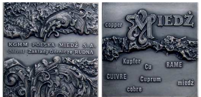
Rys. 35. Medal Oddział Zakłady Górnicze Rudna z 1997 r.