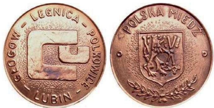
Rys. 13. Medal Polska Miedź z 1978 r.

W 1986 r. w Mennicy Państwowej został wybity medal Kombinatu Górniczo-Hutniczego Miedzi (rys. 14). Na awersie umieszczono stylizowany napis: KOMBINAT / GÓRNICZO / HUTNICZY / MIEDZI / LUBIN. W górnej części zamieszczono godło górnicze, w prawym dolnym rogu alchemiczny symbol miedzi. Na rewersie pokazano płyty miedzi. W lewym dolnym rogu litery CU. W prawym górnym rogu litery CU z wpisanym skrótem KGHM