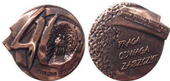
Rys. 31. Medal 40-lecia Oddziału Zakładów Górniczych Lubin

W 2008 r. został wydany medal z okazji 40-lecia Zakładów Górniczych Lubin (rys. 31). Na rewersie jest stylizowana liczba 40, wewnątrz zera postacie dwóch górników. U dołu napis: 1968-2008 ZG LUBIN. Na awersie napis: PRACA / ODWAGA / ZASZCZYT. Powyżej: KGHM POLSKA MIEDŹ S.A. / ODDZIAŁ ZAKŁADY GÓRNICZE „LUBIN”. Medal zaprojektowano w nieregularnych kształtach, szerokość 73 mm, wysokość 60 mm.