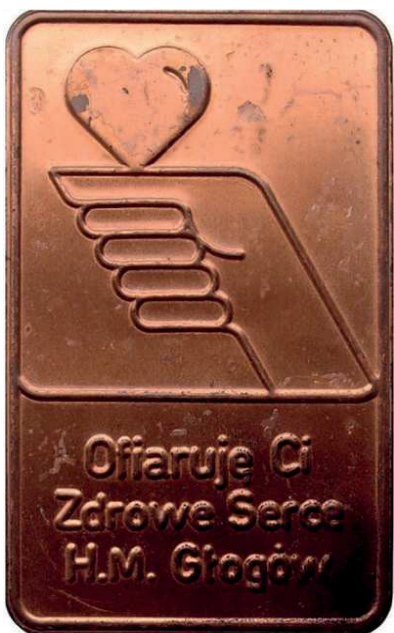
Rys. 51. Plaketka Huty Miedzi Głogów

Huta Miedzi Głogów wyemitowała też prostokątną plaketkę wytłoczoną z miedzianej blachy (rys. 51). Przedstawiono na niej serce na ręce, u dołu napis: Ofiaruję Ci / Zdrowe Serce / H.M. Głogów, wymiary to 50x79 mm.