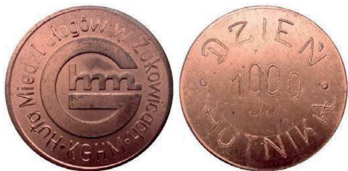
Rys. 48. Medal Huty Miedzi Głogów z okazji Dnia Hutnika 1990

Z 1989 r. pochodzi medal odlewany, upamiętniający 1 mln ton miedzi z Huty Miedzi Głogów II (rys. 49). Na awersie postać hutnika przy pracy, u góry przy krawędzi napisano: 1000000 a t Cu BLISTER. Na rewersie widnieje napis: OPMB / 15.07.1989, przy krawędzi: HM "GŁOGÓW II" / WYDZIAŁ METALURGICZNY P-9. Średnica medalu wynosi 97 mm, grubość ok. 15 mm.