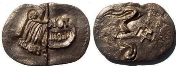
Rys. 21. Medal Klubu NOT KGHM

W 1980 r. Stowarzyszenie Inżynierów i Techników Górnictwa w Lubinie wydało medal Klubu NOT KGHM (rys. 21). Na awersie znalazł się stylizowany orzeł, pod lewym skrzydłem napis: KLUB, na prawym: NOT / KGHM. Na rewersie skrzyżowane młotki górnicze i faliste ornamenty. Medal został odlany z mosiądzu, wymiary to 95×63 mm.