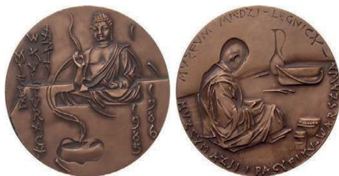
Rys. 3. Medal wystawy „Miedź w kulturach Azji”

Muzeum Miedzi w Legnicy wspólnie z Muzeum Azji i Pacyfiku w Warszawie zorganizowało wystawę „Miedź w kulturach Azji”. Była ona prezentowana w okresie od listopada 1985 r. do stycznia 1986 r. w Galerii Nusantara Muzeum Azji i Pacyfiku oraz w okresie styczeń – marzec 1986 r. w Muzeum Miedzi w Legnicy. Z okazji wystawy w 1985 r. został wyemitowany pamiątkowy medal (rys. 3). Na awersie przedstawiono siedzącego Budę, przed nim płonące kadzidło. Z lewej strony stylizowany napis: MIEDŹ / W KULTURACH / AZJI, z prawej daty: 1985 / 1986. Na rewersie siedzący mnich buddyjski. Przed nim naczynia. W otoku napis: MUZEUM MIEDZI – LEGNICA / MUZEUM AZJI I PACYFIKU – WARSZAWA. Autorem projektu jest Hanna Jelonek. Medal w nakładzie 250 sztuk w miedzi i 250 sztuk tombak patynowany wybiła Mennica Państwowa, średnica 69 mm.