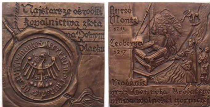
Rys. 5. Medal upamiętniający najstarsze ośrodki kopalnictwa na Dolnym Śląsku