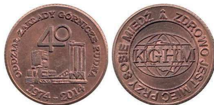
Rys. 39. Żeton 40-lecia Zakładów Górniczych Rudna

Z tej samej okazji 40-lecia Zakładów Górniczych Rudna został wykonany żeton (rys. 39). Na awersie umieszczono zabudowania kopalni, nad nimi liczbę 40, w otoku napis: ODDZIAŁ ZAKŁADY GÓRNICZE RUDNA / 1974–2014, na rewersie napis KGHM na tle kuli ziemskiej z obrysem granic Polski, w otoku natomiast: ZDROWO JEST MIEĆ PRZY SOBIE MIEDŹ.