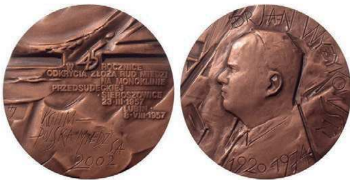
Rys. 8. Medal 45-lecia odkrycia złóż polskiej miedzi

Drugi medal z Janem Wyżykowskim został wyemitowany w 2002 r. z okazji 45-lecia odkrycia złóż rud miedzi (rys. 8). Na awersie na fakturowanej powierzchni znajduje się napis: W 45 ROCZNICĘ / ODKRYCIA ZŁOŻA RUD MIEDZI / NA MONOKLINIE / PRZEDSUDECKIEJ / SIEROSZOWICE / 23.III.1957 / LUBIN / 8.VIII.1957. W dolnej części: KGHM – / POLSKA MIEDŹ S.A. / 2002.