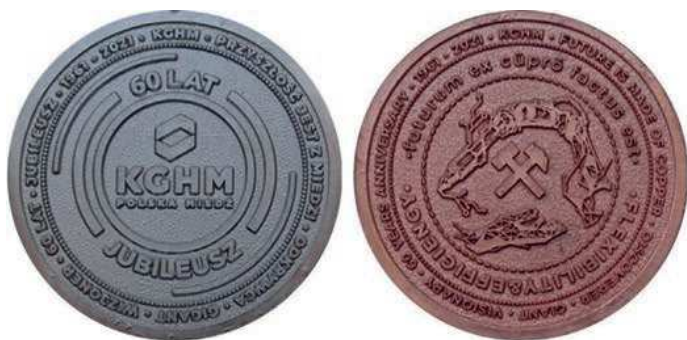
Rys. 20. Medal 60-lecia KGHM Polska Miedź S.A. (awers i rewers medali z różnych wersji kolorystycznych)

* DISCOVERER * GIANT * VISIONARY * 60 YEARS ANNIVERSARY * 1961–2001. Średnica medalu to 40 mm. Medale zostały wykonane w zakładzie Odlewnictwo Eksport-Import w Kłobucku. łączny nakład to 1170 sztuk.