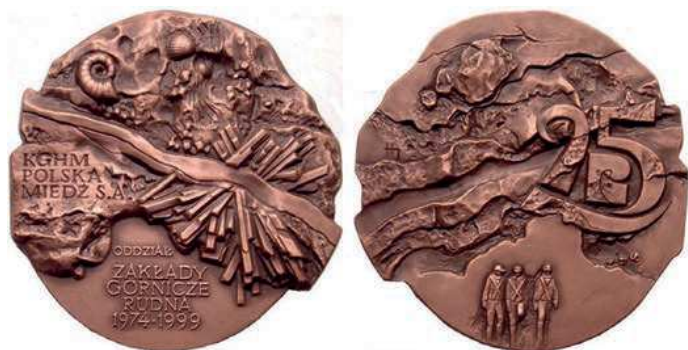
Rys. 36. Medal 25-lecia Zakładów Górniczych Rudna

W 1999 r. został wyemitowany medal z okazji 25-lecia Zakładów Górniczych Rudna (rys. 36). Na awersie przedstawiono złożone rudy miedzi ze skamienielinami oraz napisy: KGHM / POLSKA / MIEDŹ S.A. / ODDZIAŁ / ZAKŁADY / GÓRNICZE / RUDNA / 1974–1999. Na rewersie umieszczono rysunek stylizowanego chodnika kopalni, z prawej strony liczbę 25 pomiędzy cyframi logo ZG Rudna, na dole sylwetki trzech górników. Medal zaprojektowała Hanna Jelonek. W miedzi w nakładzie 3000 sztuk wybiła go Mennica Państwowa. Kształt medalu jest nieregularny, wymiary zewnętrzne to 70×68 mm.