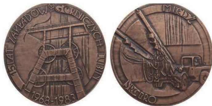
Rys. 27. Medal 15-lecia Zakładów Górniczych Lubin

Zakłady Górnicze Lubin. Zakłady Górnicze Lubin w budowie zostały powołane 1 stycznia 1960 r. W tym samym roku rozpoczęto budowę pierwszego szybu. Szyb ten umożliwił dotarcie do złóż rud miedzi 20 marca 1963 r., natomiast eksploatację rudy miedzi rozpoczęto 19 lipca 1968 r. [3]. W 1983 r. został wydany medal z okazji 15-lecia uruchomienia eksploatacji rudy miedzi w Zakładach Górniczych Lubin (rys. 27). Na awersie umieszczono wieżę szybu górniczego, w otoku napis: 15 LAT ZAKŁADÓW GÓRNICZYCH LUBIN / 1968–1983, na rewersie samojezdny wóz górniczy. W górnej i dolnej części przy krawędzi napisy: MIEDŹ / SREBRO. Medal zaprojektowała i wykonała Hanna Jelonek (średnica 70 mm). Medal wybito w miedzi (100 sztuk), tombaku patynowanym (500 sztuk) i srebrze (200 sztuk).