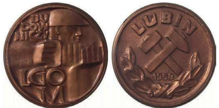
Rys. 23. Medal Budowniczy LGOM

Z okazji rozpoczęcia działania kopalni Rudna w 1968 r. został wydany medal dla budowniczych LGOM (Legnicko-Głogowski Okręg Miedziowy) – rys. 23. Na awersie przedstawiono postać górnika w profilu, trzymającego młot udarowy. U góry z lewej strony napis: BU / DOW / NICZY, u dołu: LGO / M. Na rewersie są dwa skrzyżowane młotki górnicze, pod nimi data: 1968, u góry półkolem: LUBIN, u dołu związane gałązki laurowe. Medal odlany w miedzi, nakład 300 sztuk, średnica 69 mm. Medal wręczano 22 lipca 1968 r. w trakcie uroczystości oddania do użytku Zakładów Górniczych Lubin i Polkowice [3].