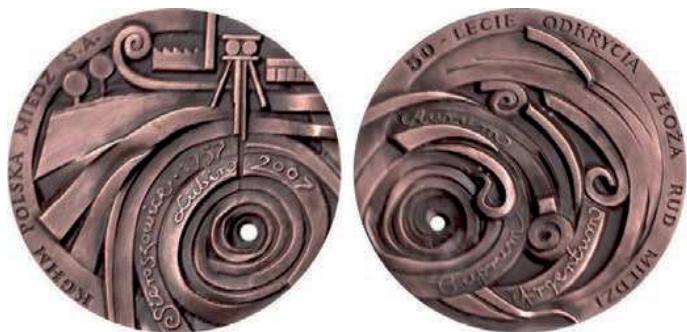
Rys. 10. Medal 50-lecia odkrycia złóż miedzi