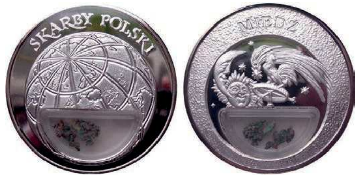
Rys. 1. Medal Miedź z serii Skarby Polski

W naturze czysta miedź jako miedź rodzima jest minerałem spotykanym rzadko, stanowiąc ok. 1% jej związków. Około 90% miedzi wchodzi w skład rud siarczkowych, a pozostałe 9% w skład tlenków metali. Większość miedzi pozyskiwana jest z minerałów kruszcowych, takich jak: chalkozyn, bornit, chalkopiryt, digenit, kowelin, kupryt, malachit, djurleit, anilit, idait [4]. Jeden z medali z serii Skarby Polski został poświęcony miedzi (rys. 1). Na awersie przedstawiono kulę ziemską z zaznaczonymi konturami Polski, na rewersie: słońce, księżyc, gwiazdy i wiatrowskaz. W dolnej części pojemnik z okruchami miedzi. Medal o średnicy 50 mm jest platerowany srebrem.