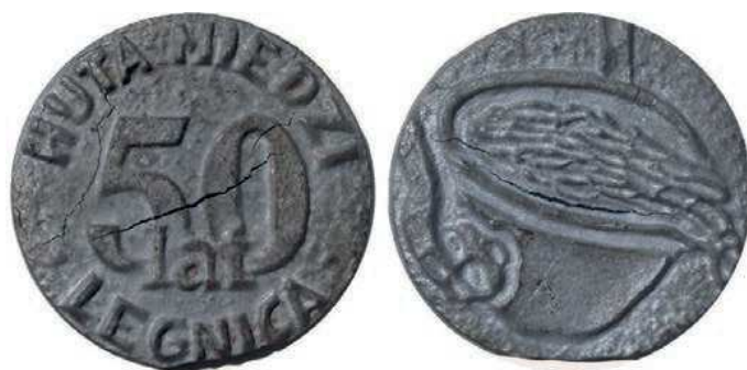
Rys. 53. Medal 50-lecia Huty Miedzi Legnica

Huta Miedzi Legnica. W 1951 r. rozpoczęto budowę Zakładów Metalurgicznych w Legnicy, a już 24 grudnia 1953 r. przeprowadzono pierwszy spust miedzi. W pełnym zakresie huta została przekazana do eksploatacji w 1959 r. [2]. Legnickie Zakłady Metalurgiczne zostały przekształcone 19 marca 1959 r. w Hutę Miedzi Legnica. Pamiątkowy medal został wykonany z okazji 50-lecia Huty Miedzi Legnica (rys. 53). Na awersie widnieje napis: 50 / lat, w otoku: HUTA MIEDZI / LEGNICA, na rewersie rysunek pokazujący kład hutniczą (średnica 89 mm).