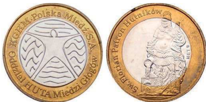
Rys. 50. Bimetalowy żeton Huty Miedzi Głogów z 2013 r.

Z 2013 r. pochodzi wyemitowany przez Hutę Miedzi Głogów żeton (rys. 50). Na awersie znajduje się okolicznościowe logo, w otoku napis: KGHM Polska Miedź S.A. / Oddział HUTA Miedzi Głogów. Na rewersie pokazano postać św. Floriana. Z lewej strony w półotoku: Św. Florian Patron Hutników, żeton bimetalowy o średnicy 27 mm: otok z mosiądzu, rdzeń z miedzioniklu. W nakładzie 5000 sztuk wybiła Mennica Polska.