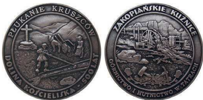
Rys. 6. Medal Górnictwo i hutnictwo w Tatrach

Informacja o odkryciu złóż srebra i miedzi w Tatrach dotarła do Krakowa w 1502 r. Zainteresowany odkryciem był ówczesny król Polski Aleksander Jagiellończyk. Jednak uruchomiona kopalnia, ze względu na niewielką wydajność, nie działała długo. Wydarzenia te przypominają kolejny medal (rys. 6). Na awersie przedstawiono górników wyłukujących urobek, w tle krzyż i góry. W otoku napis: PŁUKANIE KRUSZCÓW / DOLINA KOŚCIELISKA – 500 LAT. Na rewersie zabytkowe instalacje do wyłukiwania kruszców, u dołu ornament roślinny z młotkiem i kilofem. W otoku napis: ZAKOPIAŃSKIE KUŹNICE / GÓRNICCTWO I HUTNICCTWO W TATRACH. Medal ma kształt dysku o średnicy 72 mm.