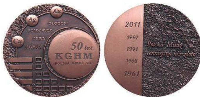
Rys. 19. Medal 50-lecia KGHM Polska Miedź S.A.

Również 50-lecie KGHM Polska Miedź S.A. zostało upamiętnione medalem (rys. 19). Na awersie w większym kole napis: 50 lat / KGHM / POLSKA MIEDŹ S.A., w mniejszych kołach symbole pierwiastków: Cu, Ag, Au. Na gładkiej powierzchni nazwy miast: GŁOGÓW, POLKOWICE, LUBIN, LEGNICA. Na rewersie z lewej strony na gładkiej powierzchni daty od dołu: 1961, 1968, 1991, 1997, 2011. Z prawej strony na fakturowanej powierzchni napis: Polska Miedź / cenniejsza niż złoto. Średnica medalu wynosi 70 mm.