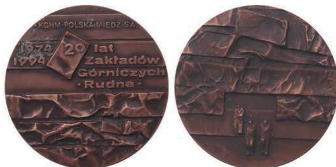
Rys. 34. Medal 20-lecia Zakładów Górniczych Rudna

W nakładzie 100 sztuk w tombaku srebrzonym i oksydowanym oraz 200 sztuk tombaku oksydowanym wybiła Mennica Państwowa (średnica 70 mm).