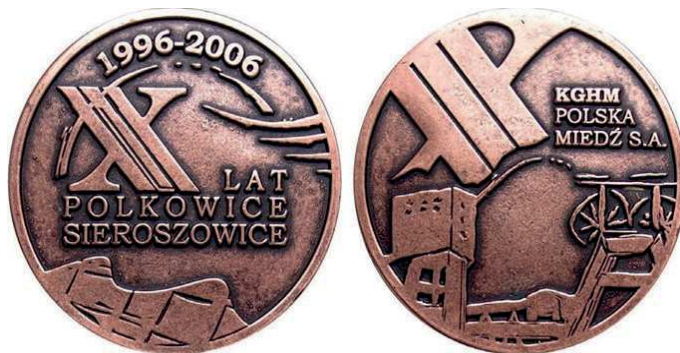
Rys. 44. Medal 10-lecia Zakładów Górniczych Polkowice-Sieroszowice

Mennica Państwowa w nakładzie 600 sztuk wybiła również medal z takim samym awersem i napisem na rewersie: JUBILEUSZ / 15-LECIA / ZAKŁADÓW GÓRNICZYCH / "SIEROSZOWICE". Z 2006 r. pochodzi medal 10-lecia Zakładów Górniczych Polkowice-Sieroszowice (rys. 44). Na awersie umieszczono napis: X LAT / POLKOWICE / SIEROSZOWICE, powyżej daty: 1996-2006. W dolnej części rewersu przedstawiono widok kopalni. Powyżej stylizowana liczba X i napis: KGHM / POLSKA / MIEDŹ S.A. Medal zaprojektował i wykonał Marian Ostrowski, Metaloplastyka Wrocław, wykonany z ołowiu miedziowanego, o średnicy 70 mm, w nakładzie 350 sztuk.