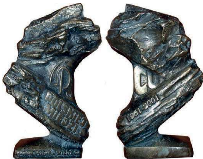
Rys. 18. Statuetka 40-lecia KGHM Polska Miedź S.A.

Również z okazji 40. rocznicy utworzenia Kombinatu Górniczo-Hutniczego Miedzi z 2001 r. pochodzi statuetka o nieregularnym kształcie (rys. 18). Na przedniej stronie stylizowany napis: 40 lat, poniżej: POLSKIEJ MIEDZI. Na podstawie: KGHM POLSKA MIEDŹ S.A. Na nieregularnej powierzchni są symbole pierwiastków chemicznych: Cu, Au, Ag, Pt. Na stronie tylnej