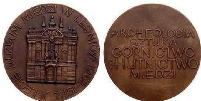
Rys. 2. Medal 10-lecia Muzeum Miedzi w Legnicy

W celu udokumentowania informacji o miedzi i jej wykorzystaniu przez człowieka w 1962 r. utworzono Muzeum Miedzi w Legnicy. Jego siedzibą został, wybudowany w latach 1726–1728, pałac opatów cysterskich – z pięknym wejściem głównym z portalem i umieszczonym nad nim balkonem z figurami św. Jana Chrzyciela i św. Jadwigi. Muzeum ma eksponaty związane z historią Legnicy oraz zbiór minerałów miedzi z całego świata, zabytki związane z górnictwem i hutnictwem miedzi, kolekcje przedmiotów użytkowych i artystycznych z miedzi i jej stopów [1]. W 1972 r. został wydany medal z okazji 10-lecia Muzeum Miedzi w Legnicy (rys. 2). Na awersie przedstawiono fasadę budynku Muzeum, w otoku napis: X-LECIE MUZEUM MIEDZI W LEGNICY 1962–1972. Na rewersie napis: ARCHEOLOGIA / SZTUKA / GÓRNICTWO / i HUTNICTWO / MIEDZI. Autorem medalu jest Józef Stasiński (średnica to 70 mm).