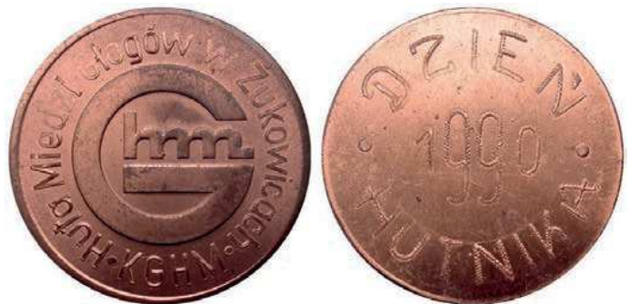
Rys. 48. Medal Huty Miedzi Głogów z okazji Dnia Hutnika 1990

Z 1989 r. pochodzi medal odlewany, upamiętniający 1 mln ton miedzi z Huty Miedzi Głogów II (rys. 49). Na awersie postać hutnika przy pracy, u góry przy krawędzi napisano: 1000000 a t Cu BLISTER. Na rewersie widnieje napis: OPMB / 15.07.1989, przy krawędzi: HM "GŁOGÓW II" / WYDZIAŁ METALURGICZNY P-9. Średnica medalu wynosi 97 mm, grubość ok. 15 mm.