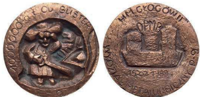
Rys. 49. Medal upamiętniający 1 mln ton miedzi z Huty Miedzi Głogów II

Z 1989 r. pochodzi medal odlewany, upamiętniający 1 mln ton miedzi z Huty Miedzi Głogów II (rys. 49). Na awersie postać hutnika przy pracy, u góry przy krawędzi napisano: 1000000 a t Cu BLISTER. Na rewersie widnieje napis: OPMB / 15.07.1989, przy krawędzi: HM "GŁOGÓW II" / WYDZIAŁ METALURGICZNY P-9. Średnica medalu wynosi 97 mm, grubość ok. 15 mm.