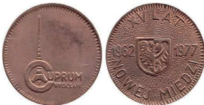
Rys. 57. Medal 15-lecia Zakładów Badawczych i Projektowych Miedzi Cuprum

JEDNOSTKI BADAWCZE. Od 1962 r. działała Wielobranżowa Pracownia Projektowa, przekształcona następnie w Oddział Zamiejscowy Biura Projektów Bipromet w Katowicach oraz Stację Badawczo-Doświadczalną Górnictwa Oddział Zamiejscowy we Wrocławiu. Na tej bazie w 1967 r. utworzono Zakłady Badawcze i Projektowe Miedzi Cuprum. Ich zadaniem było zapewnienie obsługi badawczej i projektowej Lubińsko-Głogowskiego Zagłębia Miedziowego. Od 1 stycznia 1993 r. spółka funkcjonuje jako KGHM CUPRUM – Centrum Badawczo-Rozwojowe [3].