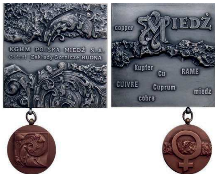
Rys. 35. Medal Oddział Zakłady Górnicze Rudna z 1997 r.

Ciekawy medal z przywieszką wyemitował KGHM Polska Miedź. Zakład Górniczy Rudna w 1997 r. (rys. 35). W górnej i dolnej części awersu znajduje się fakturowana powierzchnia jak ruda miedzi, ozdobiona fantazyjnym ornamentem. W środkowej części na gładkiej powierzchni zamieszczono napis: KGHM POLSKA MIEDŹ S.A. / Oddział Zakłady Górnicze RUDNA. Na rewersie w środku jest poziomy pas fakturowany jak ruda miedzi, powyżej i poniżej na gładkiej powierzchni napisy: MIEDŹ / copper / Kupfer / Cu / RAME / CUIVRE / Cuprum / miedź / cobre. Na awersie przywieszki znalazł się kwadrat ze stylizowanym logo ZG Rudna. Na rewersie na tle pasa fakturowanego jak ruda miedzi alchemiczny znak miedzi. Medal zaprojektowała i wykonała Hanna Jelonek. Medal wybito z tombaku srebrzonego i oksydowanego w kształcie kwadratu o boku 65 mm, okrągłą przywieszkę o średnicy 30 mm wykonano z miedzi. W nakładzie 200 sztuk wybiła go Mennica Państwowa (tombak patynowany).