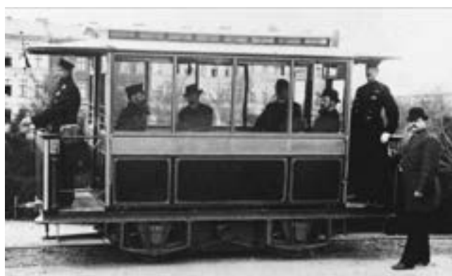
Rys. 2. Pierwszy tramwaj elektryczny w Lichterfelde, 1881

O uruchomieniu pierwszej linii tramwaju elektrycznego przez firmę Siemens ciekawie pisze A. Przytułski w artykule Elektryczne środki komunikacji na przełomie XIX i XX wieku : Po upływie dwóch lat od berlińskiej wystawy uruchomiono w stolicy Niemiec pierwsze na świecie połączenie tramwajowe. ( ) Po wielu staraniach niemiecki przemysłowiec uzyskał koncesję na budowę linii