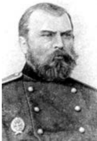
Rys. 3. Fiodor Pirocki w 1898

polskich wynalazców i inżynierów by o uważanych za Rosjan np. Micha Doliwo-Dobrowolski. Jednak propaganda stalinowska w historii tramwaju elektrycznego powołała na wynalazcę Fiodora Pirockiego 1 (rys. 3) (1845-1898) spowodowała dużo zamieszania, które zresztą trwa do dziś.