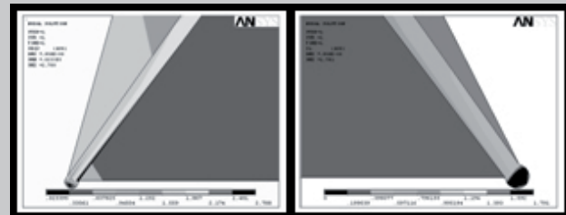
RYS.2. Naprężenia zredukowane w lewej przyszyjkowej stronie korony oraz rozciągające w prawej przyszyjkowej stronie korony. FIG.2. Stresses reduced in the left cervix side of the crown and tensile stresses in the right side of the crown.

In the left cervix section of the crown model there is the highest cutting stress, which may result in the unsticking in the adhesive connection between the dental crown cap and the dentine. In the right cervix section of the model there are the highest tensile stresses that are particularly hazardous for ceramics not resistant to this type of stress (FIG.2). Cutting stresses extend as far as the secant of a tooth. Ce-