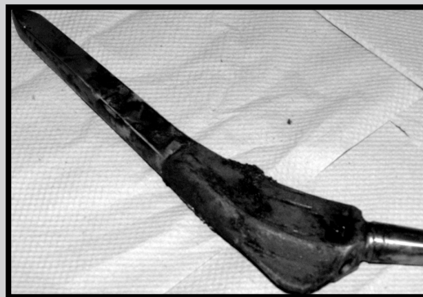
RYS.3. Zmiany korozyjne zachodzące na powierzchni materiału [4]. FIG.3. The corrosion changes occurring on the biomaterial surface [4].

Damaging of the passive surface layer causes a direct contact between cells and the surface of the material. The biomaterial releases the alloy components into the environment surrounding the biomaterial. The corrosion changes occurring on the material surface intensify the inflammation reaction. Its consequence is dieing out of some cells and proliferation of others, which in turn results in remodeling the tissue sticking to the biomaterial [6].