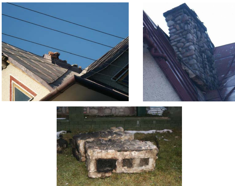
Ryc. 11. Uszkodzenia kominów Fig. 11. Damages to chimneys

Znaczna część zgłoszonych po trzęsieniu ziemi uszkodzeń dotyczyła kominów trzonów kuchennych w jednorodzinnych budynkach mieszkalnych. Najbardziej ucierpiały górne