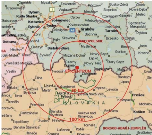
Ryc. 8. Epicentrum trzęsienia ziemi z 30 XI 2004 r. na Podhalu

Richtera. Głębokość ogniska wstrząsu określono na ok. 10 km. Wstrząs odczuwalny był w Małopolsce, na Górnym Śląsku i Słowacji, w promieniu ponad 100 km od epicentrum, które znajdowało się w okolicach Czarnego Dunajca (zob. ryc. 8), ok. 15 km na południowy zachód od Nowego Targu. Według relacji mieszkańców trzeszczały ściany domów, drgały szyby, przesuwały się meble, spadały doniczki z kwiatami i inne przedmioty. Po wstrząsie głównym zaobserwowano liczne słabsze wstrząsy następce. Występowanie trzęsień ziemi na Podhalu nie jest niczym wyjątkowym, gdyż podobne zjawiska obserwowano na tym terenie w przeszłości. Poprzedni wstrząs sejsmiczny o sile ok. 3,7 stopni w skali Richtera miał miejsce dnia 11 IX 1995 r. (dwa mniejsze wstrząsy następce wystąpiły 13 X 1995 r.). Zdaniem sejsmologów występowanie trzęsień ziemi na terenie Podhala to efekt ciągłego wypiętrzania się Karpat.