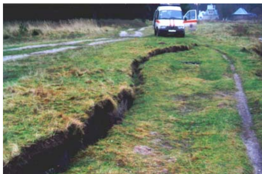
Ryc. 3. Uszkodzenia gruntu w okolicach epicentrum wstrząsów

Interesującym, choć dość zagadkowym zjawiskiem, jak na tak umiarkowane trzęsienie ziemi, jest pojawienie się uszkodzeń gruntu (ryc. 3). Doszło nawet do znacznego obsunięcia ziemi na trasie ruchu kolei podmiejskiej w okolicach miejscowości Swietłogorsk, czyli bardzo blisko epicentrum wstrząsów. Obsunięcie to, widoczne na zdjęciu przedstawionym na ryc. 4, miało głębokość ok. 15 m i szerokość ok. 30 m. Ruch pociągów między stacjami Swietłogorsk-1 i Swietłogorsk-2 został wstrzymany. W krajach o bardzo dużej sejsmiczności, jak Chile czy Japonia, podobne efekty powstają na skutek tzw. upłynnienia gruntu ( liquefaction ). Są to jednak zjawiska występujące jedynie podczas wstrząsów o bardzo dużej magnitudzie, na ogół większej od 7. Upłynnieniu gruntu sprzyja długi czas trwania wymuszeń, z jakim często mamy do czynienia podczas największych trzęsień ziemi. Na podstawie posiadanych informacji trudno jest jednoznacznie ocenić, czy mogło tu dojść do upłynnienia gruntu. Gdyby tak było, to uznać można, że zaistniałe zjawisko miało w epicentrum większą intensywność niż na to wskazują inne ustalenia.