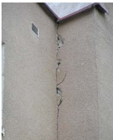
Ryc. 7. Suwałki, budynek mieszkalny, ul. Reja, pęknięcie tynku w miejscu dylatacji

wie geologicznej skorupy ziemskiej na drodze tych fal, nie jest rzadkością, że izosejsty (krzywe wokół epicentrum opisujące miejsca o tych samych intensywnościach) mają kształt eliptyczny, wskazując na kierunek lepszej propagacji fal.