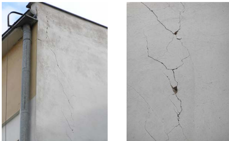
Ryc. 5. Suwałki, Szkoła Podstawowa nr 10, ul. Antoniewicza, pęknięcia tynku na ścianie szczytowej

Kilka dni po trzęsieniach ziemi autorzy odwiedzili miasta północno-wschodniej Polski, aby ocenić zakres uszkodzeń budowli. Na podstawie informacji z inspektoratów budowlanych ustalono też ogólną liczbę uszkodzonych obiektów na terenie Polski na około 100 w 23 miejscowościach. Większość tych uszkodzeń powstała w obiektach starych, znajdujących się już wcześniej w złym lub nienajlepszym stanie technicznym. Najwięcej szkód stwierdzono w Suwałkach, gdzie odczuwalność wstrząsów była największa. Tam też uszkodzenia wystąpiły również w budynkach nowych oraz znajdujących się w dobrym stanie technicznym. Zgromadzono dużą dokumentację fotograficzną destrukcyjnych skutków wstrząsów (zob. [3]).