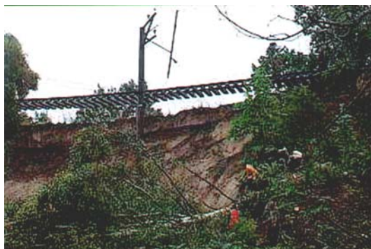
Ryc. 4. Obsunięcie ziemi na trasie kolejki podmiejskiej w okolicach miejscowości Swiętłogorsk