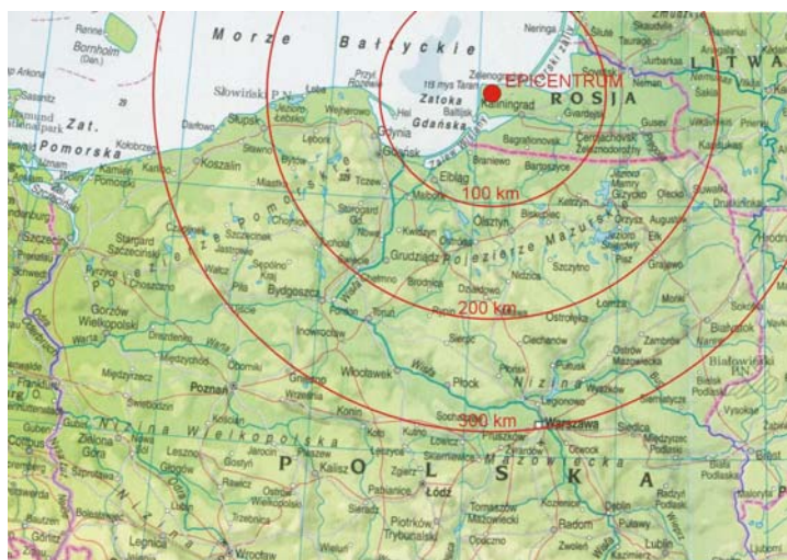
Ryc. 1. Epicentrum wstrząsu sejsmicznego z 21 IX 2004 r. (godz. 15.32)

W dniu 21 IX 2004 r. na terenie Obwodu Kaliningradzkiego wystąpiły dwa wstrząsy sejsmiczne. Pierwszy z nich nastąpił o godzinie 13.05 CET (czas środkowoeuropejski). Jego magnituda oszacowana została na 5,0 w skali Richtera, a położenie epicentrum ustalono na bałtyckie wybrzeże Obwodu Kaliningradzkiego. O godzinie 15.32 CET miał miejsce wstrząs drugi o magnitudzie 5,3. W tym wypadku epicentrum wstrząsu zlokalizowano dokładniej – na terenie Obwodu pomiędzy miejscowościami Swietłogorsk i Primorje od północy a miejscowością Primorsk od południowego wschodu (zob. ryc. 1).