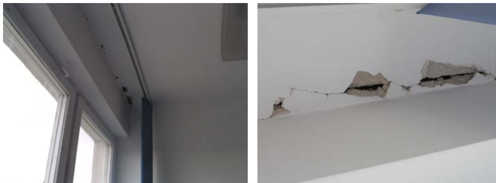
Ryc. 6. Suwałki, Centrum Edukacji Nauczycieli, ul. Reja, charakterystyczne pęknięcia tynku pomiędzy stropem a nadprożem okiennym