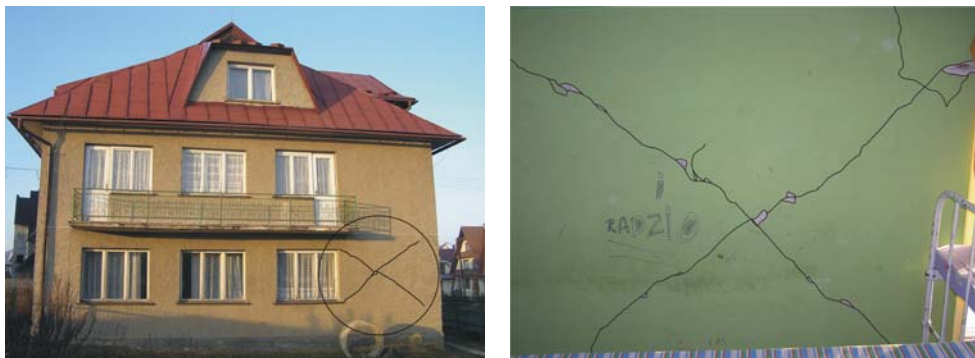
Ryc. 10. Ciche-Miętustwo – dom parafialny, widok ogólny, i tzw. krzyż św. Andrzeja Fig. 10. Ciche-Miętustwo – parish house, general view and so called "St Andrew's cross"