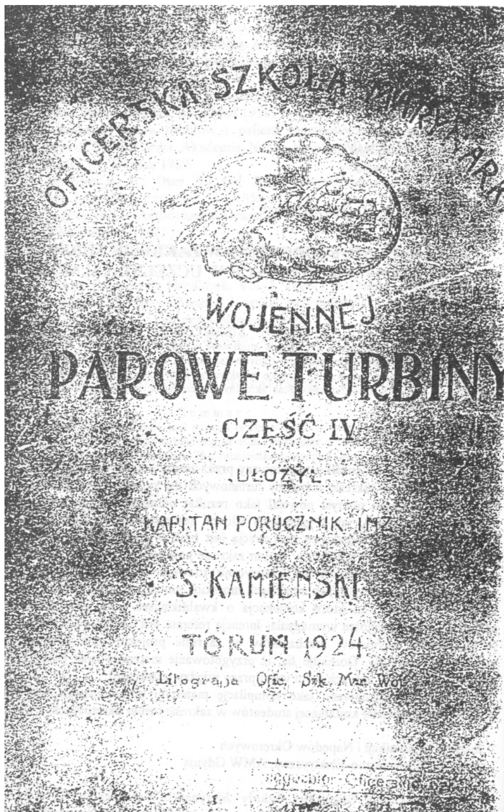
Rys. 1. Widok okładki podręcznika turbin parowych cz. IV, wydanej przez Oficerską Szkołę Marynarki Wojennej w Toruniu w 1924 r.