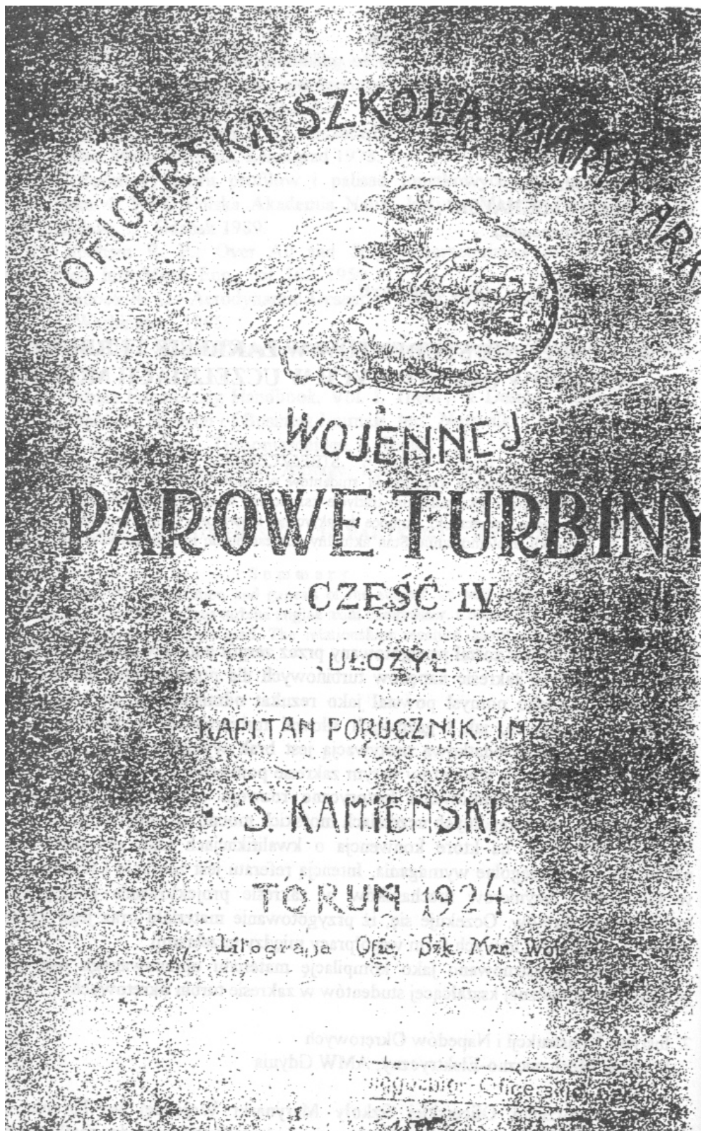
Rys. 1. Widok okładki podręcznika turbin parowych cz. IV, wydanej przez Oficerską Szkołę Marynarki Wojennej w Toruniu w 1924 r.