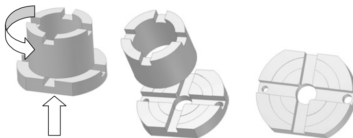
Rys. 2. Postać geometryczna próbek stosowanych w tribometrze PT-3. Od lewej do prawej: próbki w pozycji roboczej (strzałkami zaznaczono kierunek obrotów i siły dociskającej próbki), para próbek po rozsunięciu czół, próbka dolna (nieruchoma) z widocznym położeniem ścieżki tarcia

Ogólny schemat kinematyczny głowicy Tribometru PT przedstawiono na Rys. 1 . W urządzeniu tym napęd próbki ruchomej pochodzi od silnika prądu przemiennego, którego prędkość jest płynnie regulowana i kontrolowana z wykorzystaniem komputera. Moment obrotowy z silnika jest przenoszony przez przekładnię pasową na ułożyskowane w podporach hydrostatycznych (2, 3) wrzeciono 4, do którego swobodnego końca przymocowana jest próbka 5. Próbka dolna 6 jest dociskana do próbki górnej od dołu przez nurnikowy siłownik hydrauliczny, którego górna panewka kulista 10 jest przedstawiona schematycznie na rysunku. Nieruchoma próbka dolna 6 dla dwóch stopni swobody podparta jest sprężystości: 7 – ruch obrotowy w płaszczyźnie styku, 9 – ruch liniowy normalny do płaszczyzny styku. Układ elementów chwytowych i podpierających 9 próbkę dolną 6 jest zakończony od dołu kulistą stopą. Łącznie z panewką 10 na górnym końcu tłoka nurnika tworzy ona łożysko hydrostatyczne zasilane przez kanały w tłoku. Kulisty kształt łożyska podpierającego układ próbki dolnej zapewnia samonastawność i niwelację wpływu bicia czoła próbki górnej. Bezwładnik 8 umożliwia zmianę właściwości dynamicznych układu próbki dolnej w celu dostrojenia układu badawczego do warunków próby i minimalizacji ewentualnych drgań.