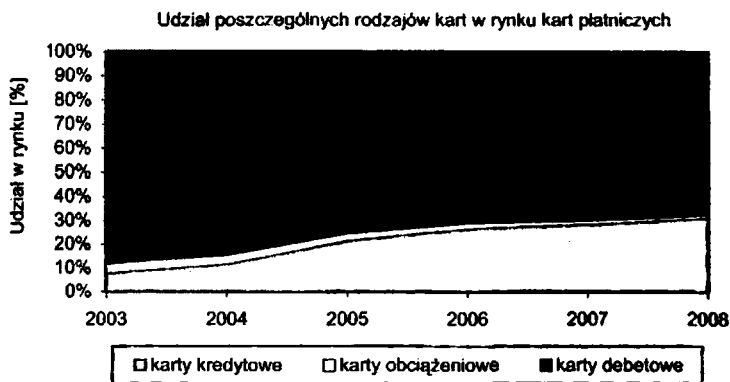
Rys. 3. Dynamika zmian rynku kart płatniczych w Polsce

Na rysunku 2 widać, że w Polsce dominujący udział na rynku kart płatniczych mają karty debetowe, których liczba na koniec 2008 roku sięgnęła blisko 20,5 miliona sztuk. Z roku na rok można zaobserwować także rosnącą liczbę kart kredytowych. Wzrost ten jest bardzo dynamiczny i od roku 2003 liczba kart kredytowych wzrosła z liczby 1,2 miliona sztuk do wolumenu prawie 9,5 miliona sztuk. Oznacza to wzrost blisko ośmiokrotny w porównaniu z początkiem analizy. Warto dodatkowo zaznaczyć, że całkowity udział kart kredytowych w liczbie wydanych kart ogółem jest na tyle dynamiczny, że nawet przy rosnącym rynku powoduje malejący udział kart debetowych w liczbie wydanych kart ogółem (rys. 3). Oznacza to, że dynamika kart kredytowych jest jeszcze większa niż dynamika całego rynku kart płatniczych. Mniejszym zainteresowaniem klientów cieszą się natomiast w ostatnich latach karty obciążeniowe. Liczba kart obciążeniowych od roku 2003 z 650 tysięcy sztuk spadła, aż o 35%, do poziomu 414 tysięcy. Malejący udział kart obciążeniowych, w rynku kart płatniczych ogółem, również można zaobserwować na rysunku 3.