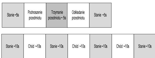
Rys. 2. Schemat sekwencji ruchu

Na rysunku 2 przedstawiono schemat sekwencji ruchu dla dwóch kategorii ruchu (chód, ruch rąk). Można zaobserwować, że sekwencja ruchu wykonywana dla kategorii chód składała się z trzykrotnie powtórnego chodu rozdzielonego 10 s momentami stania bez ruchu. Taki podział sekwencji umożliwił jednoznaczne wycięcie z sygnału jednej kategorii ruchu oraz zwielokrotnienie ilości ruchu należącego do danej kategorii (jedna osoba wykonywała chód dziewięciokrotnie).