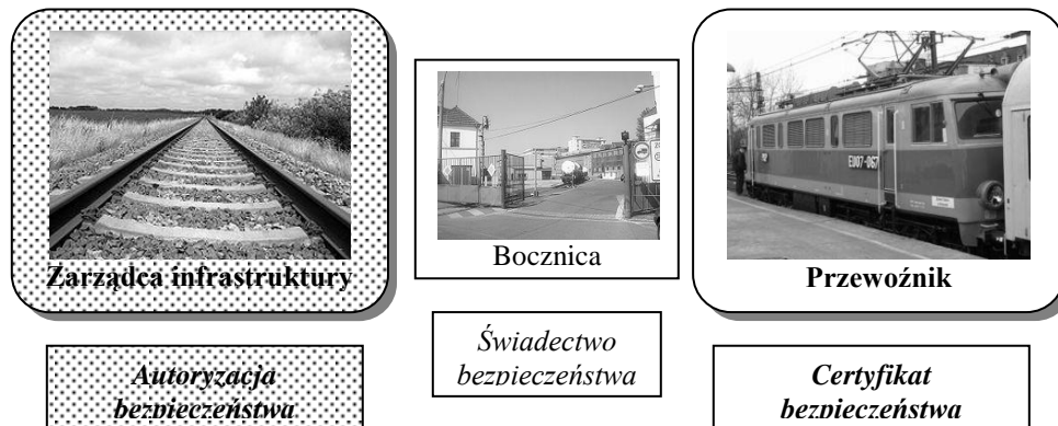
Rys.1. Dokumenty uprawniające do zarządzania i dostępu do infrastruktury kolejowej

Autoryzacja bezpieczeństwa obejmuje dokumenty potwierdzające akceptację systemu zarządzania bezpieczeństwem oraz akceptację wewnętrznych regulacji w celu spełnienia wymagań niezbędnych do bezpiecznego projektowania, eksploatacji i utrzymania infrastruktury kolejowej, w tym systemu nadzoru ruchu kolejowego i sygnalizacji.