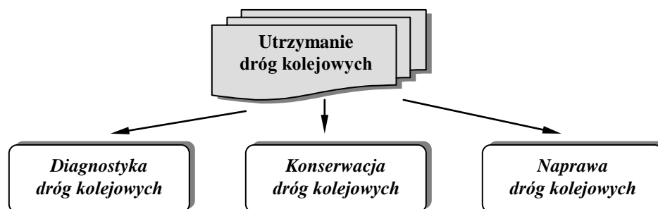
Rys. 2. Model utrzymania dróg kolejowych

Utrzymanie dróg kolejowych, to działania związane z procesem diagnozowania ich stanu, konserwacją, remontami i modernizacją (Rys. 2).