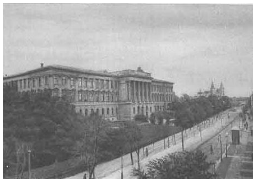
Il. 1. Gmach główny Politechniki Lwowskiej, J.O. Zachariewicz.