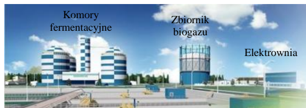
Rys. 2. Widok instalacji do wytwarzania biogazu w GOŚ [6] Fig. 2. View of biogas generation system in GOS [6]

Przykładem nowoczesnej oczyszczalni ścieków z rozbudowaną instalacją wytwarzania i utylizacji biogazu jest Grupowa Oczyszczalnia Ścieków w Łodzi (rys. 2). Instalacja produkcji biogazu składa się m.in. z trzech komór fermentacyjnych o pojemności 10 000 m 3 każda. Wyprodukowany w procesie fermentacji biogaz poddawany jest odsiarczaniu i magazynowaniu. Następnie przez stacje dmuchaw podawany jest do największej polskiej elektrociepłowni biogazowej składającej się z trzech agregatów prądotwórczych o łącznej mocy elektrycznej ok. 2,7 MW oraz cieplnej – ok. 3,5 MW, które zaspakajają potrzeby oczyszczalni w około 90%. W systemie ciągłym pracują dwa agregaty, trzeci stanowi zabezpieczenie na wypadek awarii.